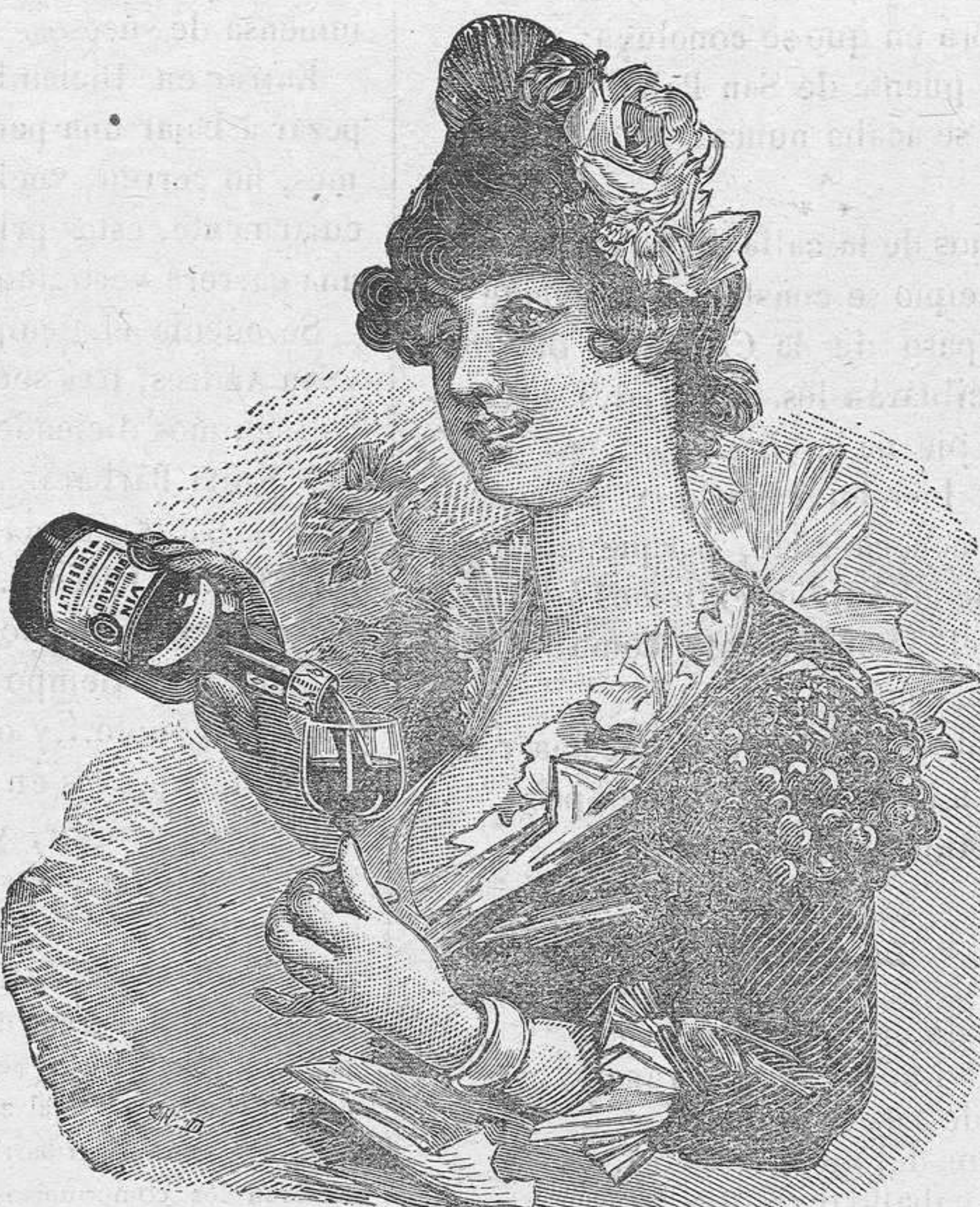
El VINO de BUGEAUD ha obtenido la recompensa más alta en la Exposición de Higiene de la Infancia de Paris (1887)

P. LEBEAULT & C ia , 5, Rue Bourg-l'Abbé, PARIS