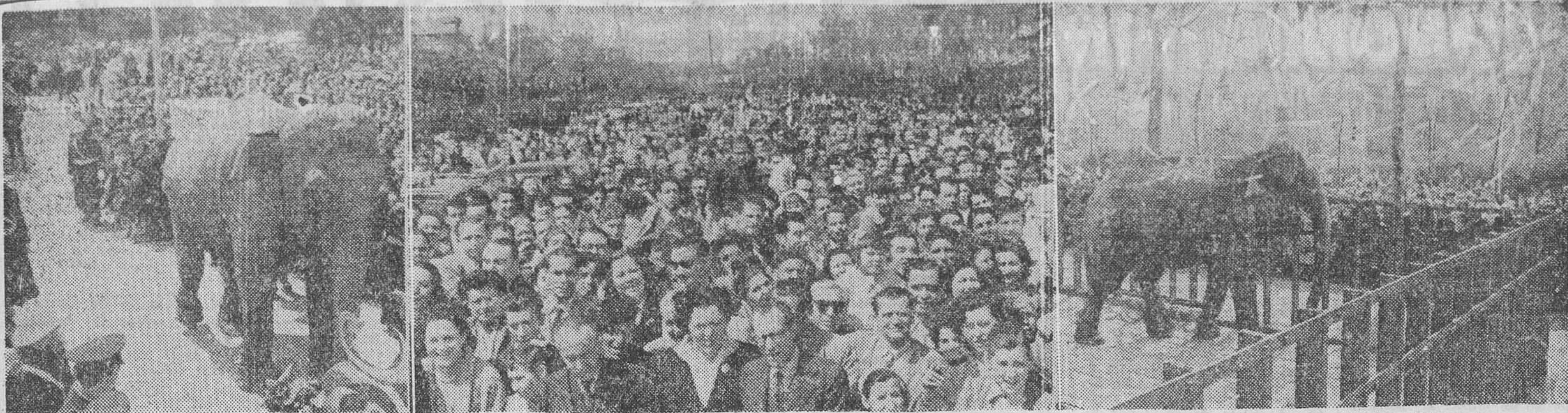
«Ran» haciendo su entrada en el Jardín Zoológico. — Un aspecto del inmenso gentío que acudió a recibir al proboscideo. — El nuevo elefante del «Zoo» barcelonés recibiendo las primeras visitas en su domicilio del Parque de la Ciudadela.