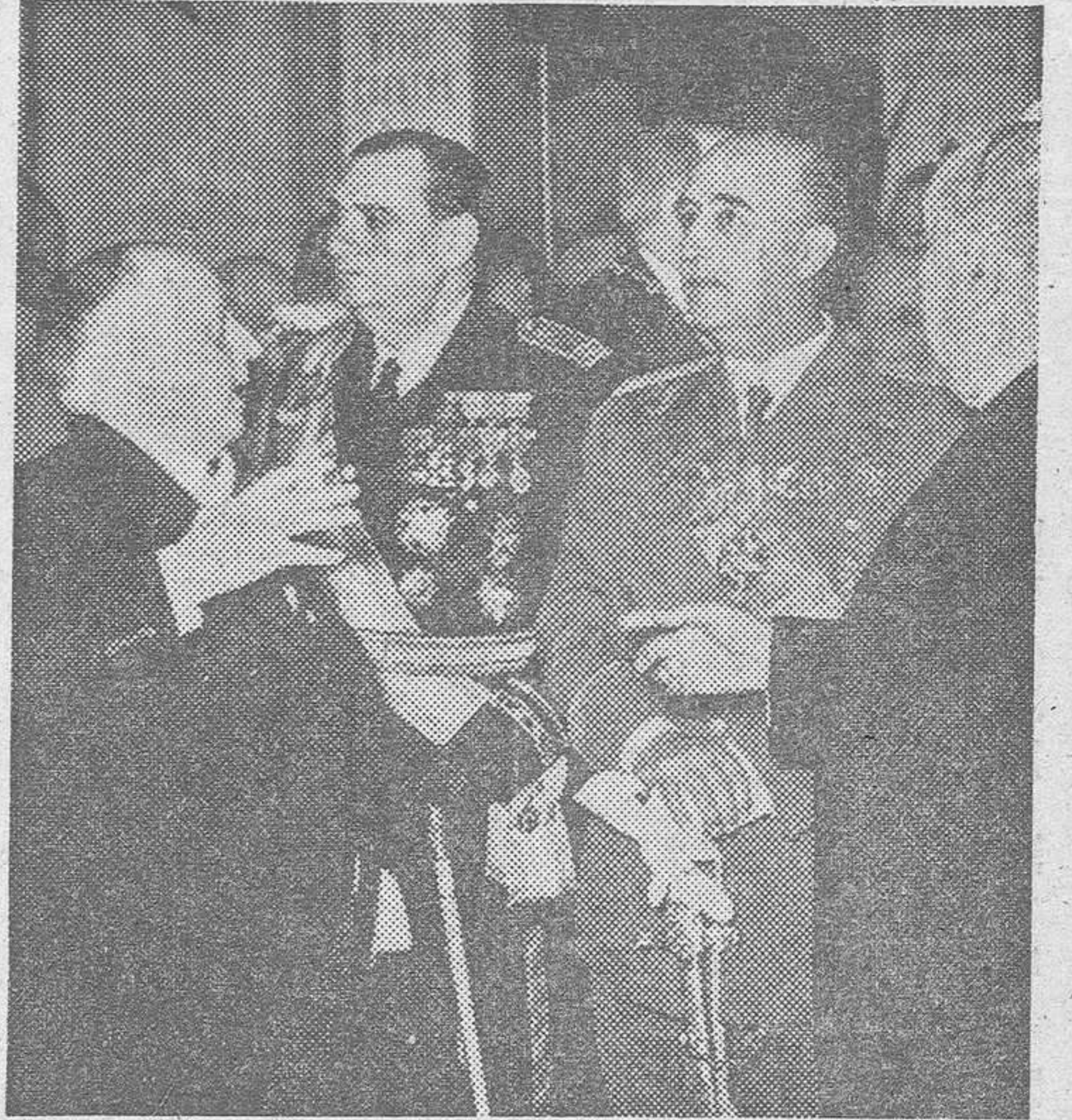
S. E. el Jefe del Estado, en el acto inaugural de la Exposición del Ahorro Benéfico