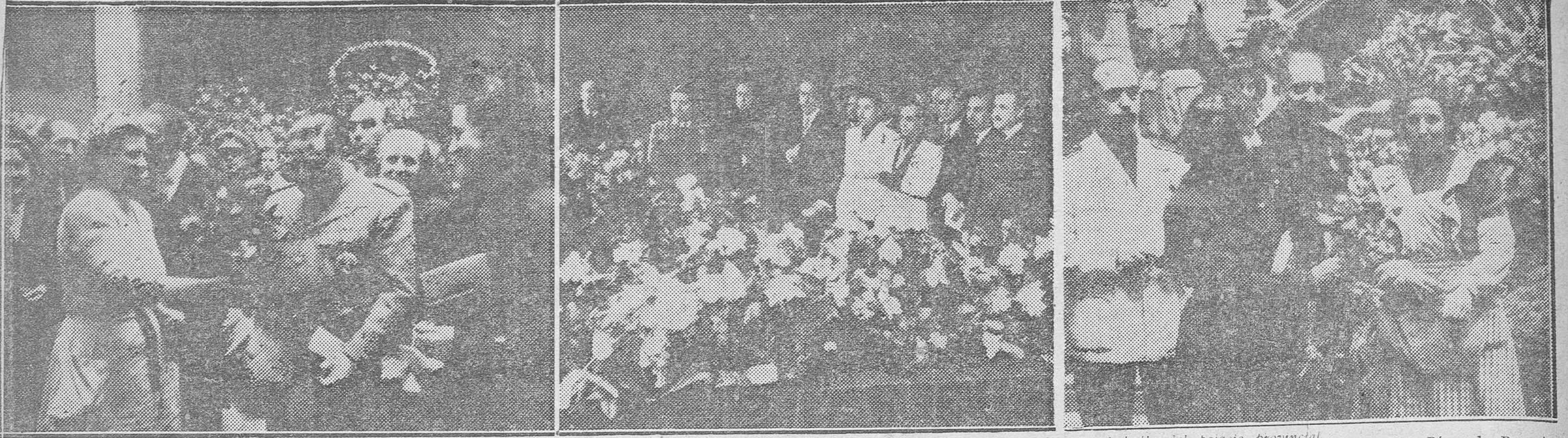
La feria de las rosas en la Diputación. Las autoridades asisten al acto de la bendición y recogen los puestos instalados en el patio del palacio provincial.