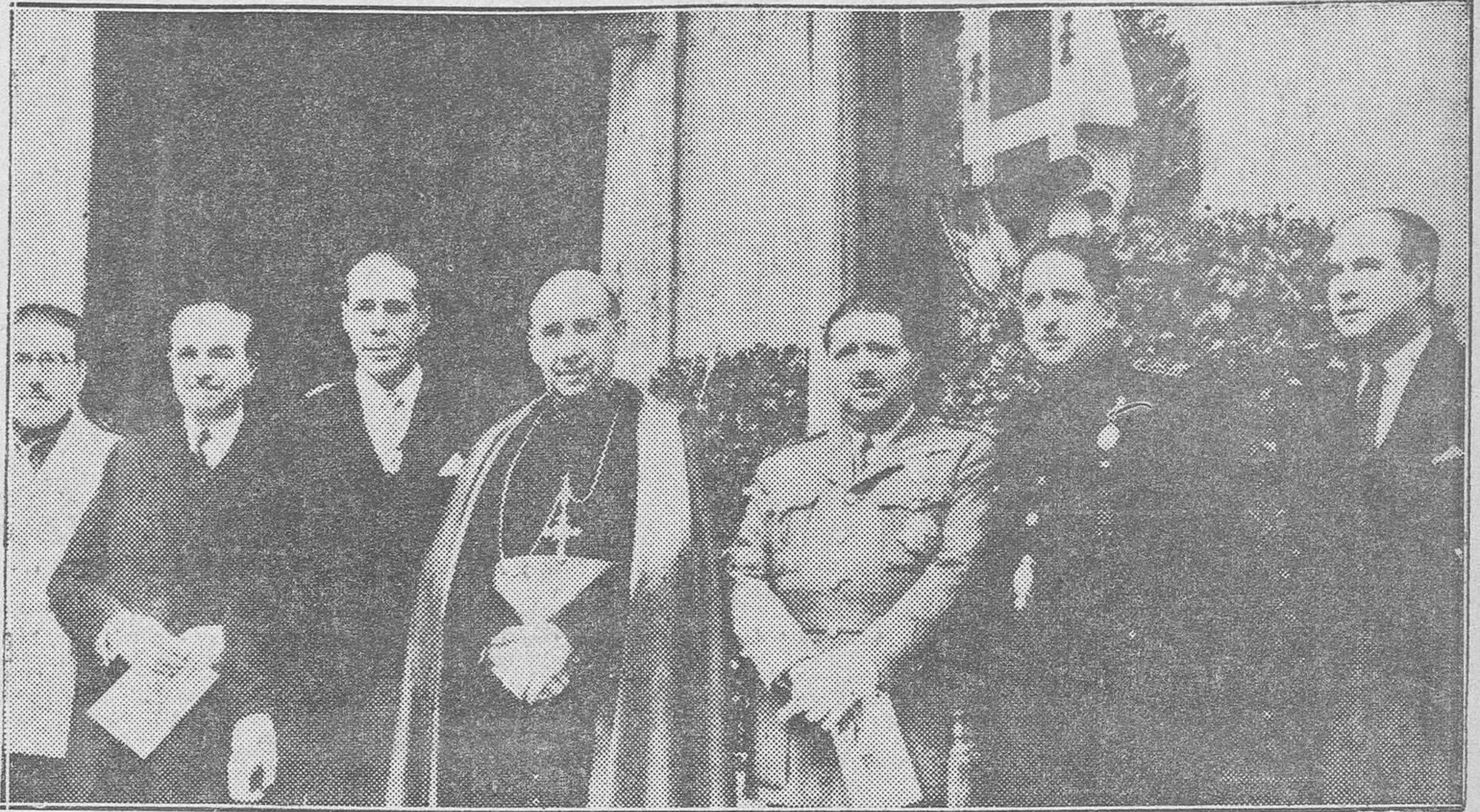
La Fiesta de San Jorge. — Las autoridades que presidieron los actos celebrados en la Diputación.