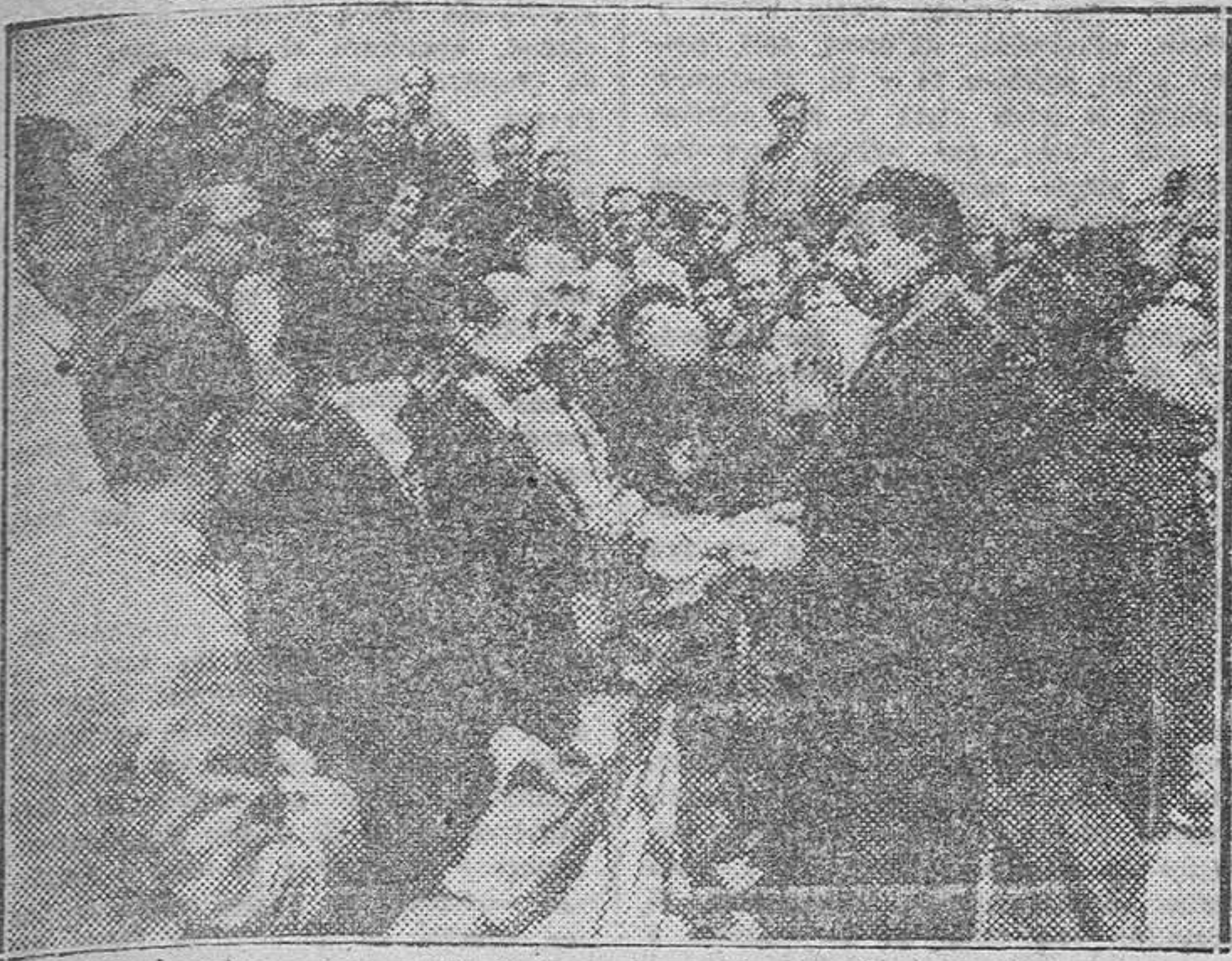
El Delegado provincial Sindical entrega los premios a los vencedores

Se celebró ayer, organizado por el Sindicato de la Construcción