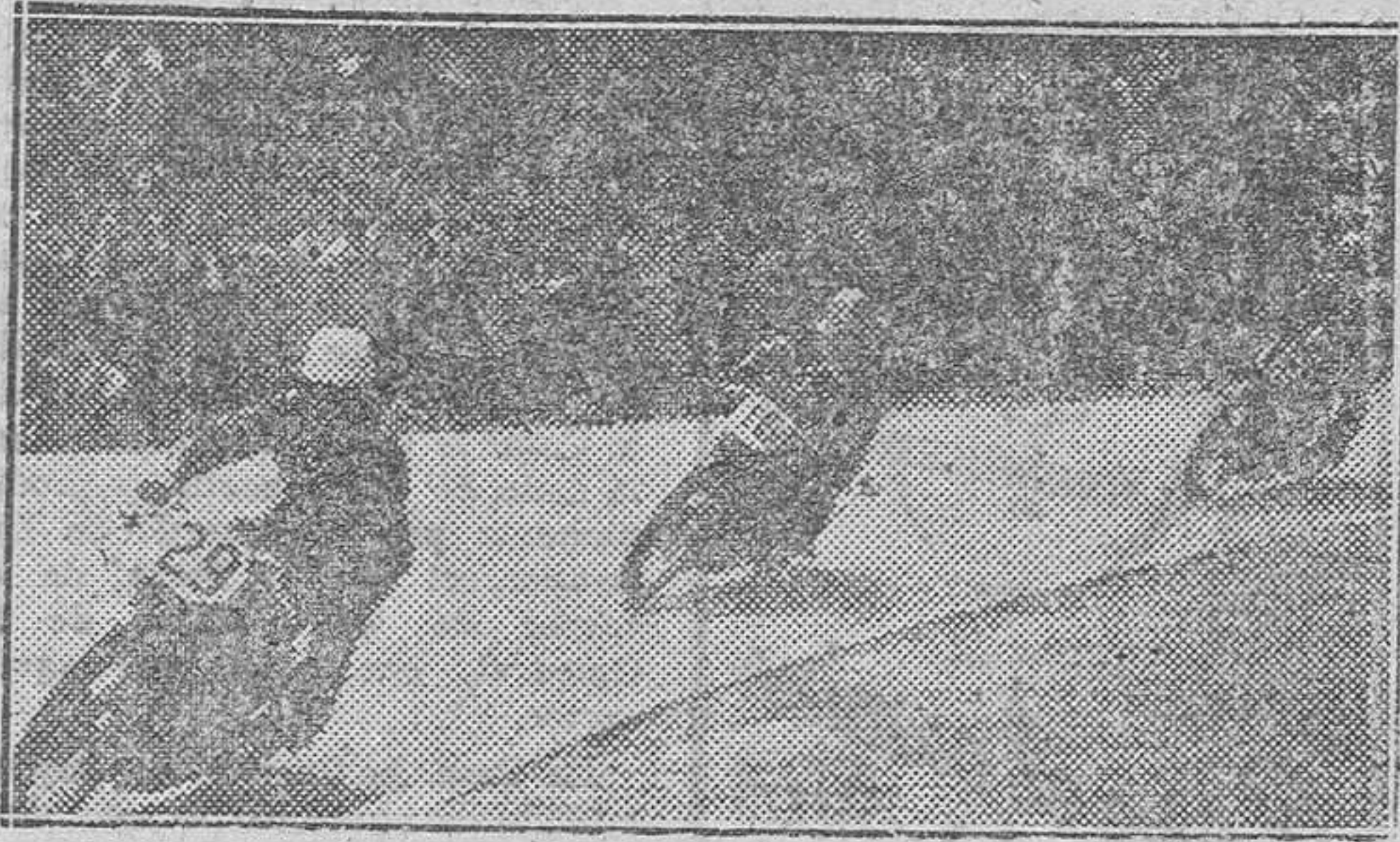
Un momento del desarrollo de la carrera para la clase de 350 cc., de ayer mañana, en el Circuito de Montjuich

Los organizadores, con gran puntualidad, iniciaron la jornada con la prueba de los