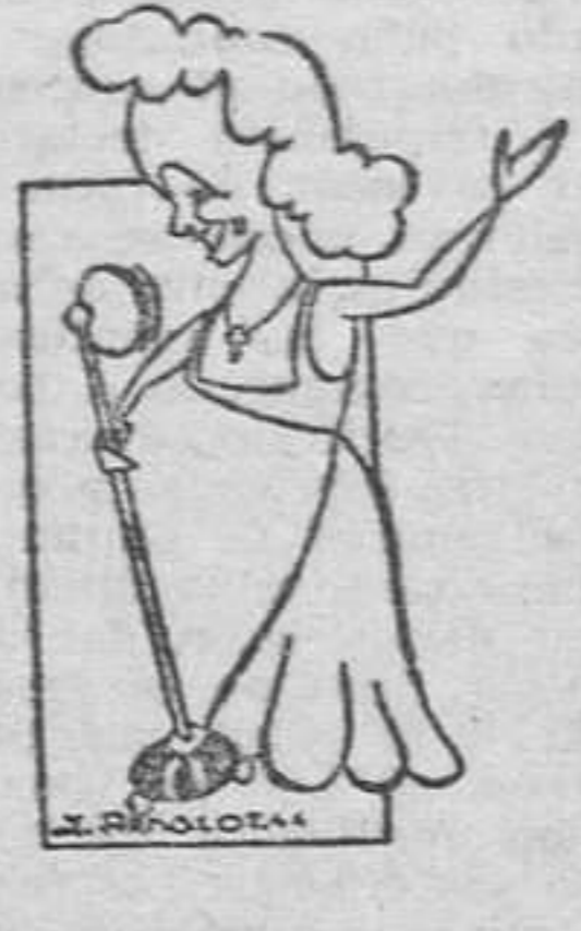
Dorit Kreysler, destacada figura en Fantasia de 1944, que se representa en el Cómico.