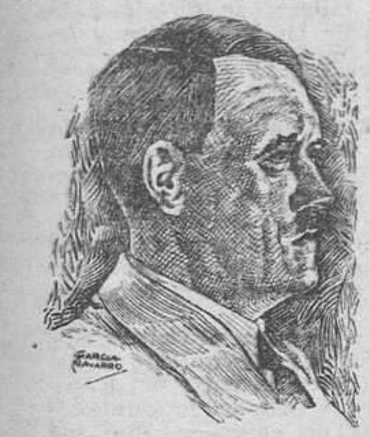
En la que, manifiesta, los estadistas de Inglaterra, Francia y Norteamérica, responsables de la guerra, tomaron en Washington la descabellada resolución de no permitir en ningún caso el resurgir de Alemania, tanto en lo económico como en lo político.

Londres, 15. — Comunicado del Almirantazgo: «Nuestras patrullas de superficie han entrado en contacto, en el Canal de la Mancha, con fuerzas ligeras enemigas. En la breve lucha resultó destruida una canoa torpedera automática y fué hundida otra. Nuestras fuerzas no sufrieron daños más que superficiales.» — Efe.