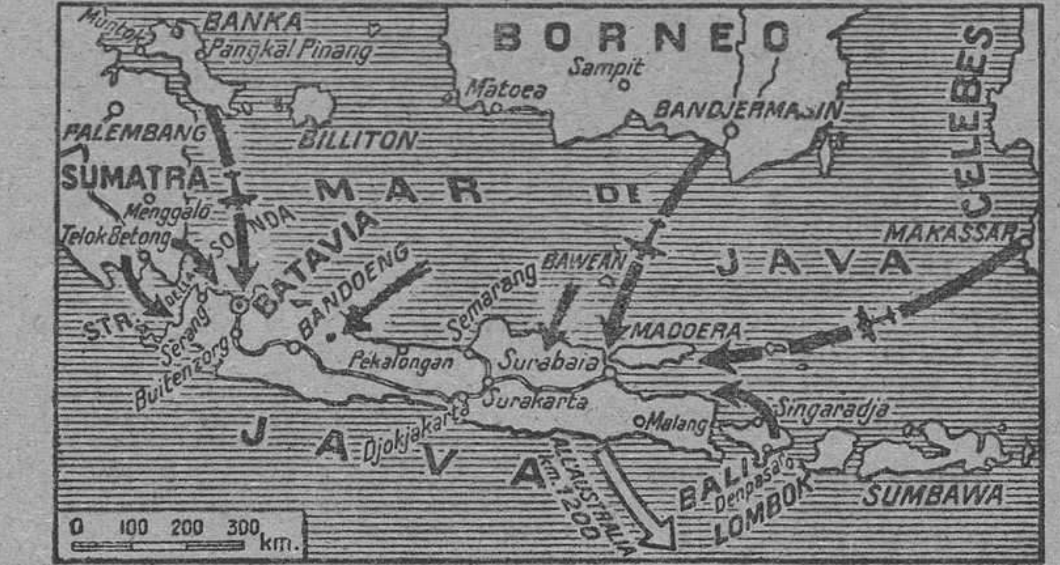
Las operaciones de conquista de la isla de Java por los japoneses se han efectuado siguiendo los ataques y desembarcos la dirección que señalan en el mapa las flechas negras.

Parece ser que a fin de hacer frente a la gravísima situación creada en todos los frentes a las fuerzas anglojaponesas, Londres y Washington han llegado a un acuerdo con sus aliados para distribuirse la tarea guerrera en los distintos espacios geopolíticos: según esta impresión, Estados Unidos se encargan de la lucha en el Pacífico; China, defenderá a Birmania y