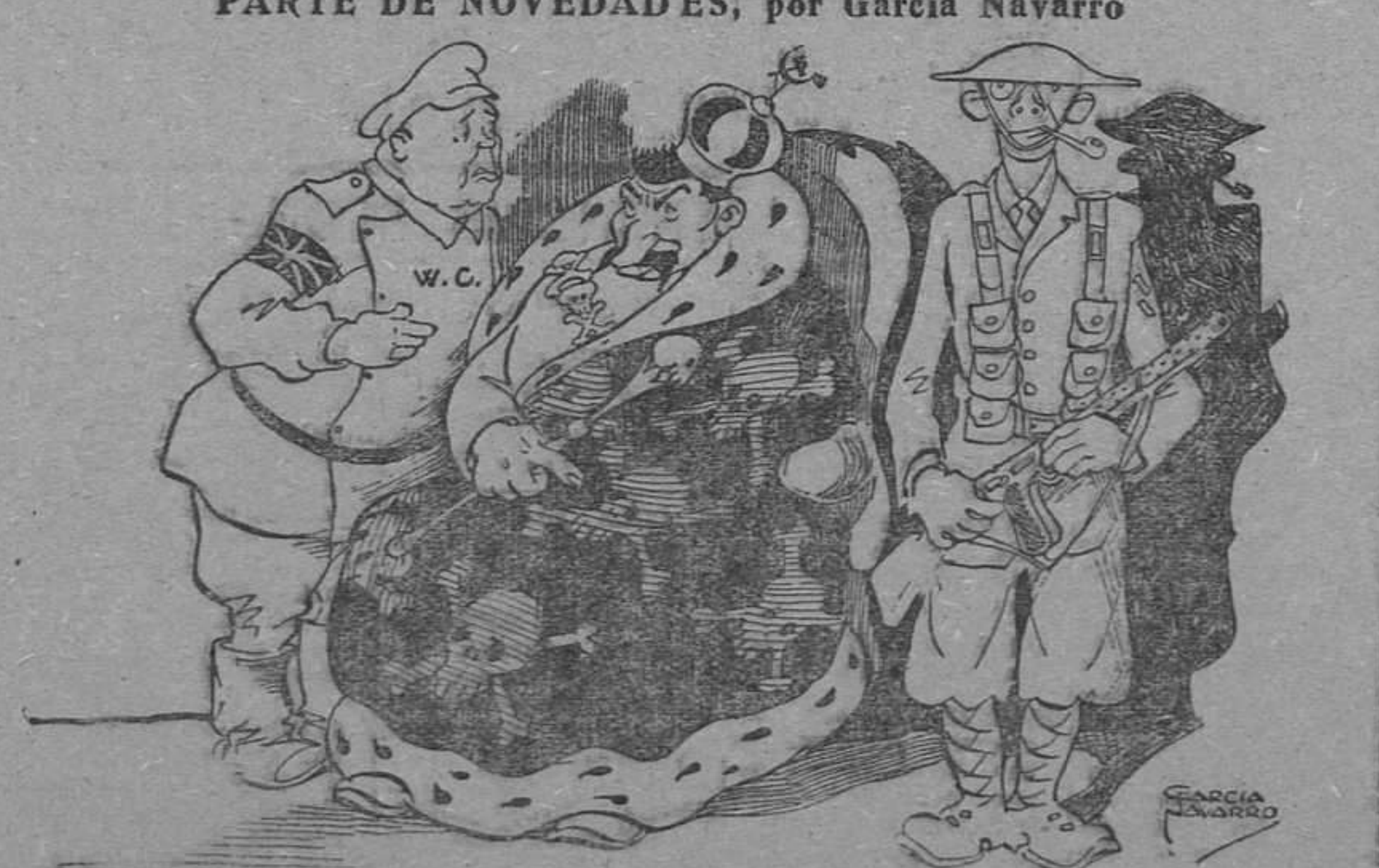
— Setecientos muertos, mil quinientos heridos y doscientas casas destruidas en París.

Se ha puesto a la venta al público (portería de la Casa Provincial de Caridad) el suplemento del «Boletín Oficial de la Provincia», que publica las Tarifas y Tabla de Exenciones de la Contribución Industrial de Comercio y Profesiones, con vigencia a partir del día 1.º de enero de 1942.