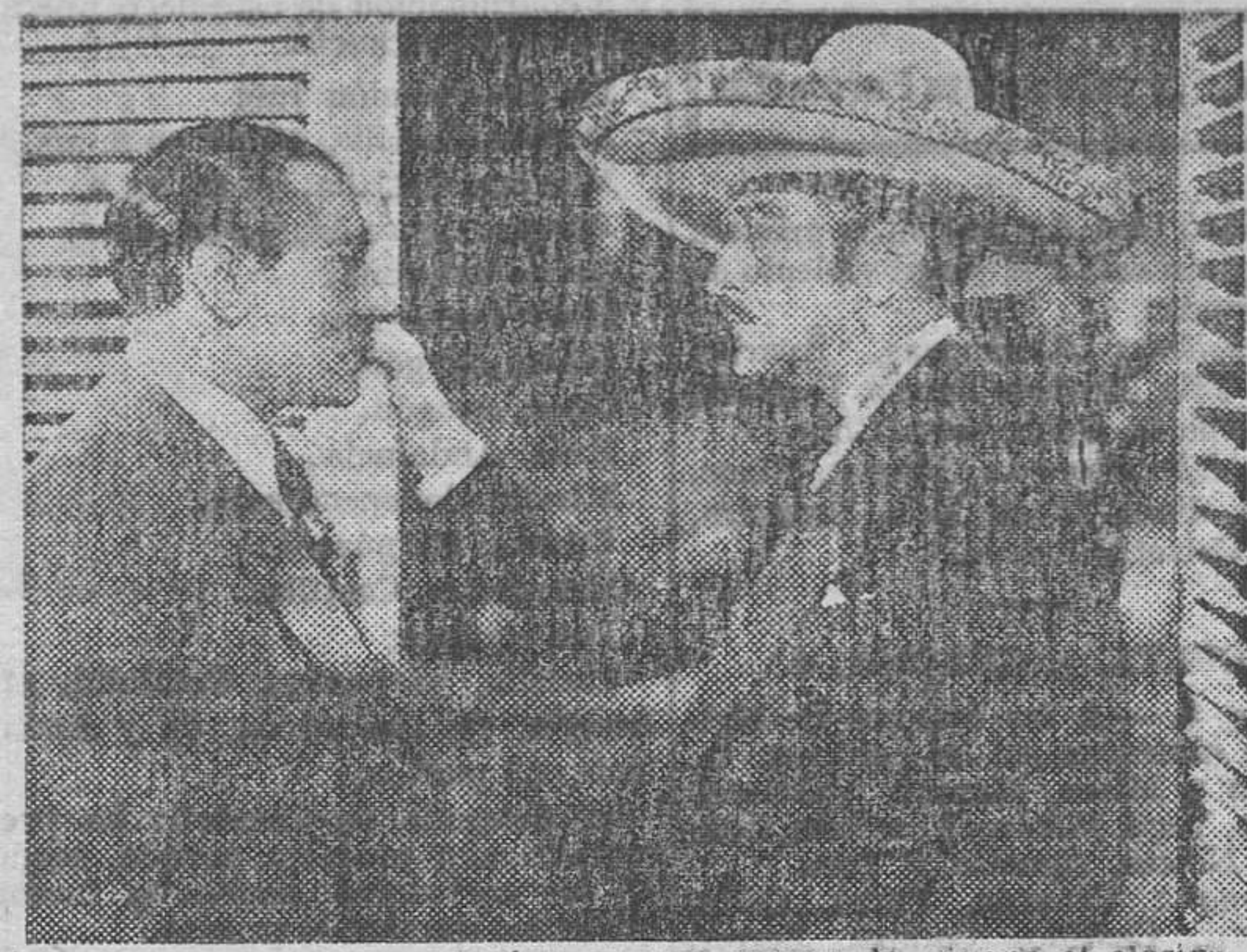
George Raft y Adolphe Menjou en una escena de «Suena el clarín» que hoy, lunes, se estrenará en el Coliseum

El esposo de Becky Sharp, Rawdon Crawley, es interpretado por Alan Mowbray, capacitado joven actor inglés que es un favorito del cine americano. Nigel Bruce, el cómico americano de carácter, fué una gran selección para el papel del amable Joseph Sedley, en cuyos brazos cae la fracasada Becky al final de la historia.