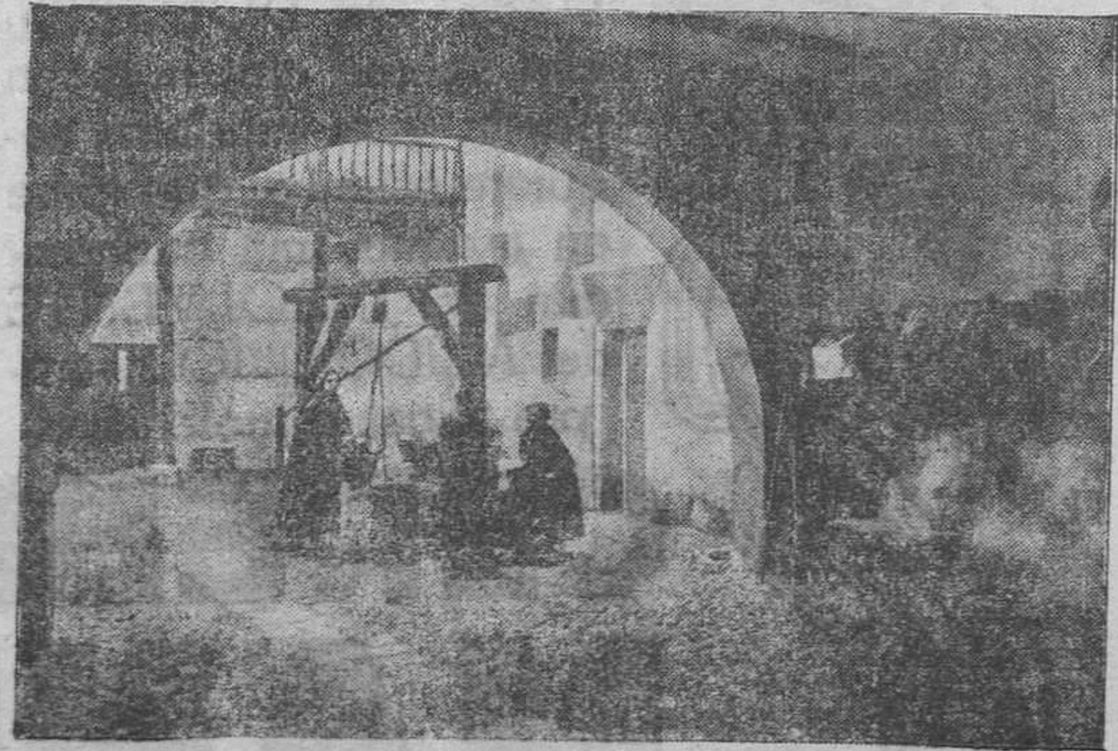
Patio de la Hostería del Estudiante (del P. N. T.)

Asimismo, se ha instalado un típico mesón castellano, denominado «Hostería del Estudiante», que con sus amplios y pintorescos patios, bodega y comedor, ornamentos con tinajas, jamones, sillas de montar, mantas, alforjas, candelas, etc., y muebles de arte popular regional, evocan los gloriosos tiempos de la Universi-