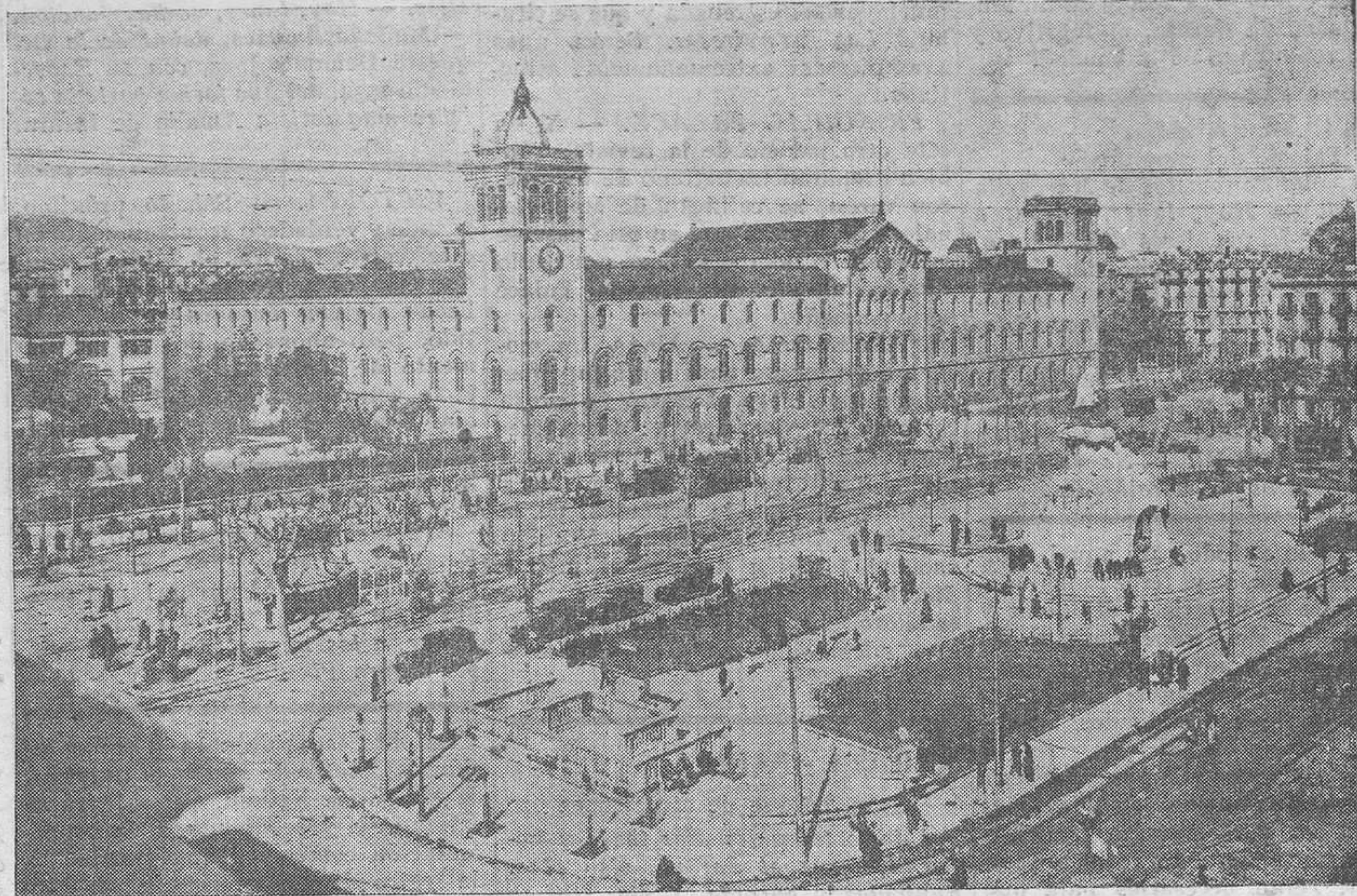
La libertad de Cataluña ha permitido que los obreros puedan incorporarse a la Universidad de Barcelona

pédico Popular, el Ateneo Polytechnic y el Centro Autonomista de Dependientes del Comercio y de la Industria. De esta forma se lograba sistematizar los estudios, hacer de ellos un conjunto orgánico.