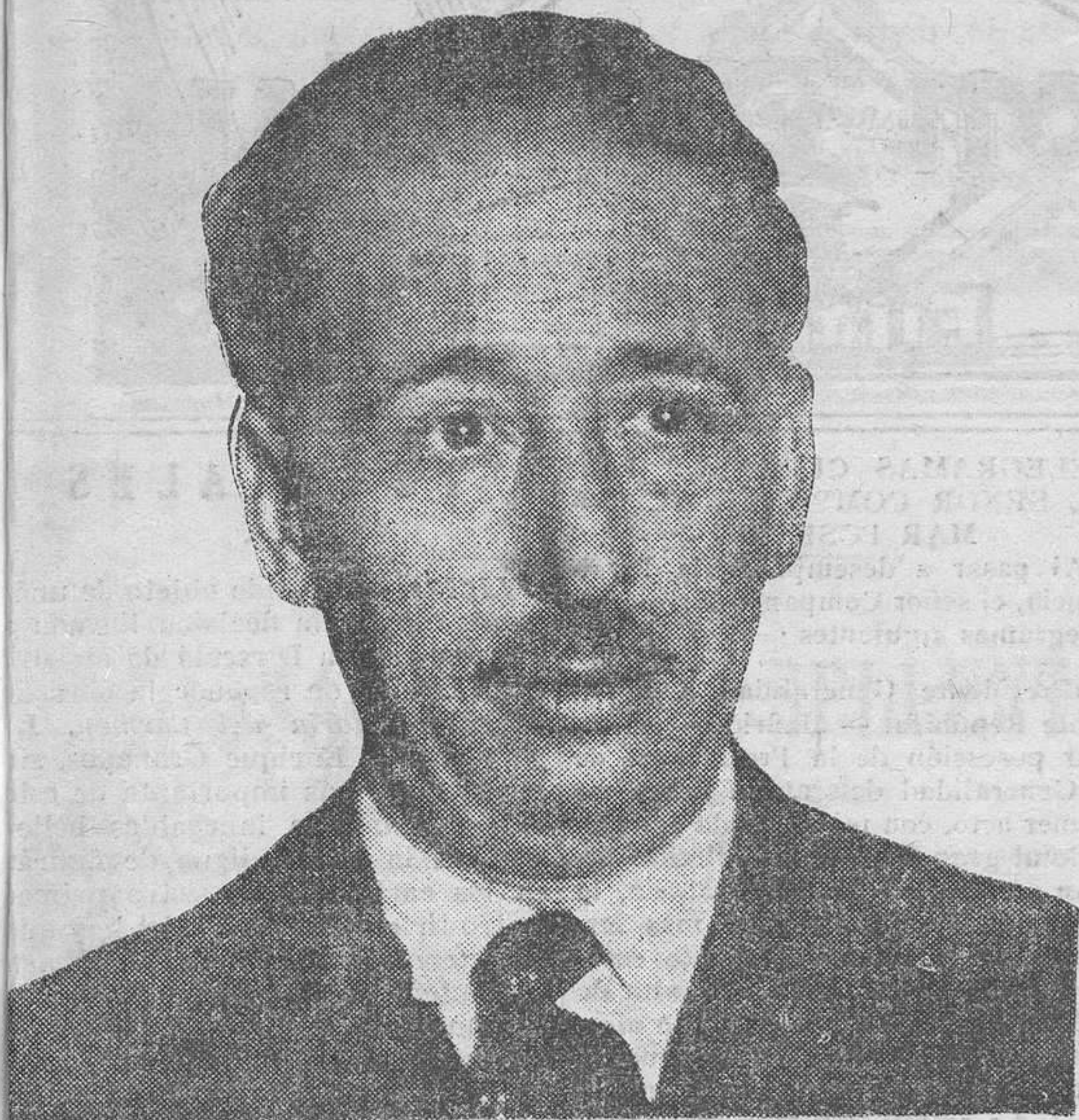
PRIMER DISCURSO DEL NUEVO PRESIDENTE DE LA GENERALIDAD AL PUEBLO DE CATALUÑA

El Gobierno, presidido por el señor Santaló, presentó la dimisión, y el señor Companys anunció que hoy empezará las gestiones para constituir el nuevo Consejo, que será de concentración izquierdista