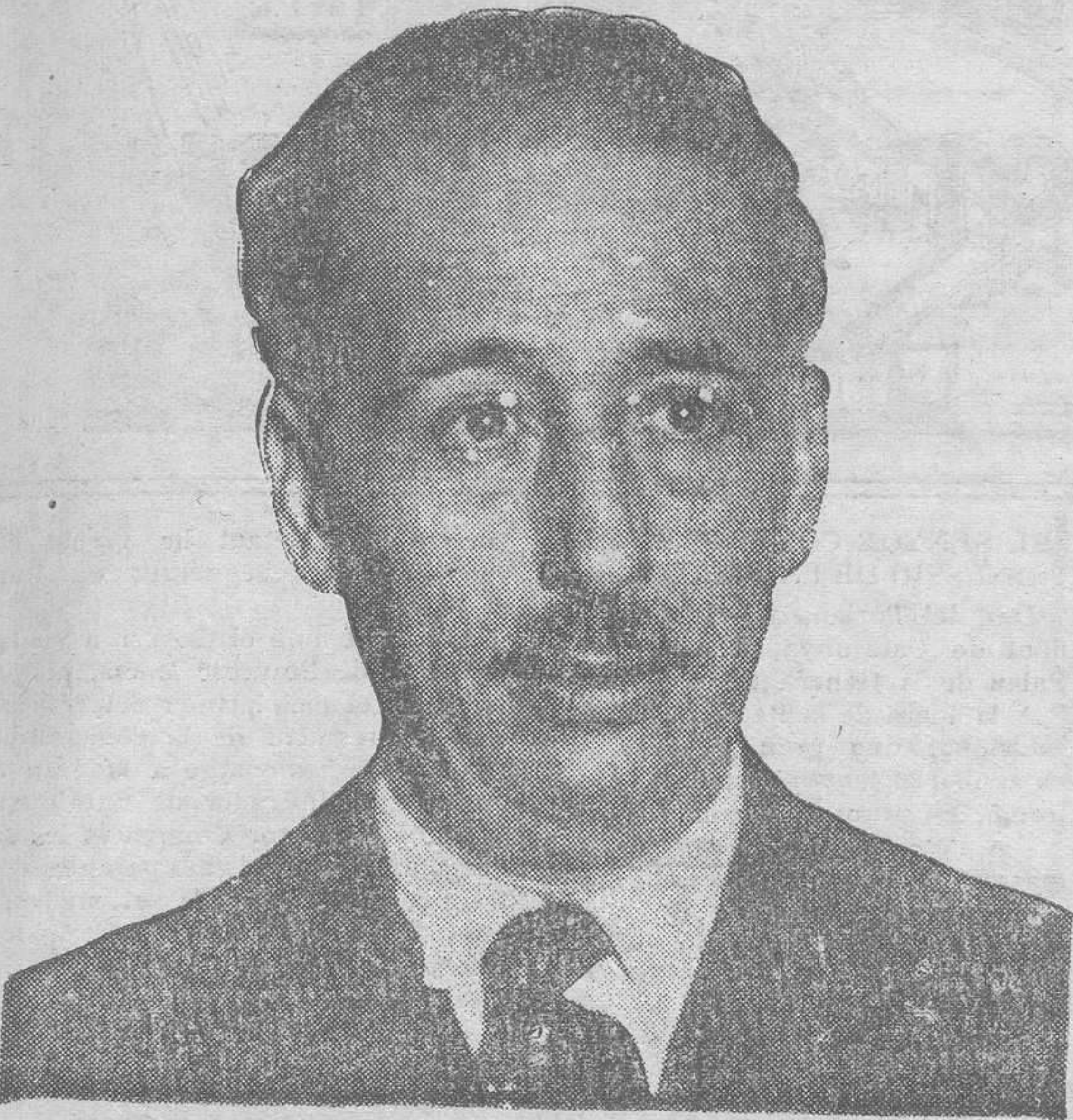
PRIMER PARLAMENT DEL NOU PRESIDENT DE LA GENERALITAT AL POBLE DE CATALUNYA

El Govern, presidit pel senyor Santaó, presentà la dimissió, i el senyor Companys anuncià que avui començarà les gestions oportunes per tal de constituir el nou Consell, que serà de concentració esquerrana