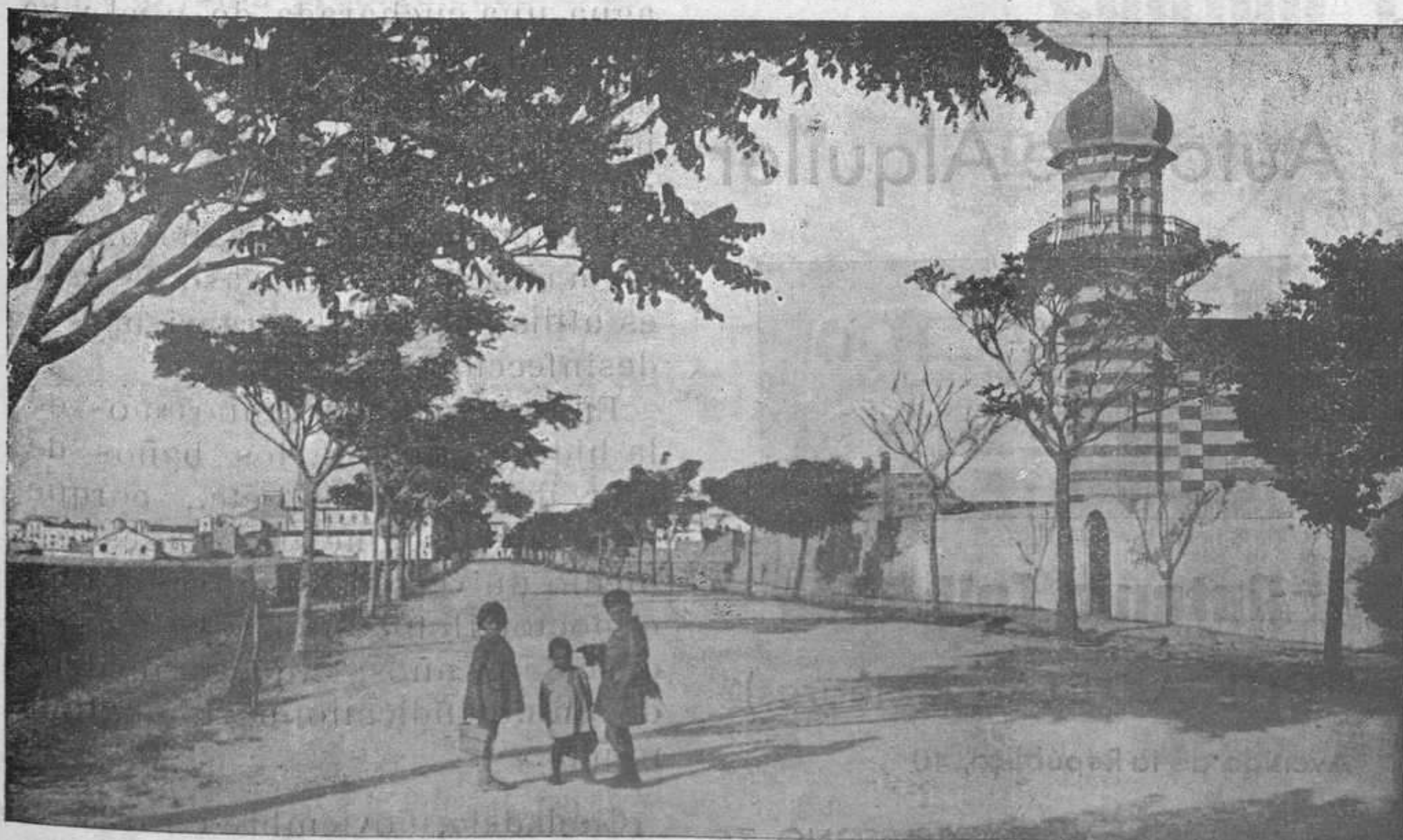
Los árboles no sirven únicamente para adornar y embellecer nuestras calles.