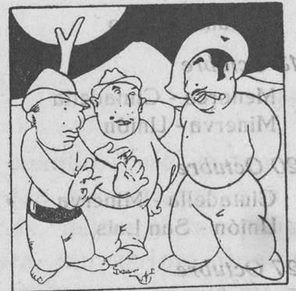
ENTRE DOS AGUAS

Domingo, 15. XIV de Pentecostés. Los Siete Dolores de Ntra. Sra.—Ss. Nicomedes, pb., Emilas, dc.