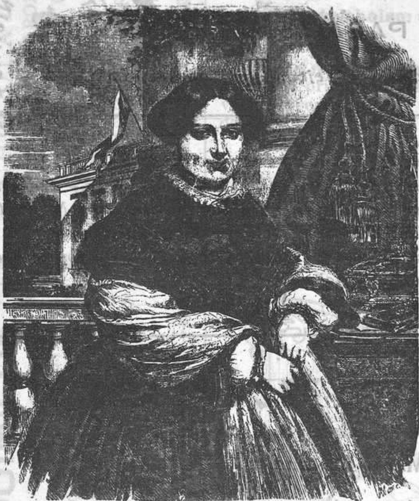
Doña María Cristina.

Esto es lo que os ofrece quien ayes y gemidos dará mientras no cobre con creces su pensión; la madre más madrastra que vieron los nacidos; hablando mal y pronto, «Cristina de Borbón».