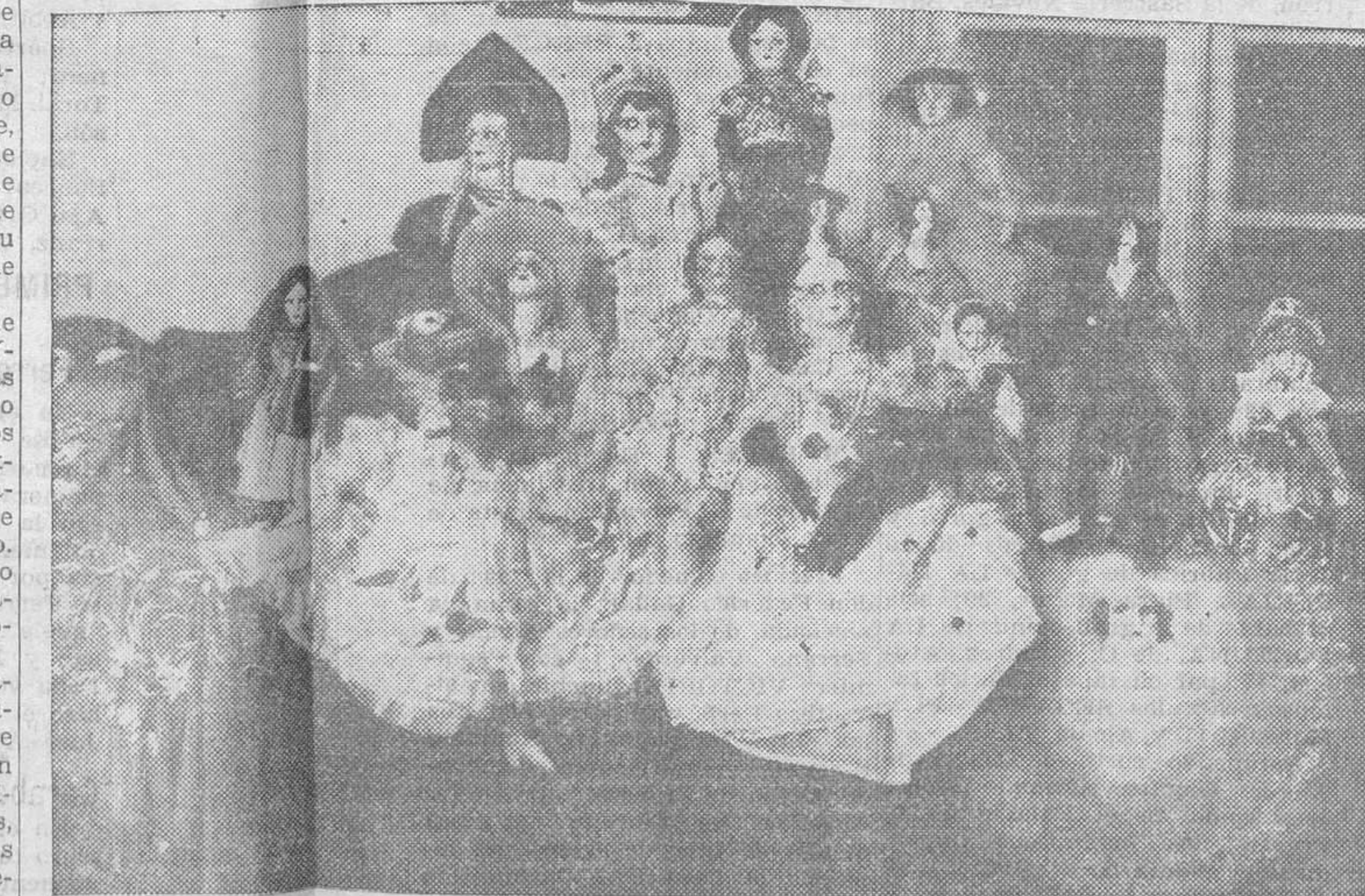
Damas alcurniadas de la aristocracia, artistas y tiples, reinas de la gracia, casas importantes, gentes elegantes, en grandes montones ofrecen, cual dones de su simpatía

Y continuemos con la lista. El "auto" ADLER, 8 HP., que lleva anexo el seguro por un año, regalado por la Anónima de Acci-