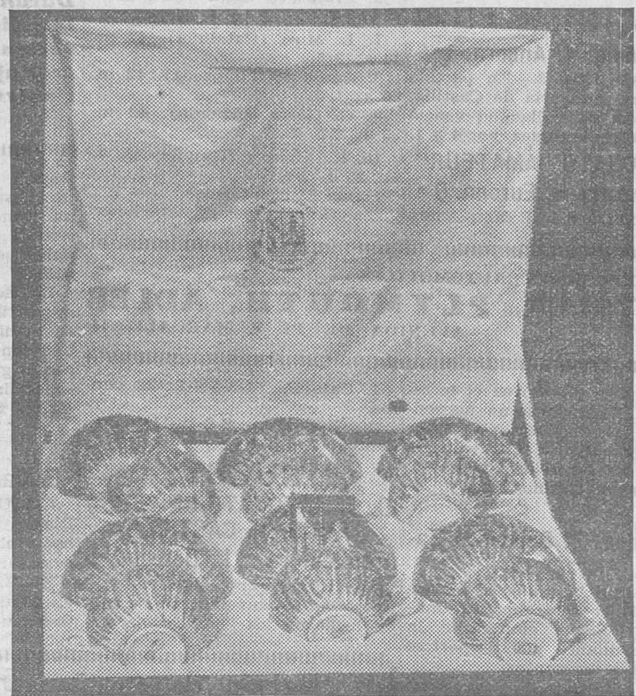
Este juego de té, que ven ustedes, [des,] [te] y ha hecho la fama del Extremo [Oriente]. (Esta nueva marca de té, dicho en prosa, porque no le encontramos consonante, es la "Panyone Congon".)

En su memoria conservaría siempre el recuerdo de aquellas horas felices. Pero la faltaba el fin, el epílogo, el despertar de su hermoso sueño para seguir soñando, y valga la paradoja; le faltaba la sorpresa que recibió en la noche siguiente, cuando hallándose con unos amigos en el restaurante a que antes hicimos referencia, compró un periódico, "La Voz", y al leer la reseña del Baile de la Prensa, vió que entre los favorecidos con los esplendidos regalos de nuestra tómbola, se hallaba ella misma, a quien había correspondido el magnífico y lujosísimo automóvil que se rifaba... ¿Comprendéis ahora la alegría, el regocijo, la ex-