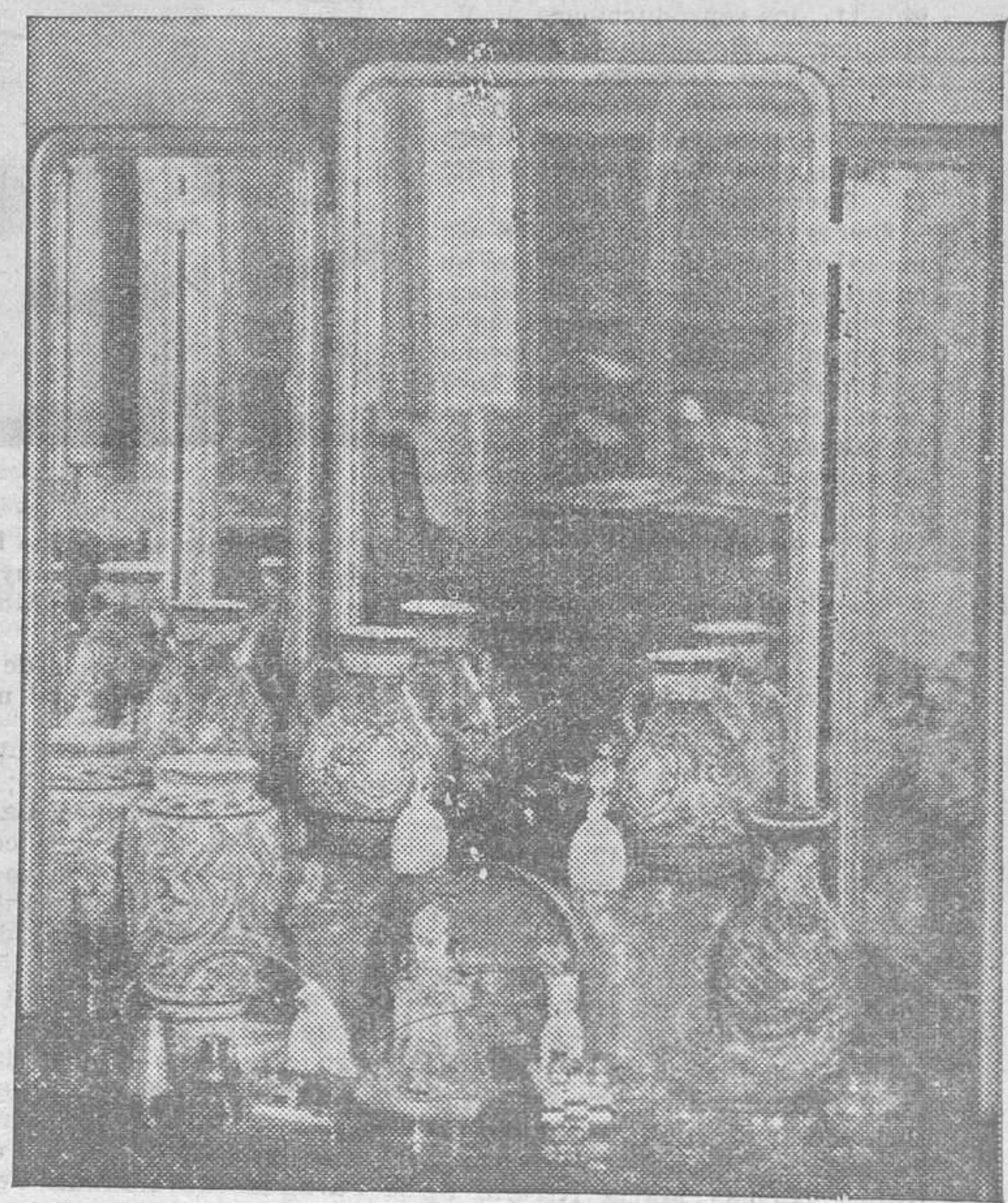
En cosas de arte hay un dínal. ¡Es cosa sublime! ¡Es cosa ideal ver en tal montón la rica figura modelo precioso de arte y de finura el bello jarrón, los grandes tñores de rico arabesco, cacharros "pa" flores y el tiesto chinés... Nuestra Asociación, que es una obra pia,