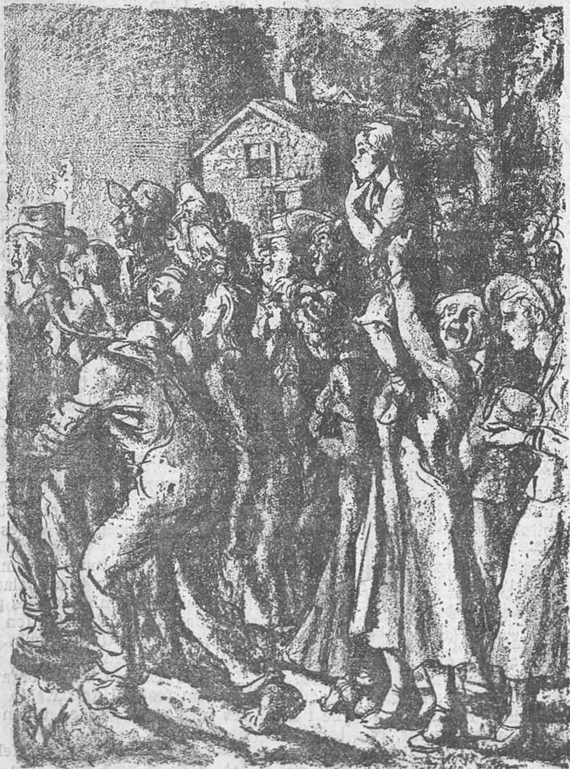
Amb quina atenció mira, pobreta! Veurà... Es el primer llinxament que veul

—No us comprenc —respongué Samuel, tot tranquil—. Si no tinc diners no puc menjar llagosta amb maionesa; ara que tinc diners no puc menjar llagosta amb maionesa. Aleshores, quan podré menjar llagosta amb maionesa?