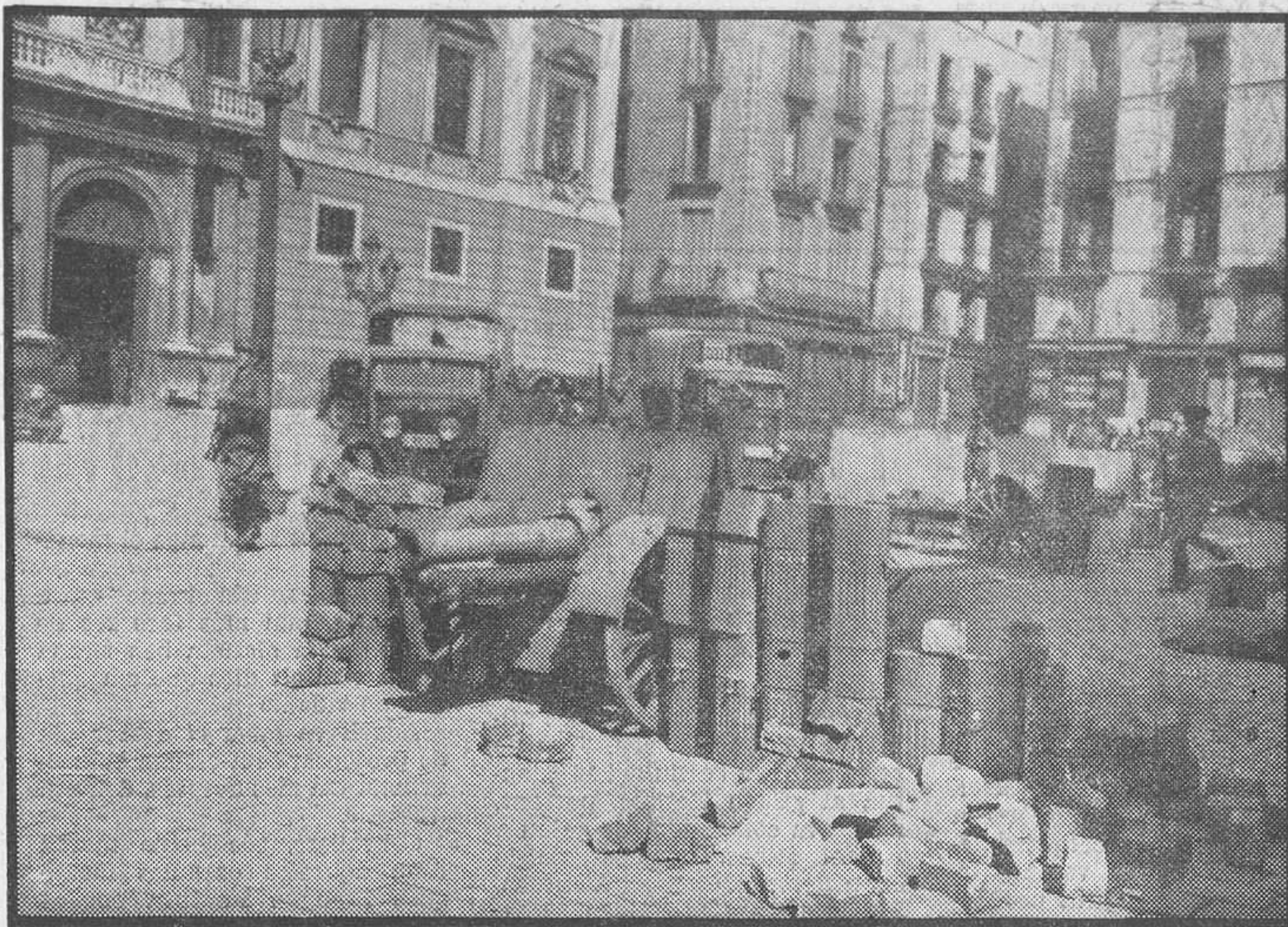
Una peça d'artilleria a la Plaça de la República

Les tres de la tarda. Surt al carrer el Sometent. El Sometent i altres forces de xoc d'«Estat Català». La desfilada de paisans amb arma llarga dona al panorama ciutadà un matís més acusat de revolta popular. Hom veu fusells nous, llampants, magnífics. I armes velles, antiquades, brutes. En algunes el portafusell és un cordill. Dada curiosa: a les hosts d'«Estat Català» no els manquen cornetes, ni abanderats ni cantineres. Amb tot i que les dones no es