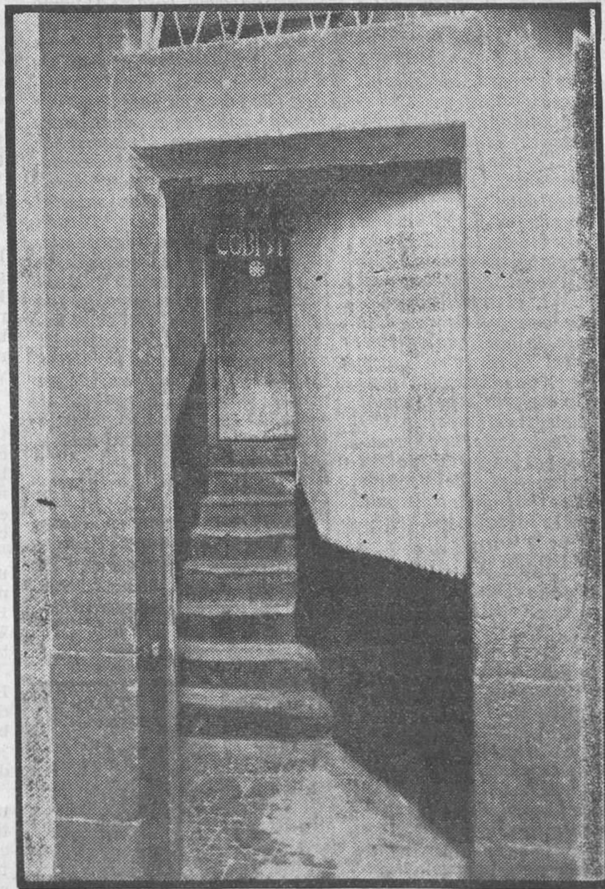
Les indústries del barri xinès