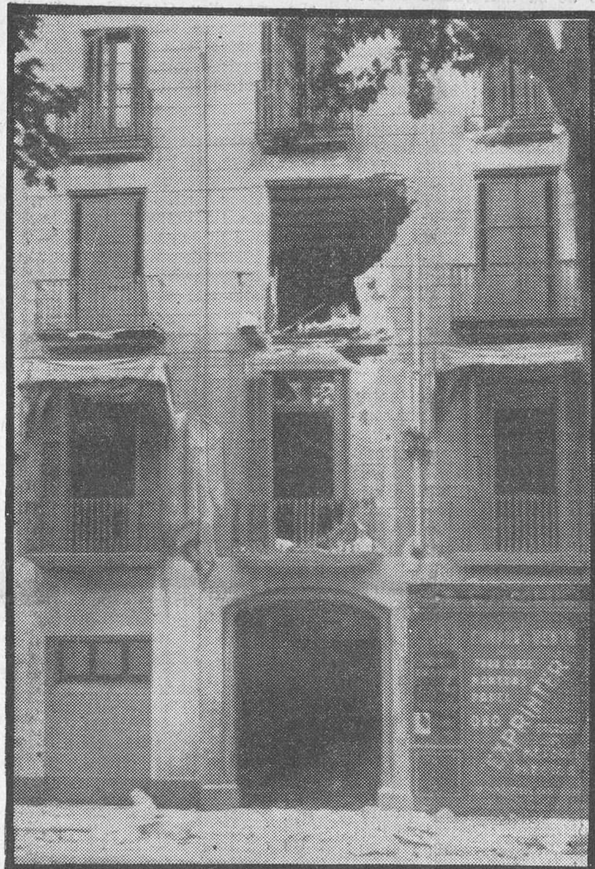
Efectes del bombardeig al local del Cadci

Les sis. Es hissada bandera blanca a la Generalitat i a l'Ajuntament, des d'on també tiren contra les forces.