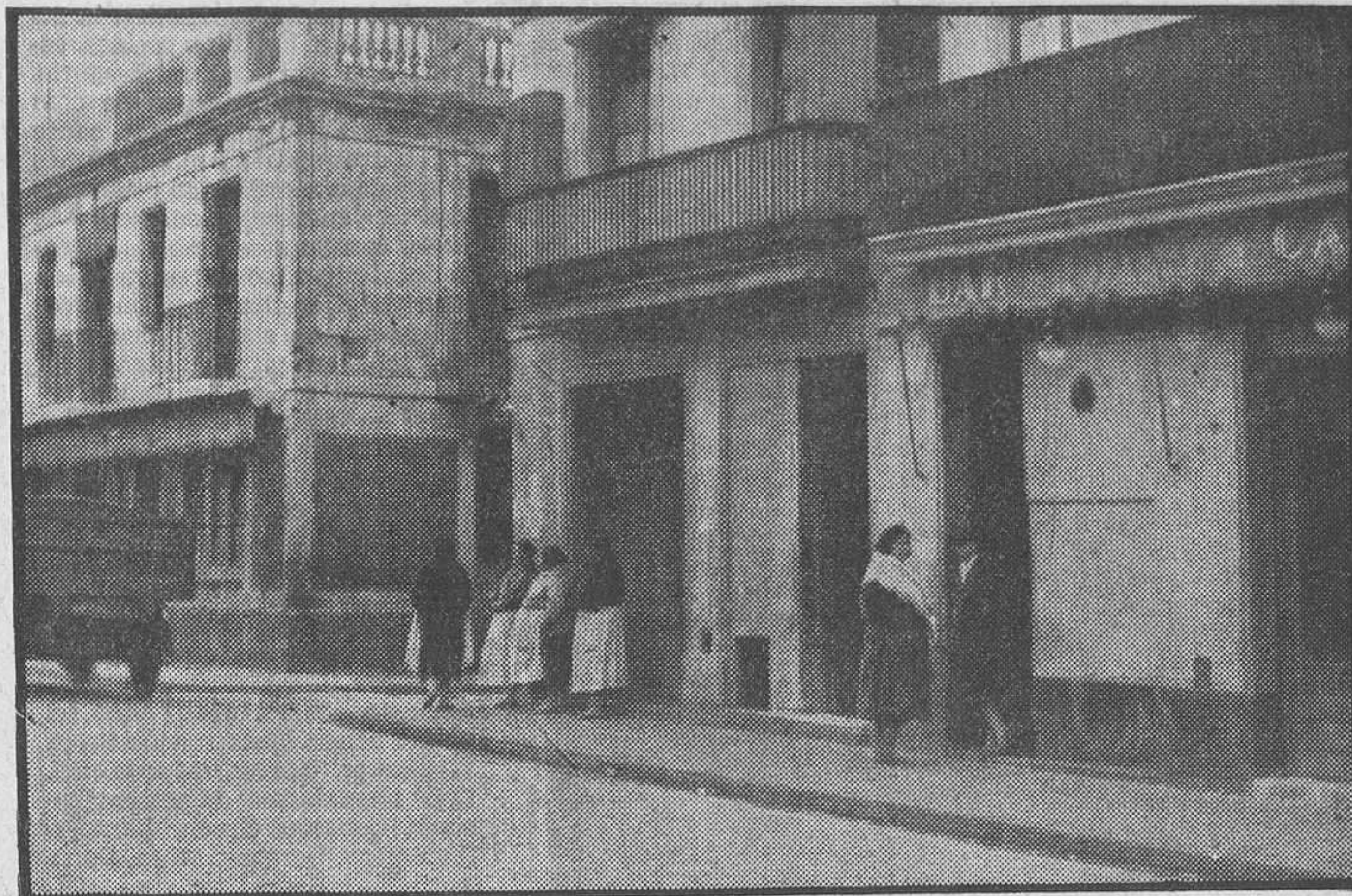
El dolorós espectacle de cada dia.

Mai no és igual, mai no s'assembla, i sempre sembla la mateixa. Enmig de gent sospitosa —timadors, carteristes, atracadors, reventapisos...— el soute-ner acreditat, l'invertit sense vergonya... i la persona decent que i va per a tastar un granet de picardia. L'escriptor d'imaginació poc fèrtil veu en aquella porqueria quelcom sentimental que no hi és. D'ací prové aquesta literatura cursi de les Drassanes, que ha fet néixer un «barri xinès» en un recó brut i poc flairós de Barcelona. Els pobres músics, enfilats