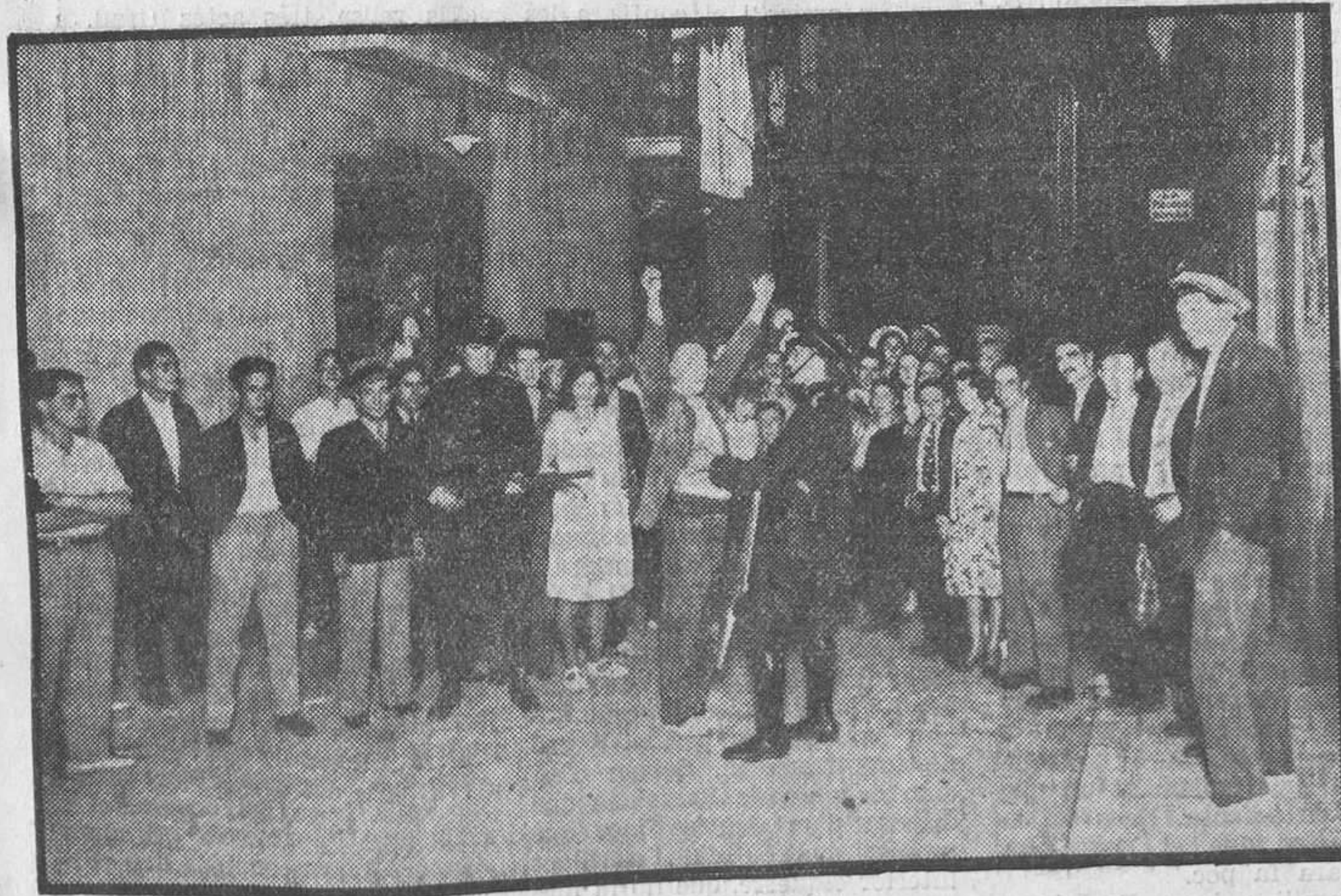
Un escorcoll en la nit...