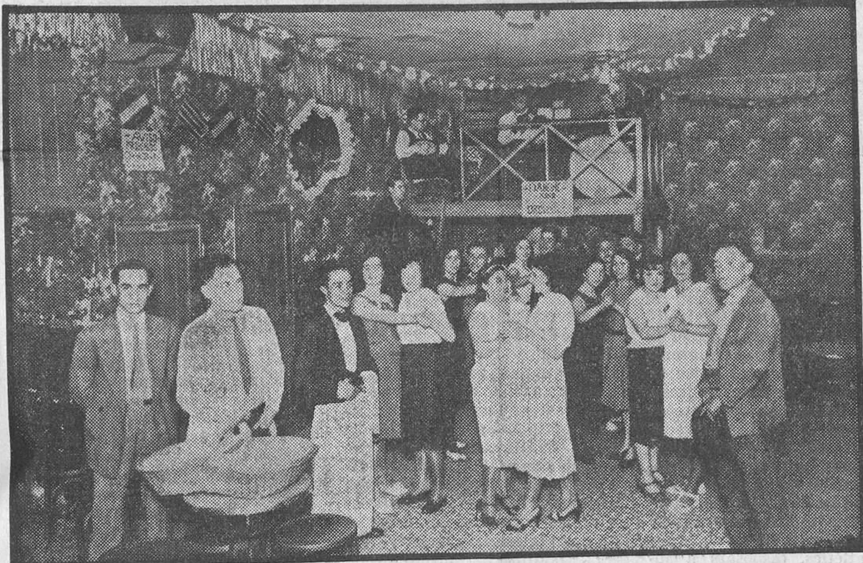
El dancing trist

De dia, la petita indústria gairebé no existeix. Passa desapercebuda. La porta resta tancada. El personal, descansa. Però tan bon punt el sol es pon, el negoci es desperta, per a ar-