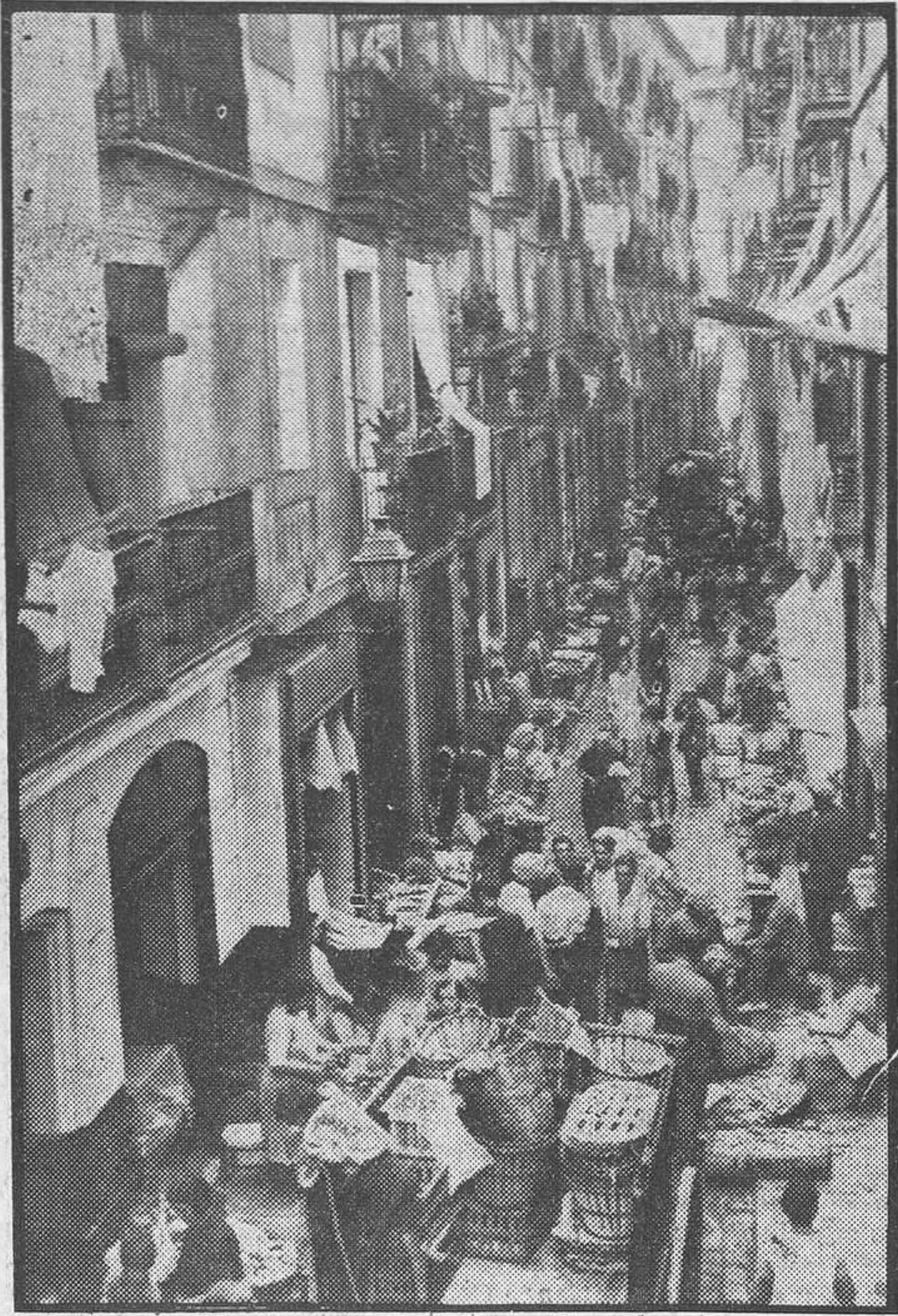
El carrer-mercat de l'Arc del Teatre

ribar a la seva màxima intensitat cap allà la matinada.