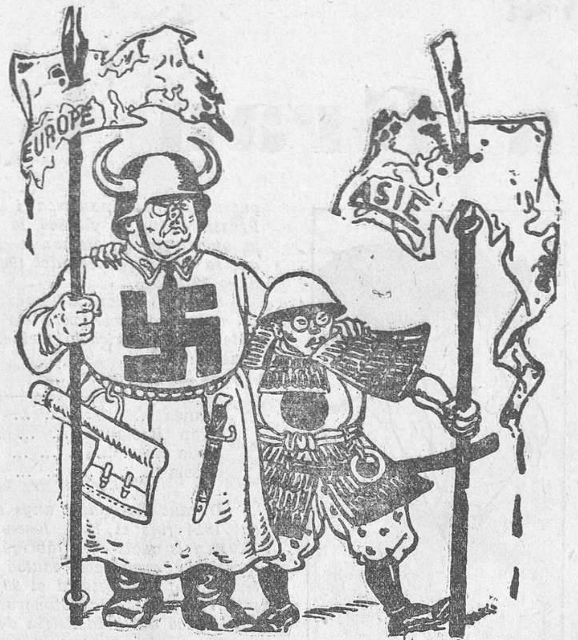
...I, mentrestant, Alemanya i el Japó es preparen per a tornar-hi...

Tot el que no sigui això és una mixtificació i els que creuen en un més enllà són els pri-