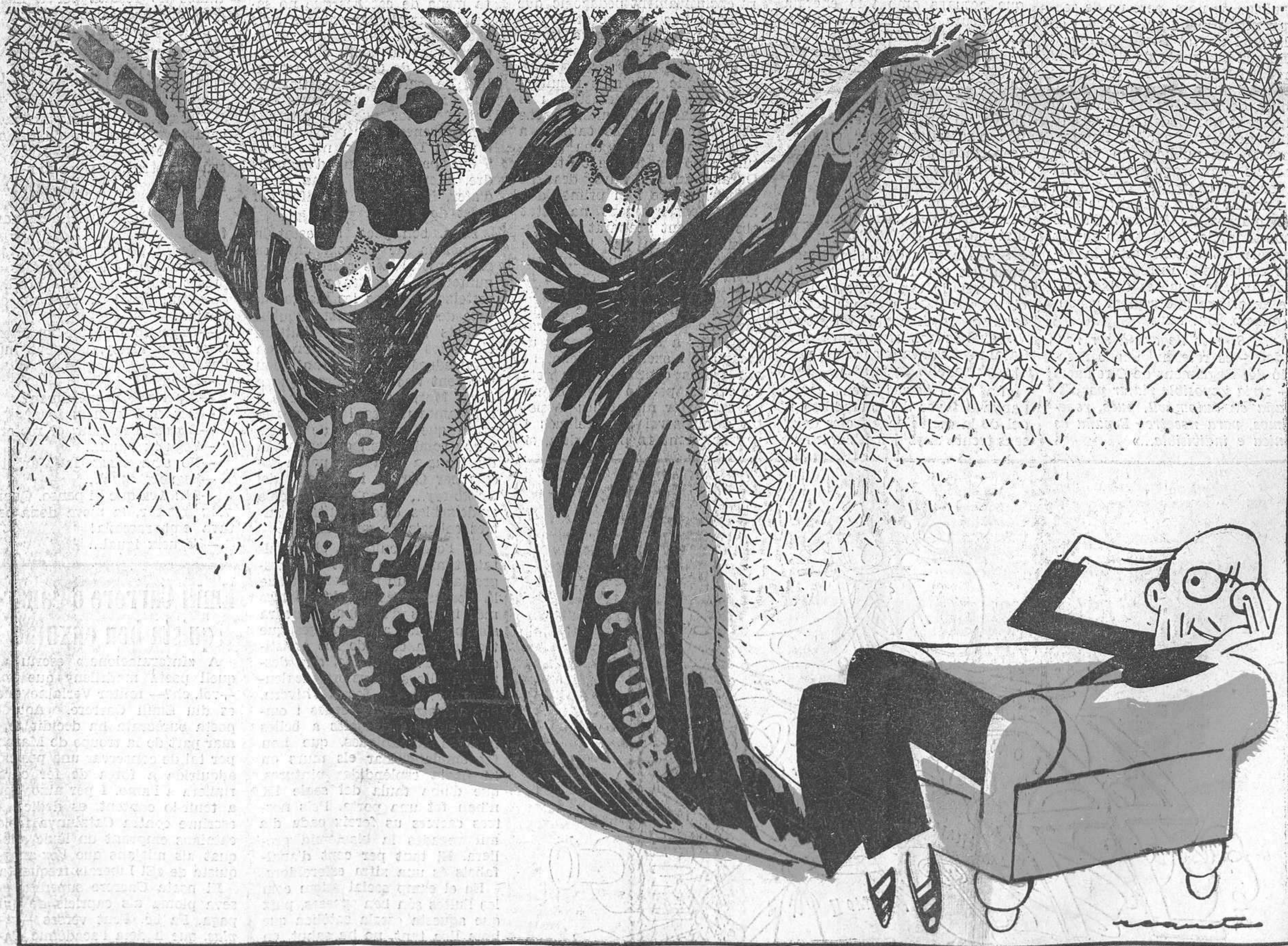
—Això no és viure! Quan un núvol se'm desfà, me'n surt un altre!

Cap membre del Tribunal monàrquic de Garanties no ha dimisit fins ara. Cap membre dels nuclis anterepublicans no ha renunciat al càrrec després del tristíssim paper fet per aquest deplorable organisme.