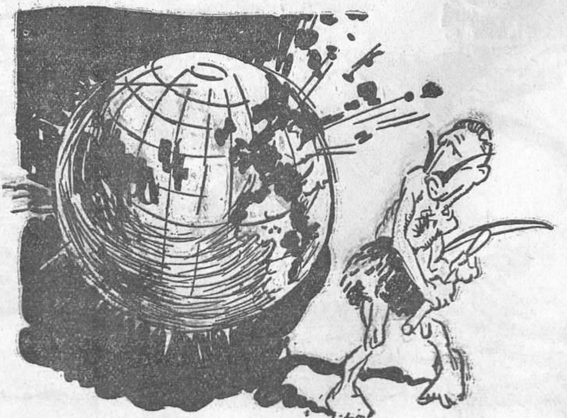
L'home que en vole fer el món a gust seu l'ompli de sang i de runes...