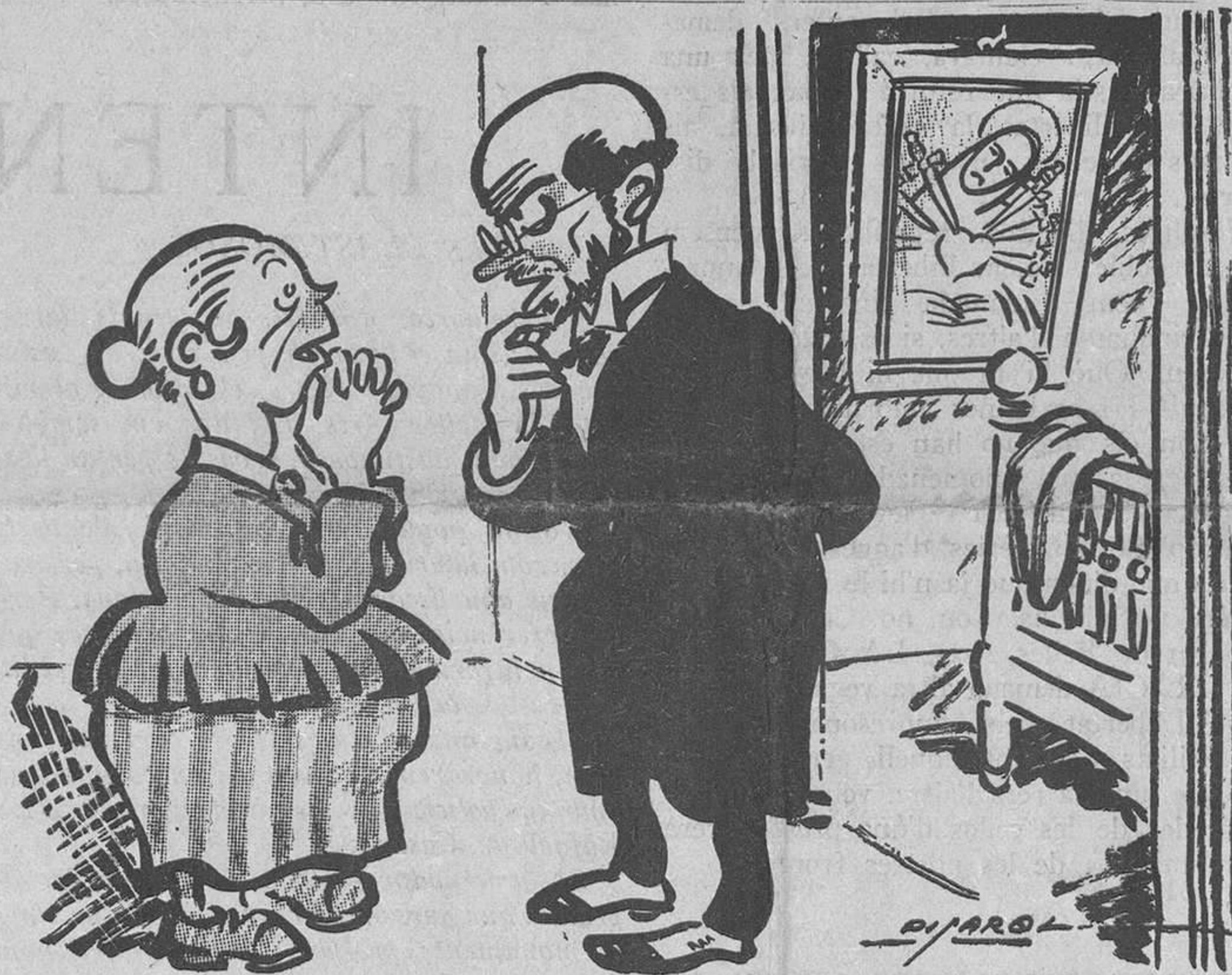
La malaltia de la pesseta

Només per a evitar que es perdin tants pares que no ho són de família, que si de