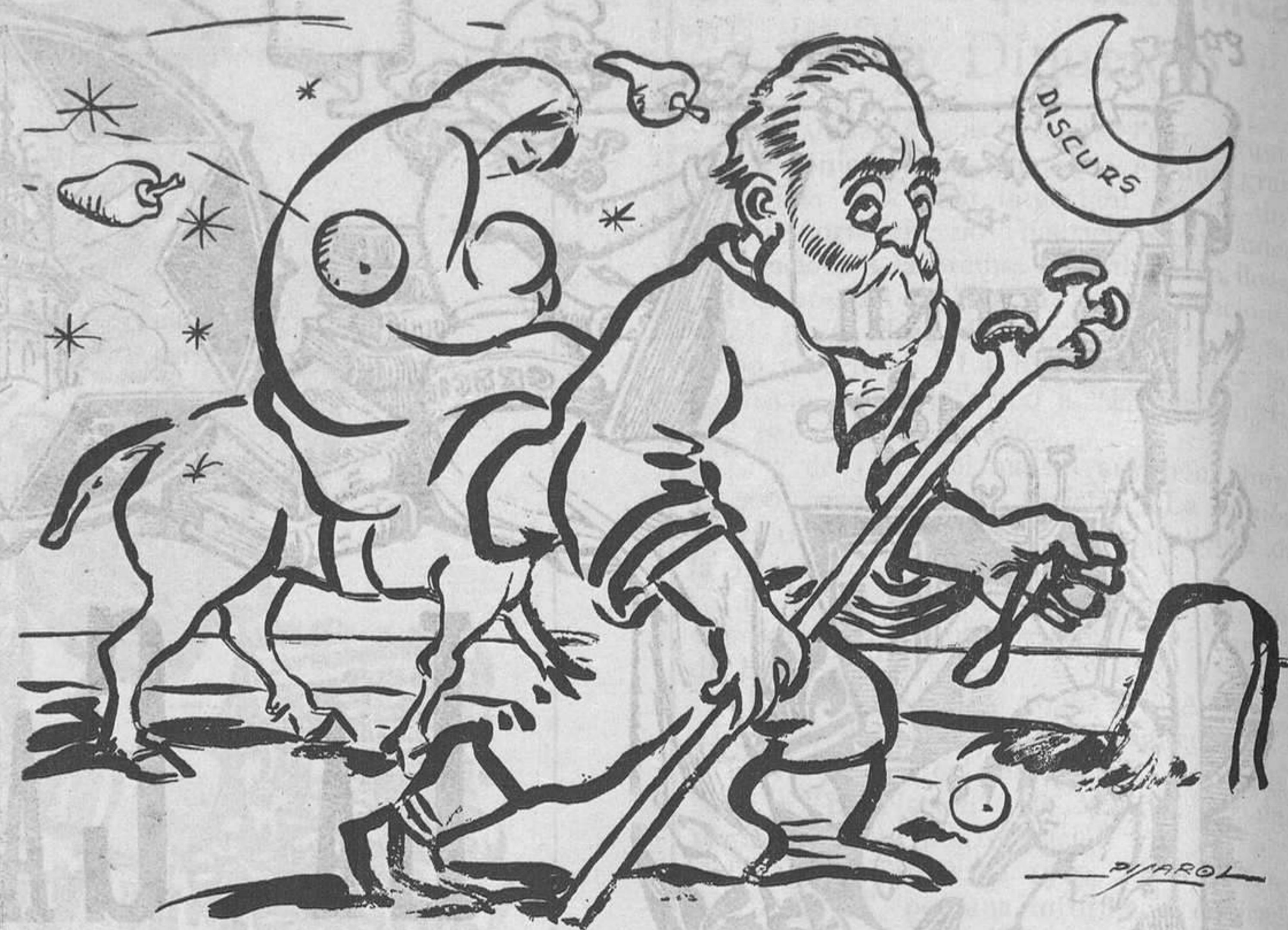
La fugida a Egipte

Volem política! Política! Política! Més política, i menys administració!!!