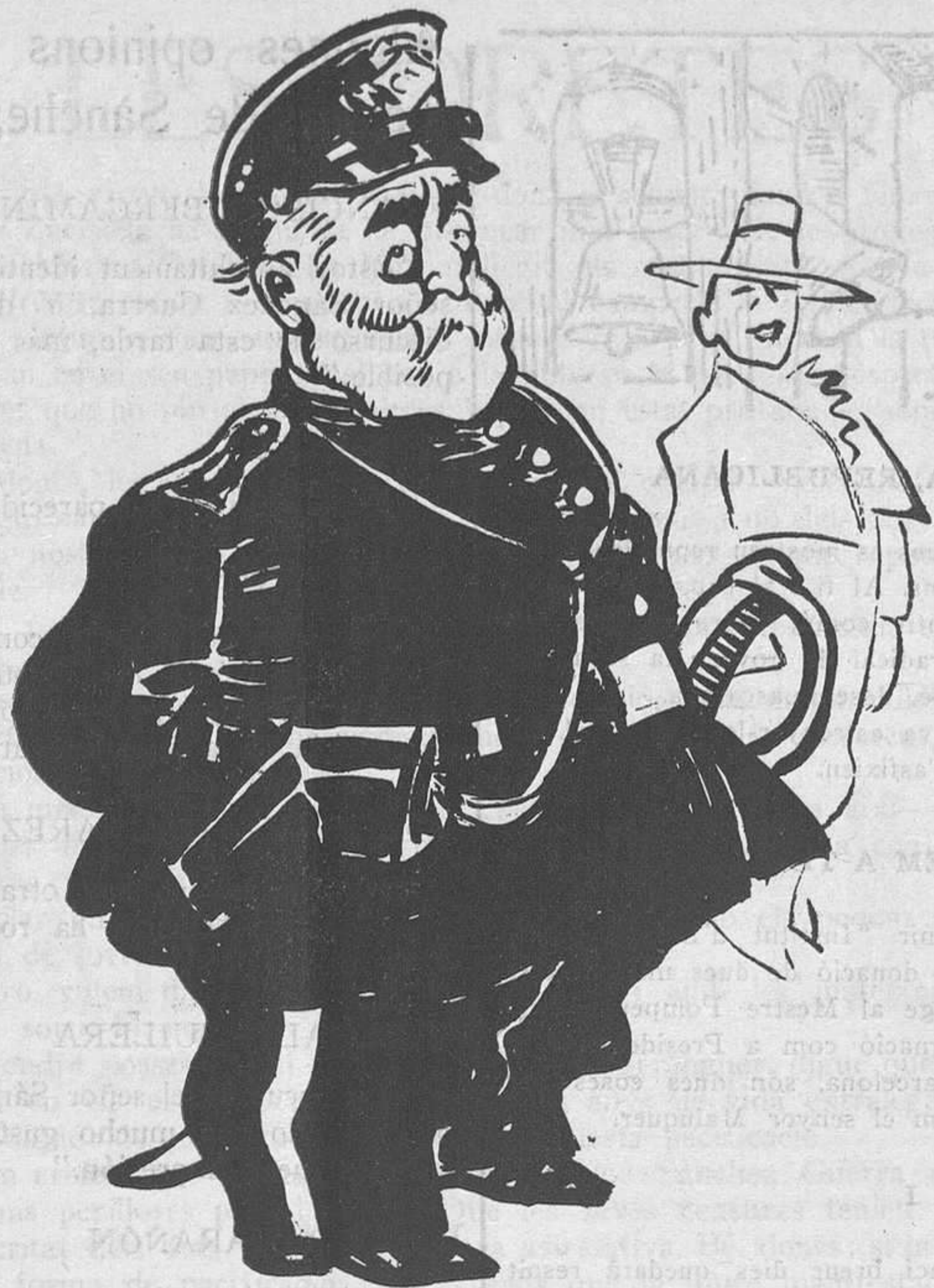
En Sánchez parla

Diciendo las veritats, se pierden las amistats!