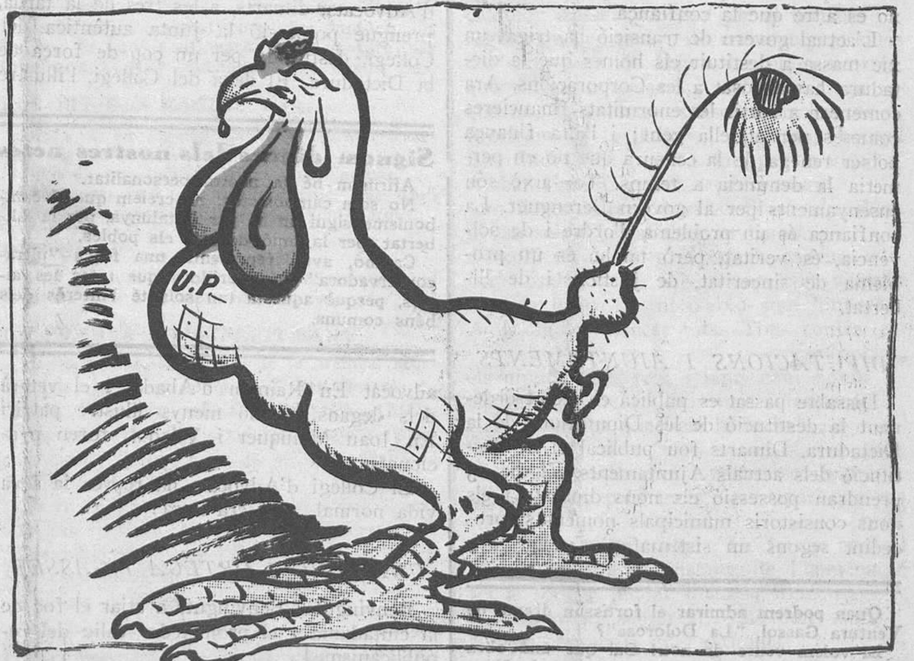
La U. P. a f. p.

No n'hi ha prou de dir que els altres eren uns lladres. Ara cal demostrar que s'ha estat honrat!