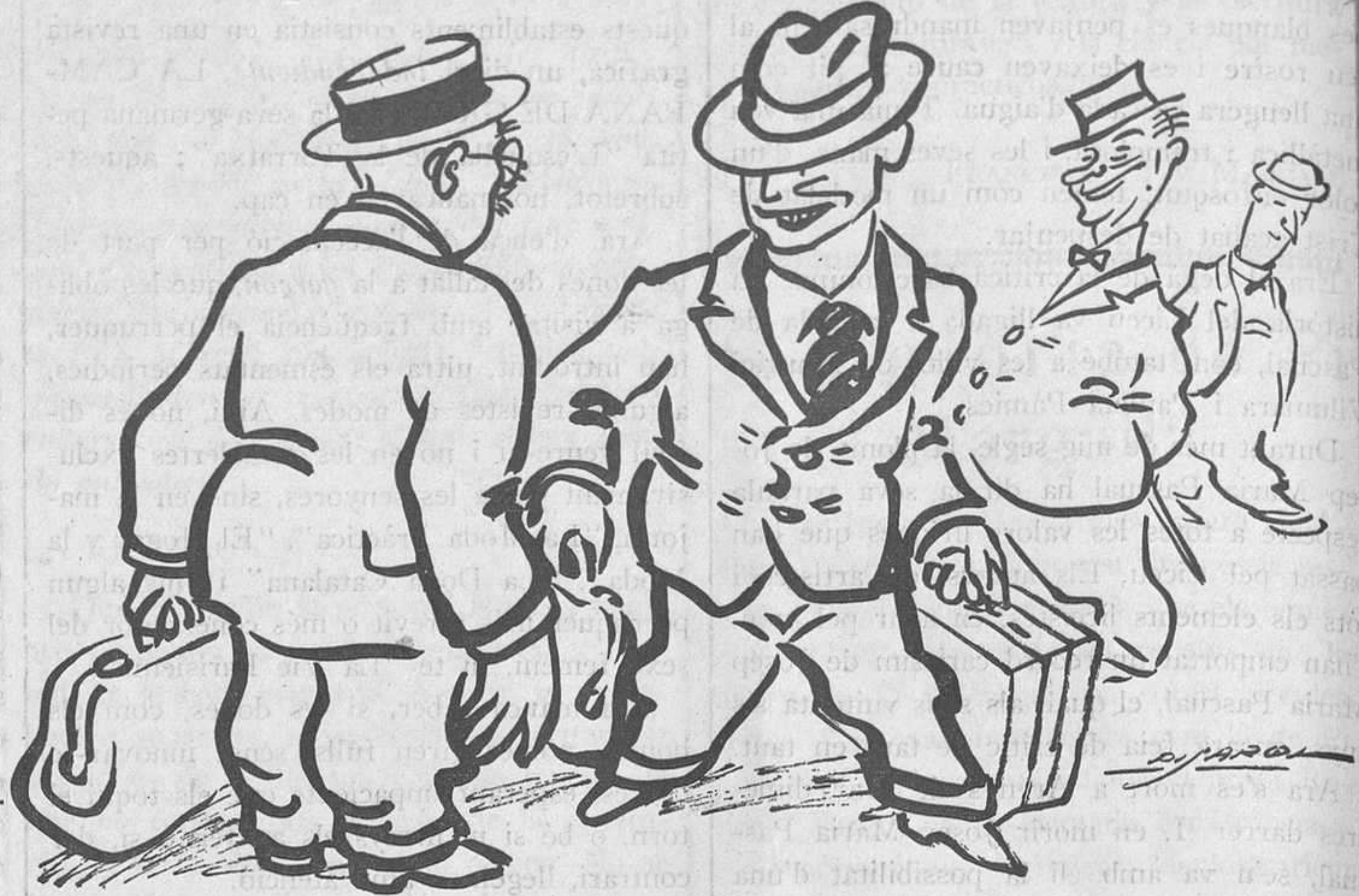
FUGINT DE LA CALOR

—Encara anem disfressats? —Sí, home! No diuen que tot l'any és Carnaval?