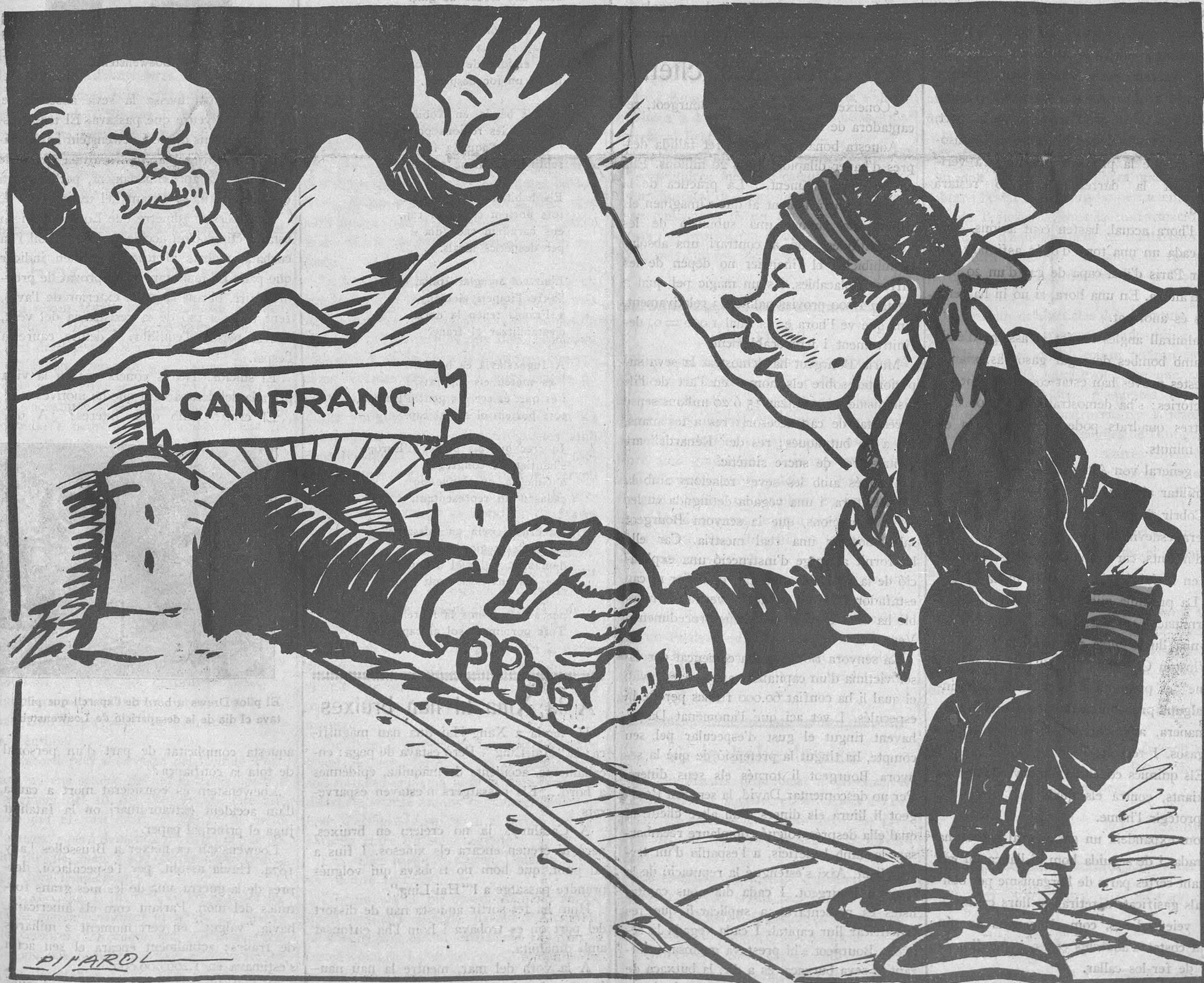
—Ara sí que podem dir que ja no hi ha Pireneus!