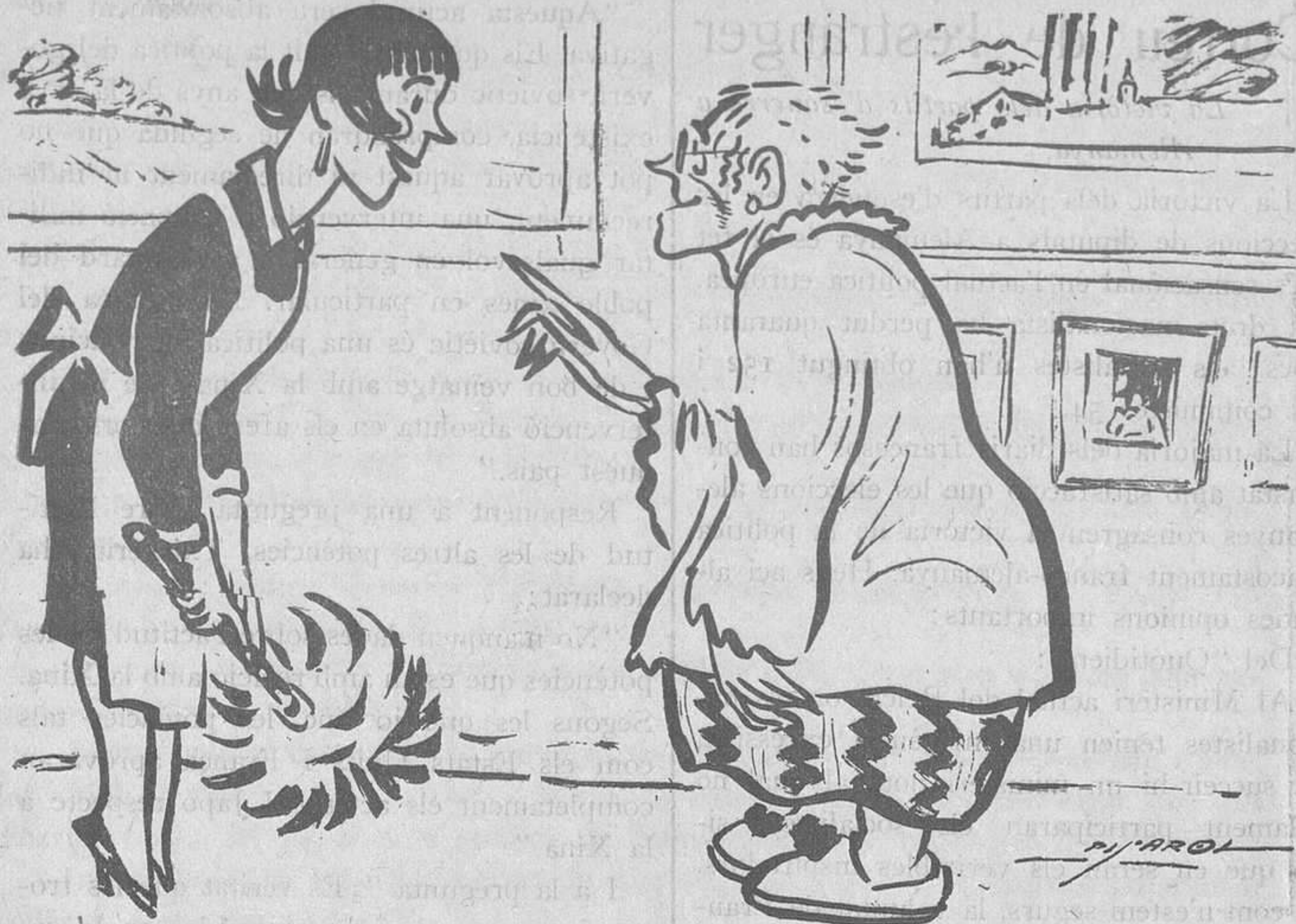
UNA DESGRACIA MAI VE SOLA

—I el seu promès què fa? En cara no es casa? —Hem d'esperar un any més, perquè s'ha gastat els diners anant al partit de Santander.