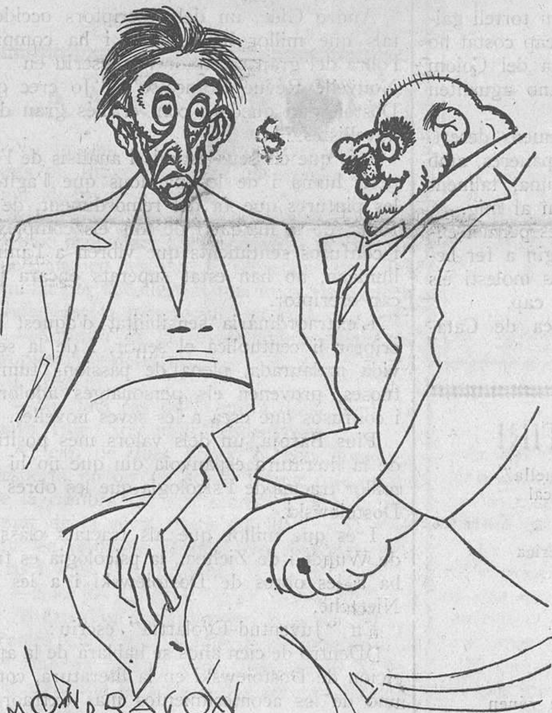
MONDRAGON QUINA SORT!

Fora de Barcelona cada trimestre: ESPANYA, pessetes 1'50. — ESTRANGER, 2'50