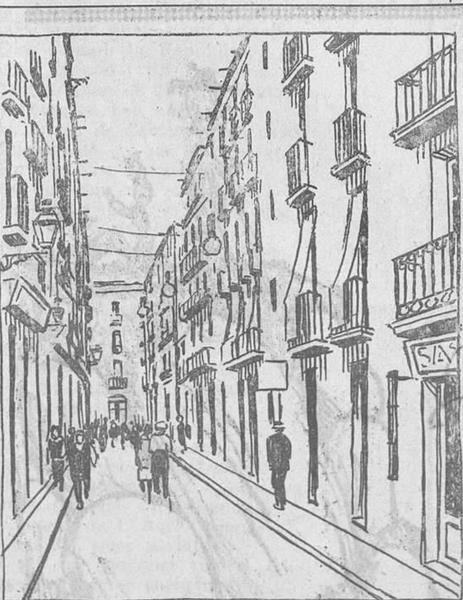
Als carrers estrets i foscos, on hi passa poca gent, són propicis els pisets per a "curanderos" i per a espiritistes importants.