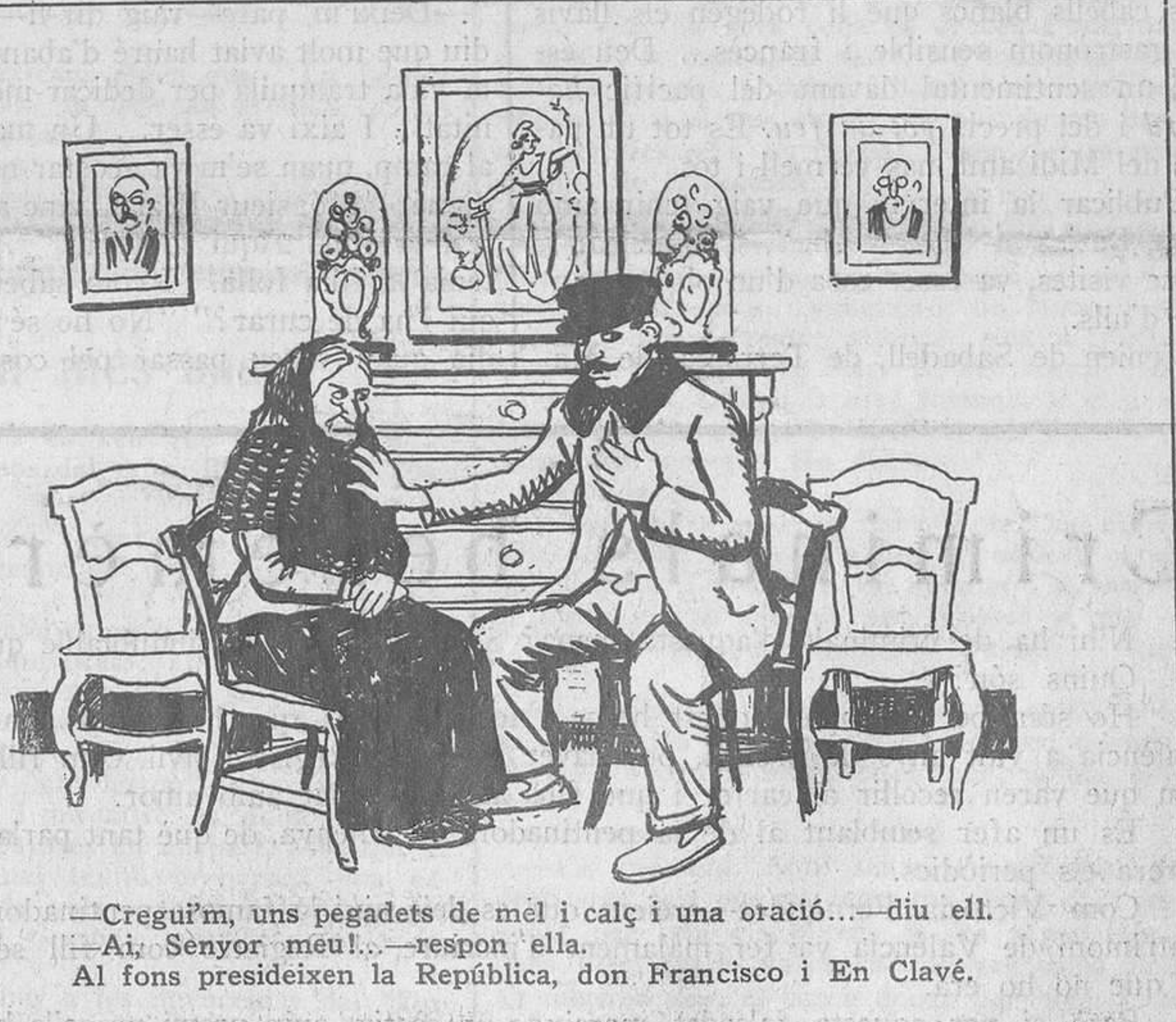
—Cregu'm, uns pegadets de mel i calç i una oració...—diu ell. —Ai, Senyor meu!...—respon ella. Al fons presideixen la República, don Francisco i En Clavé.