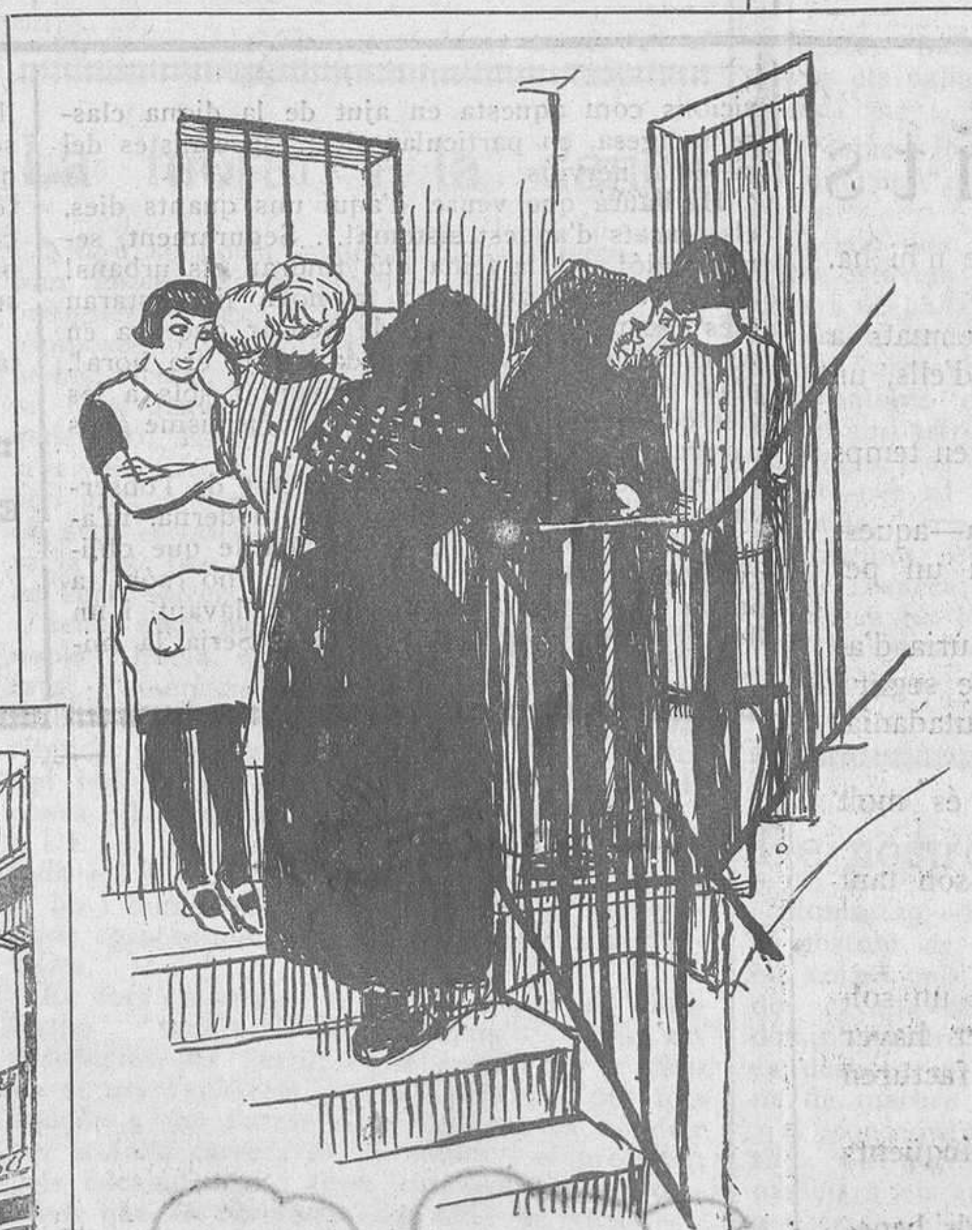
Cón unes velles que recorden les bruixes de les nits del dissabte... Parlen de malalties, i encara que van a missa, creuen en religions misterioses

"1902", d'En Ramon Casas; a l'altra, l'Angelus, d'En J. F. Millet; a sota del "1902", un calendari, i al damunt una escena de La favorita, grafiada damunt llauana; a sota de l'Angelus, una litografia de la República espanyola, tenint a les mans unes taules de la llei i uns caps de polítics republicans al voltant. La República semblava una mainadera. Dalt de l'Angelus, una escena