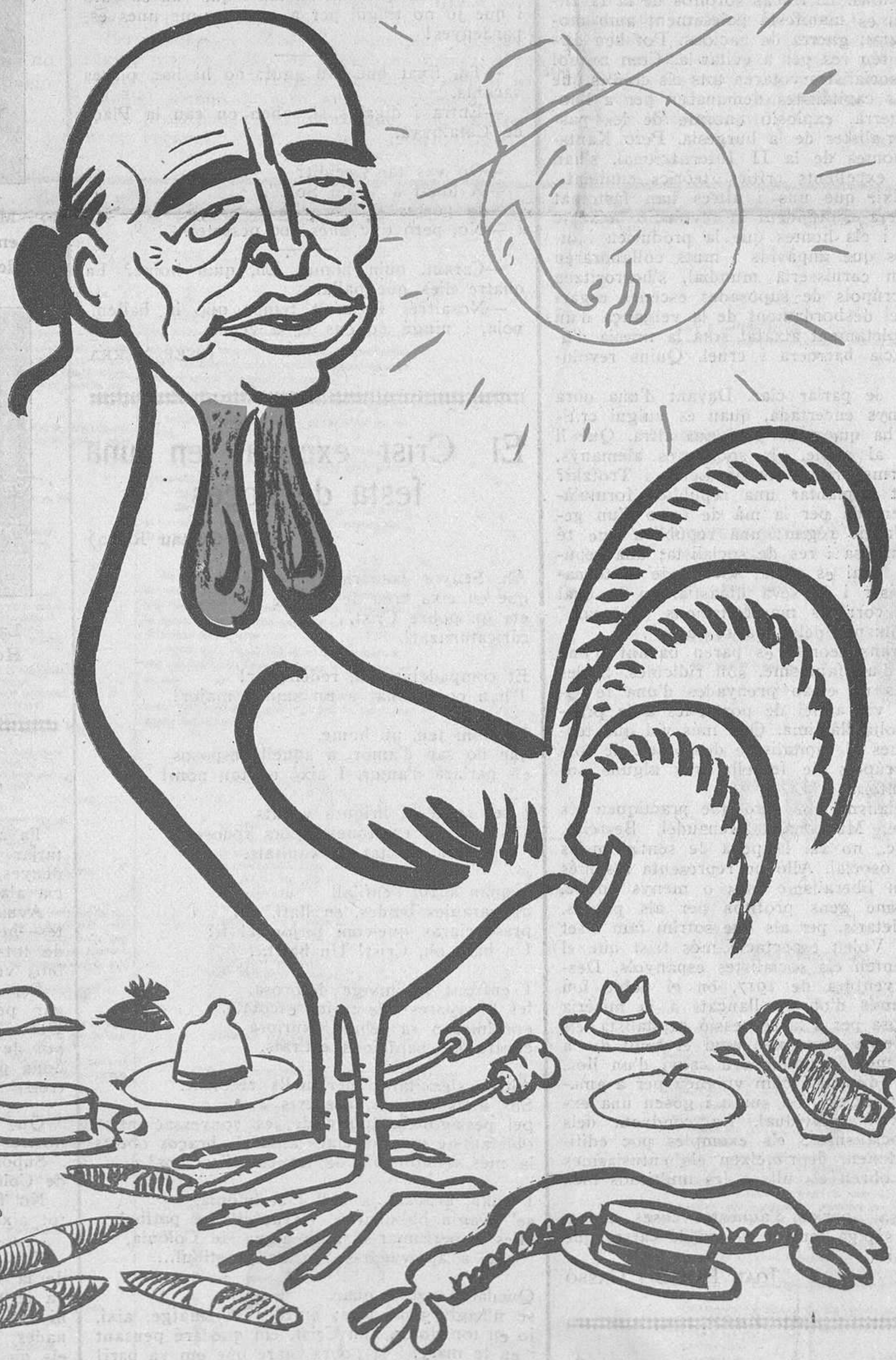
L'EXIT DE LA SETMANA

PREUS DE SUBSCRIPCIÓ Fora de Barcelona cada trimestre: ESPANYA, pessetes 1'50. — ESTRANGER, 2'50