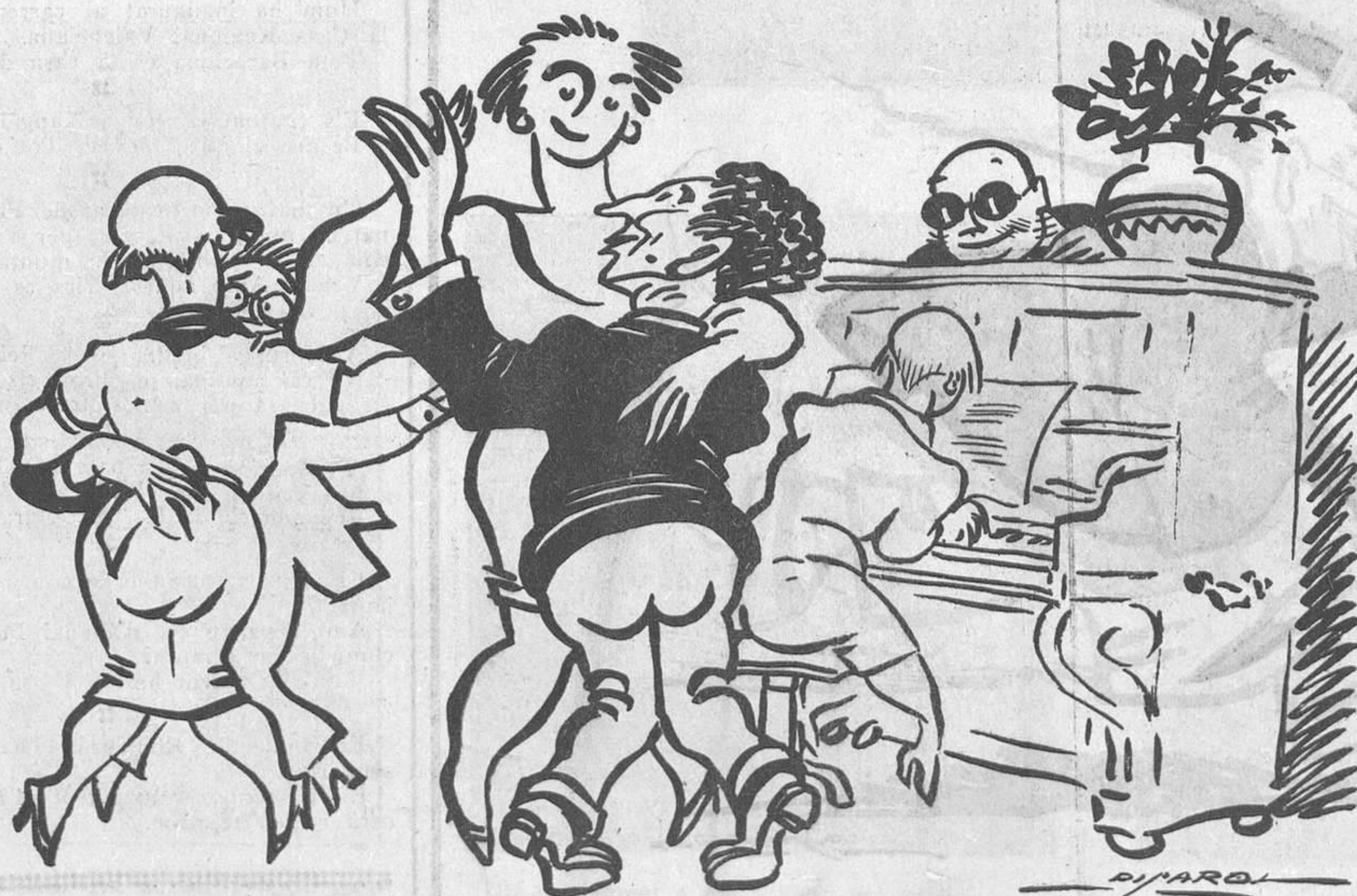
EL SENYOR ESTEVE I EL "CHARLESTON"

—Quan l'amo i el gos no són a l'hort—respon el murri.