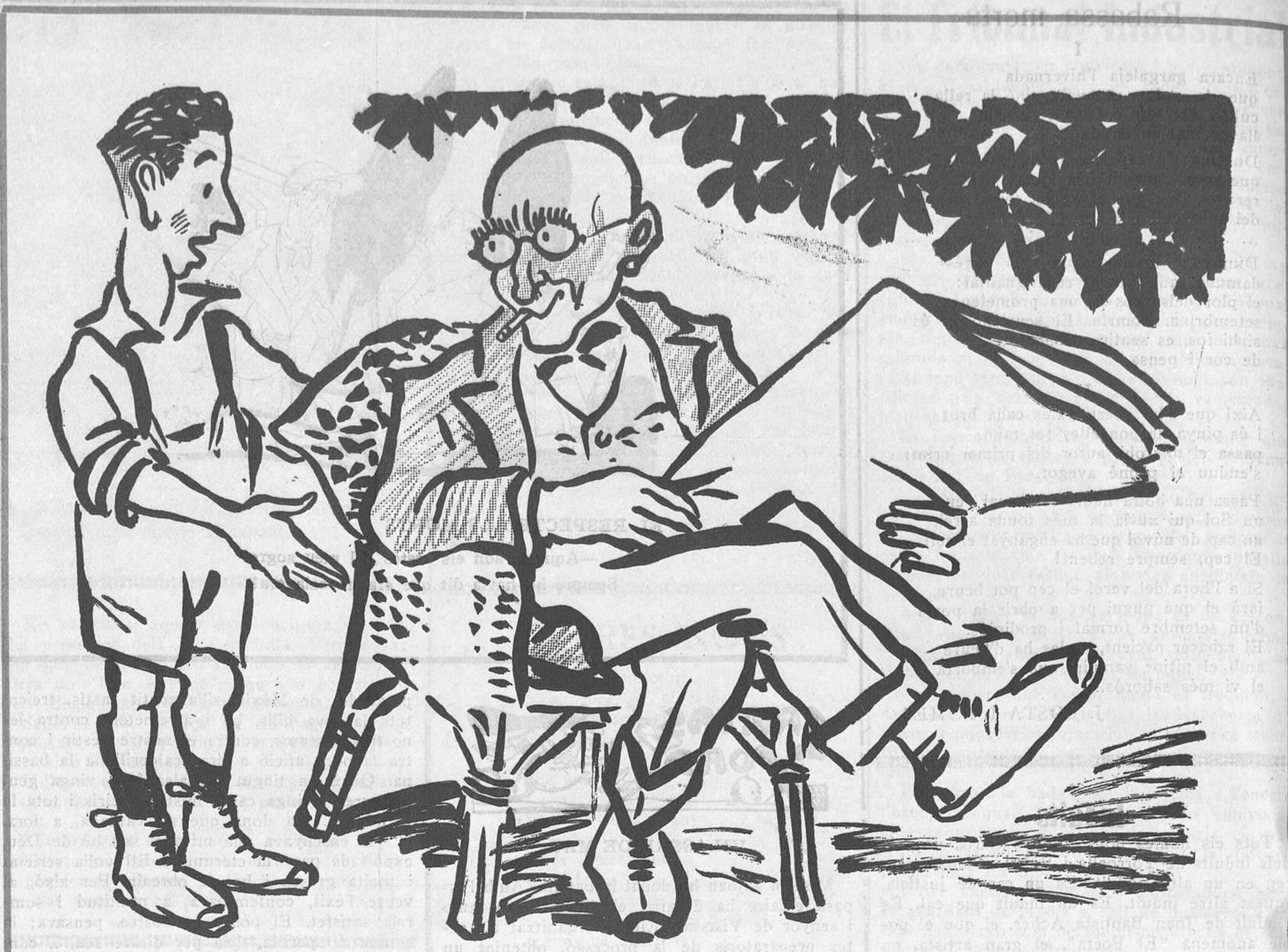
LLEGINT LA PREMSA

Un anglès se'n va anar a la tomba del soldat inconegut, es va beure una ampolla de xampany i després va trencar l'ampolla. Trobem que va fer molt bé. A les penes, traquets de vi.