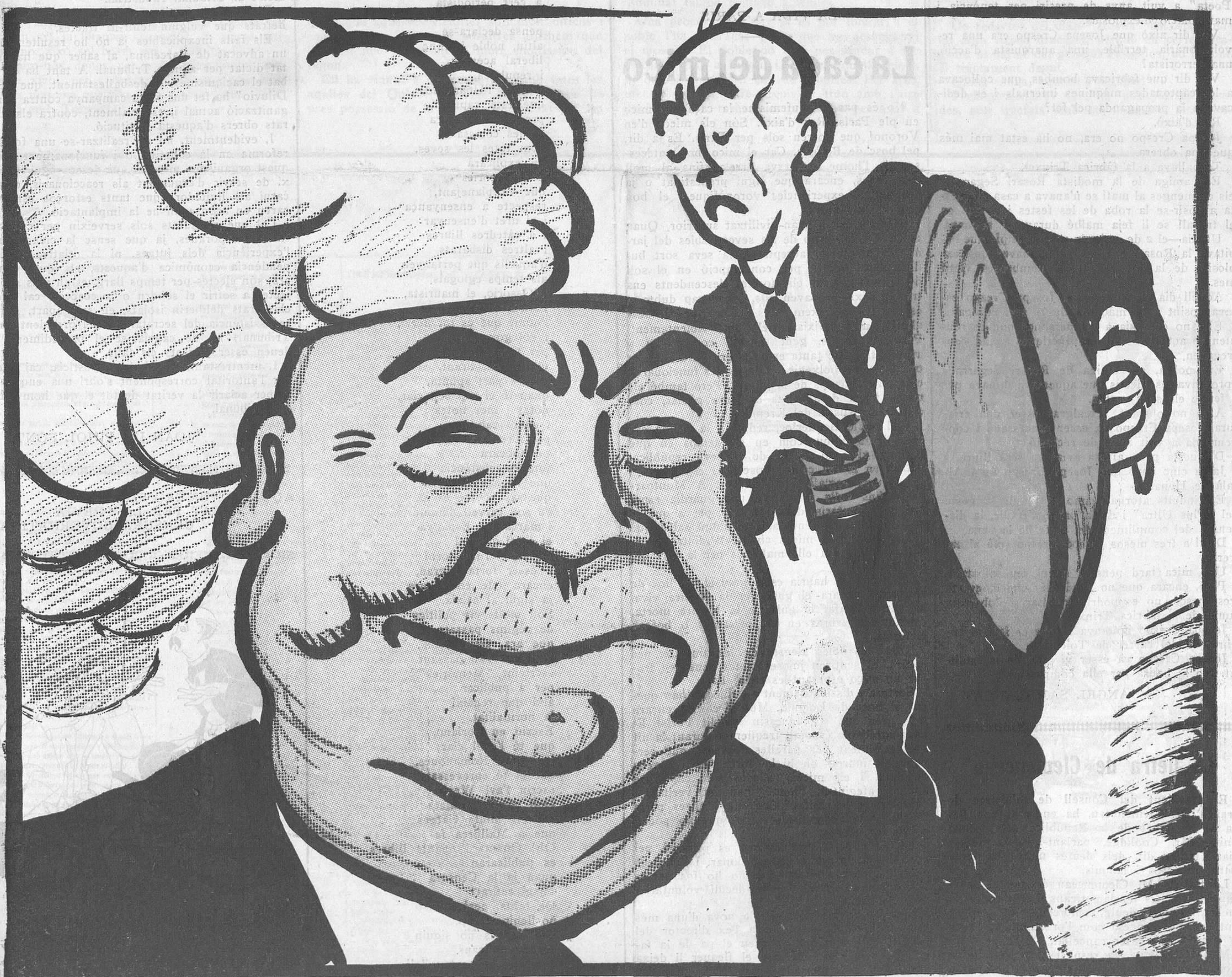
—Amb aquesta calor els caps estan que bullen!