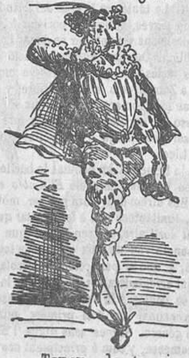
Tenor de gracia