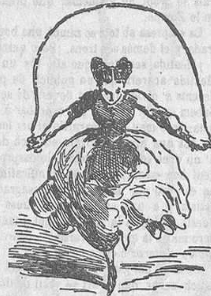
Una fíle de agilidad.

COMPANIA QUE OFRECE EL TIBURON à las empresas teatrales de Europa.