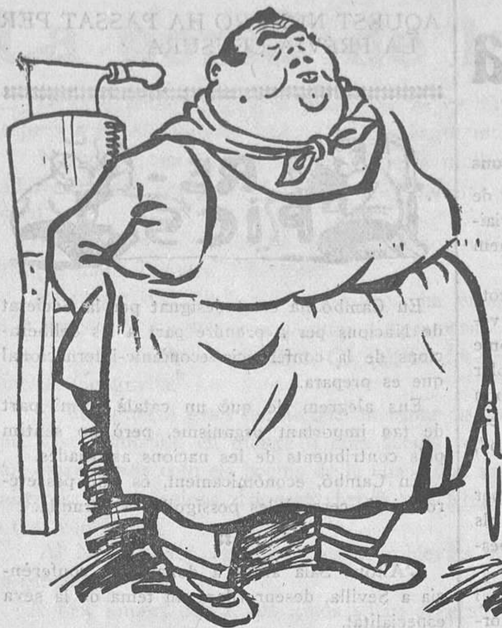
LA SANTA COSTUM