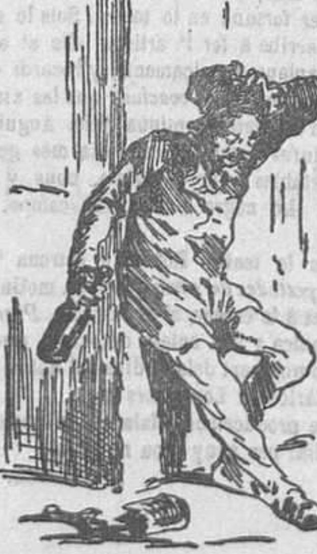
Caricato de gran chispa.