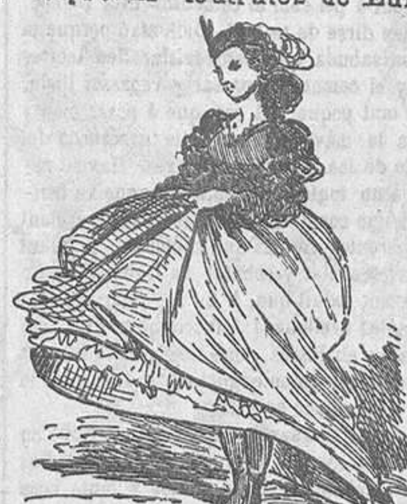
Contralto de buenos bajos