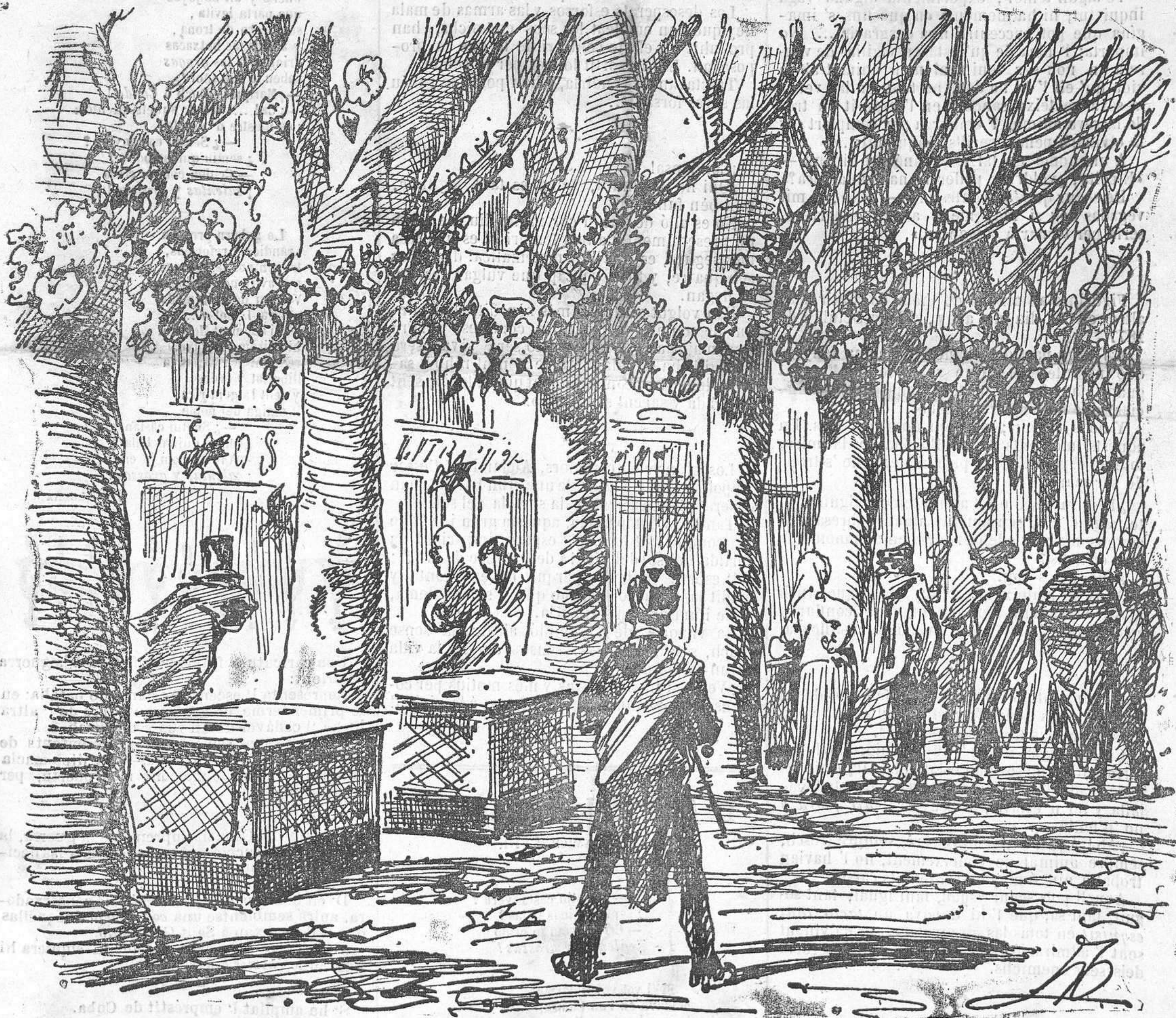
A pesar dels primers frets, aquest any los arbres de la Rambla han seguit carregats de flors.