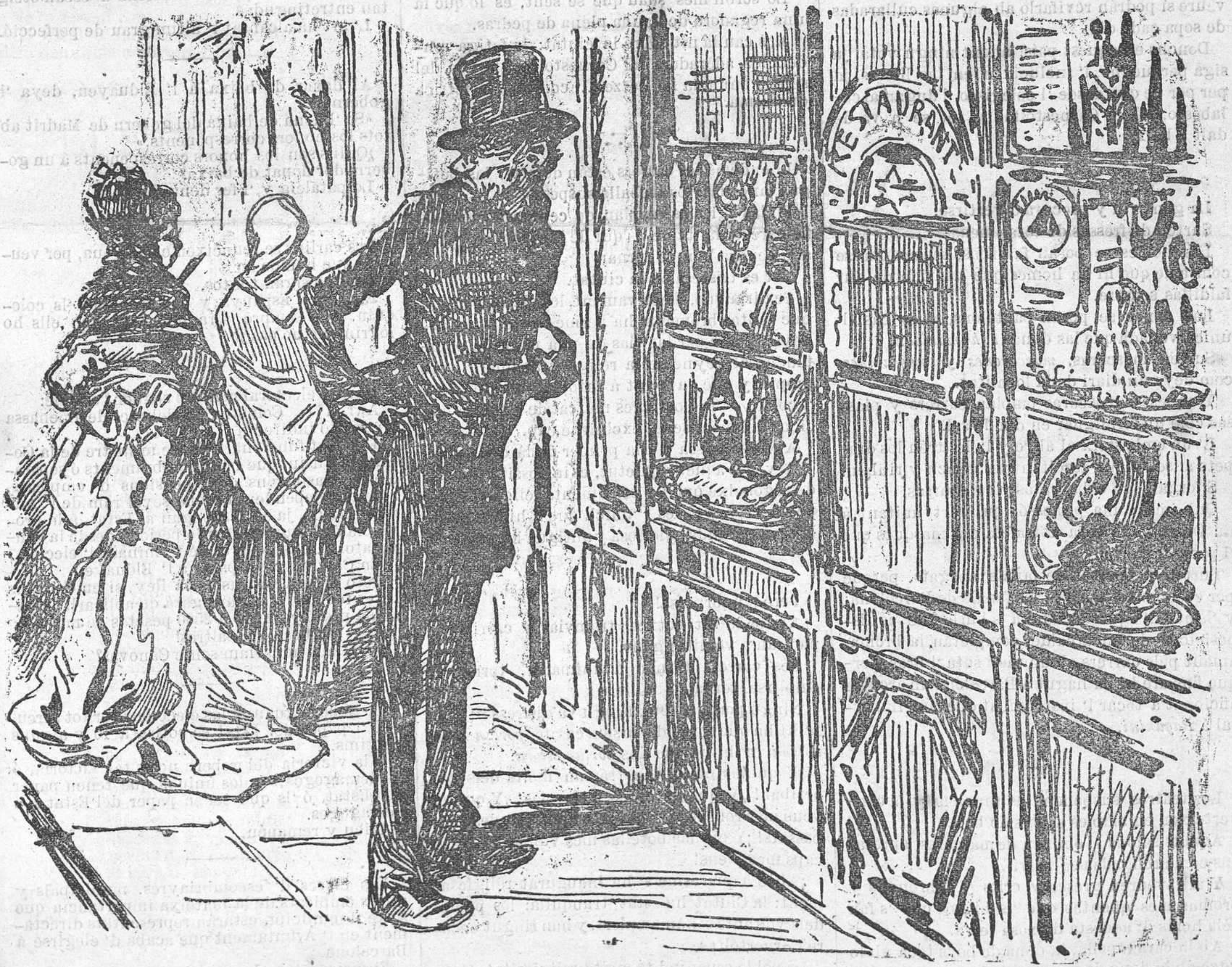
Dejuni ab abstinencia de carn.