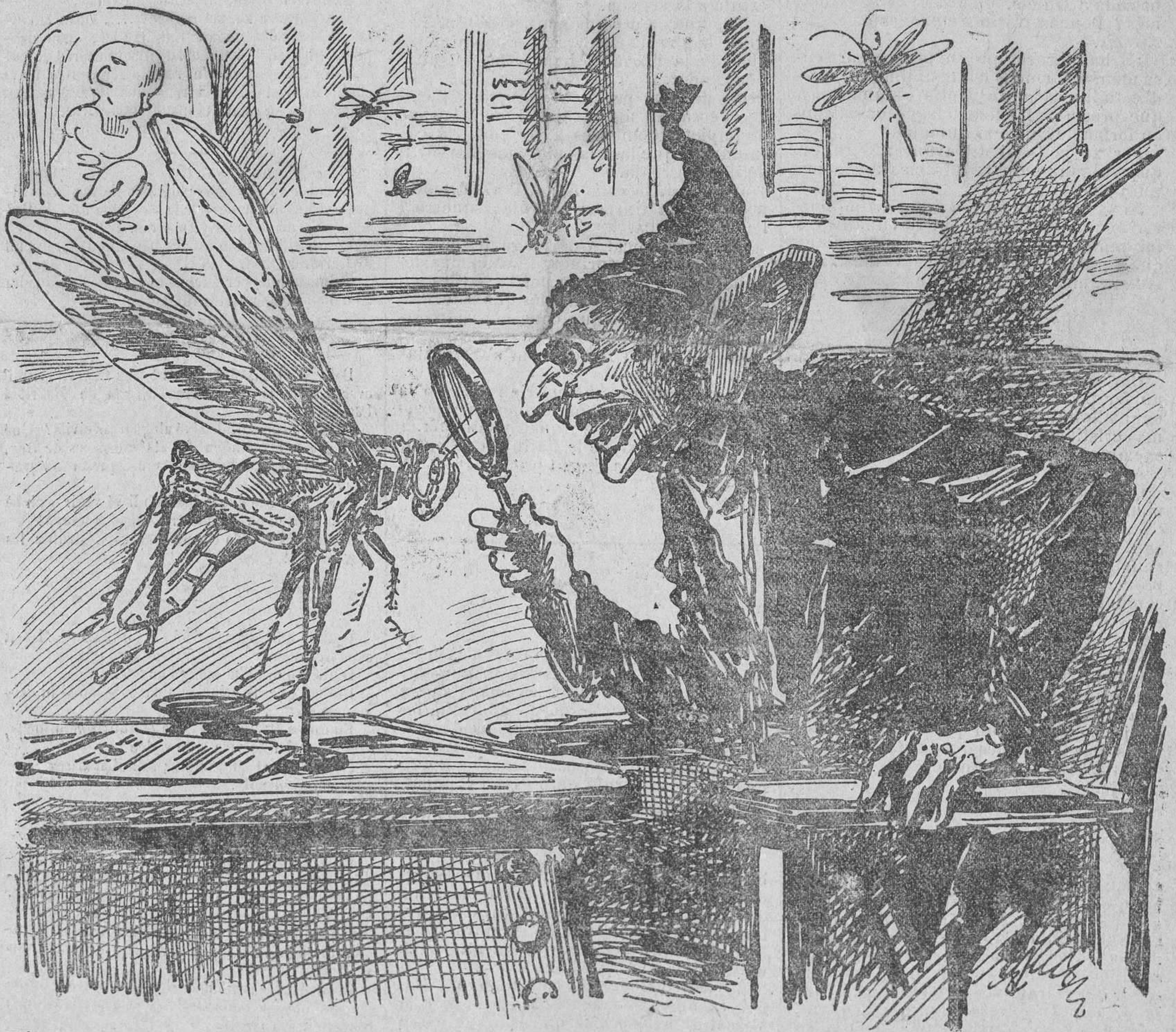
Diu l' articulista de cert DIARI que la Providencia 'ns envia la llagosta.—Vamos home, no siga PLAGA.