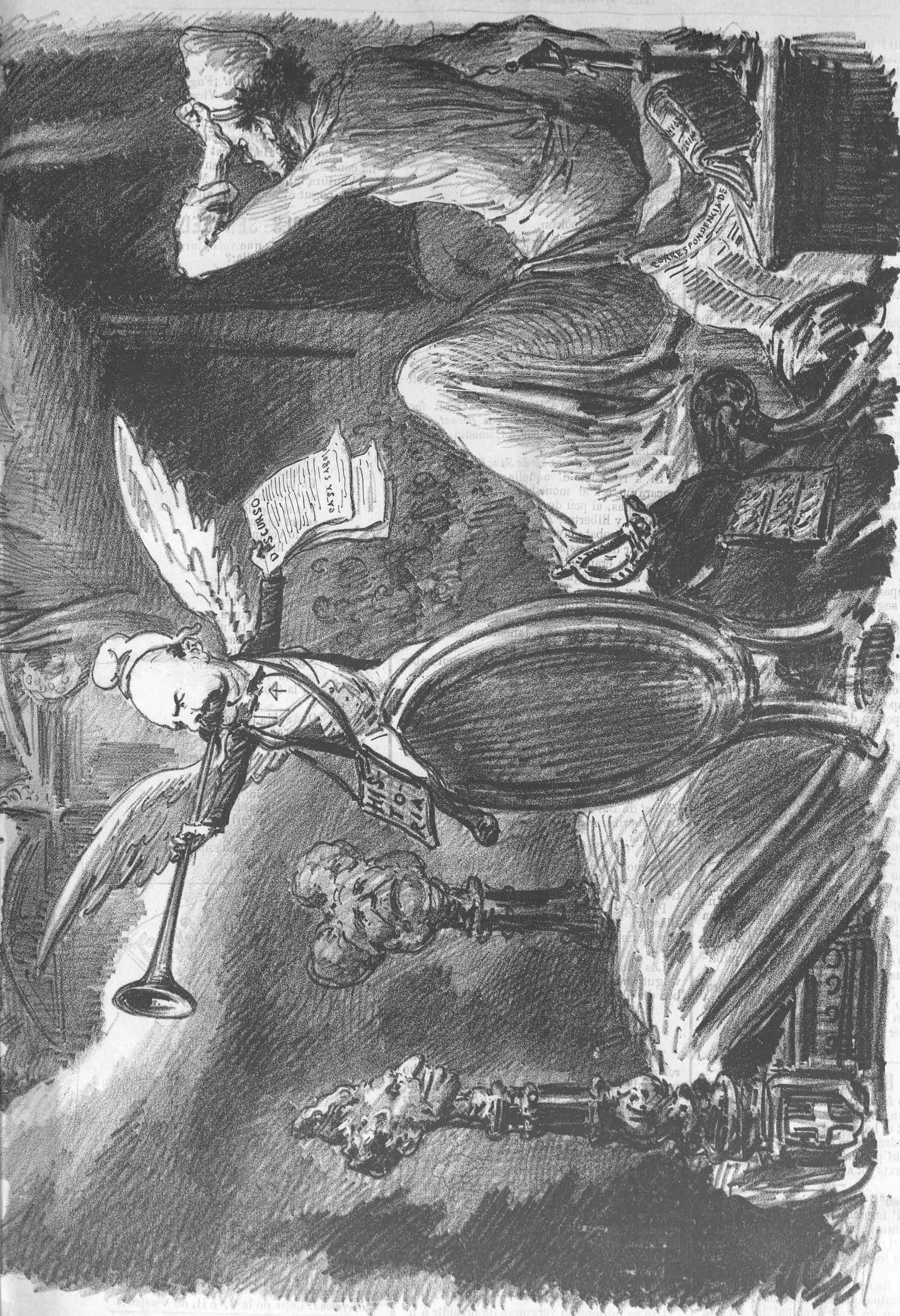
UN SOMNI REAL.