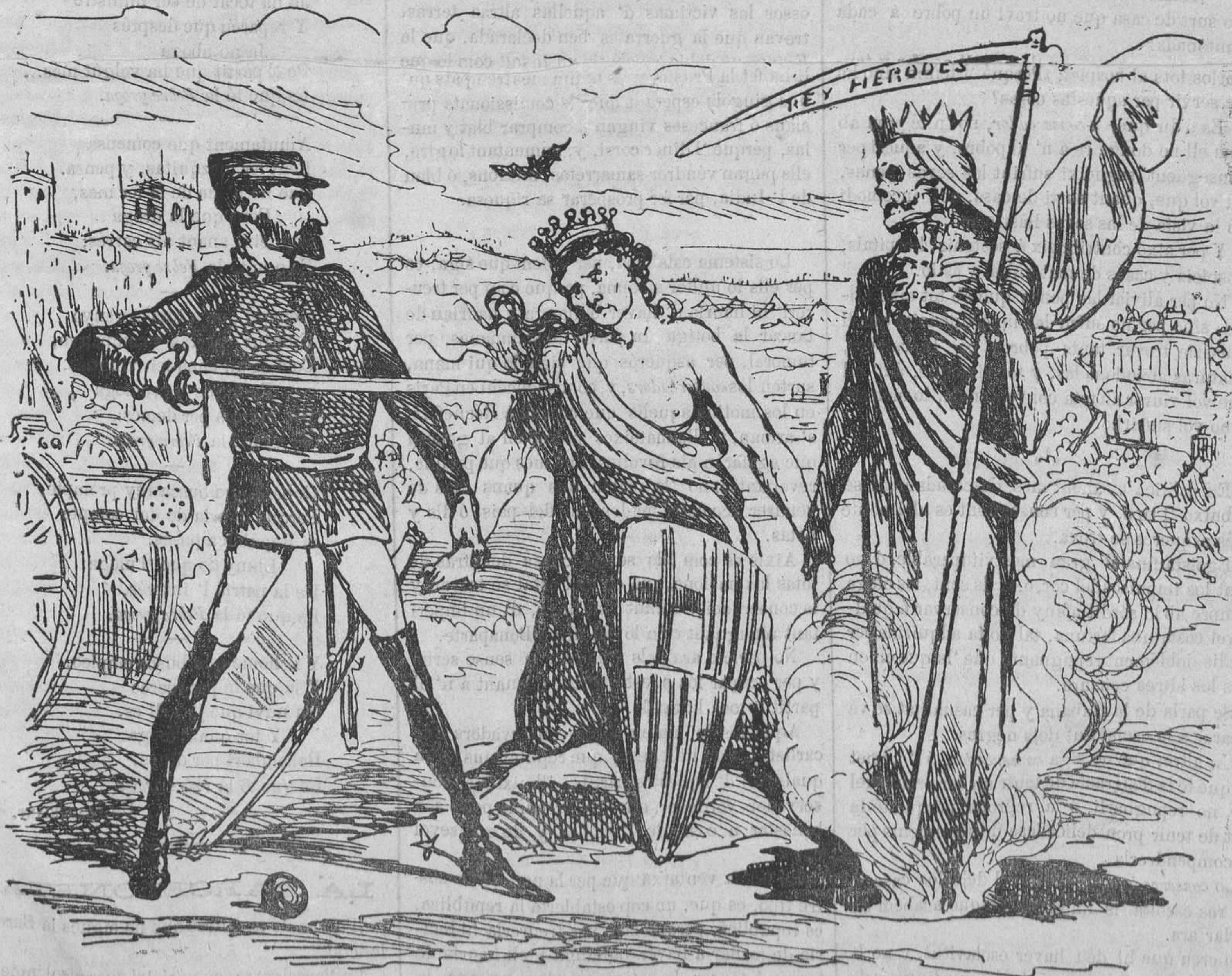
Entre la espasa y la febre groga.