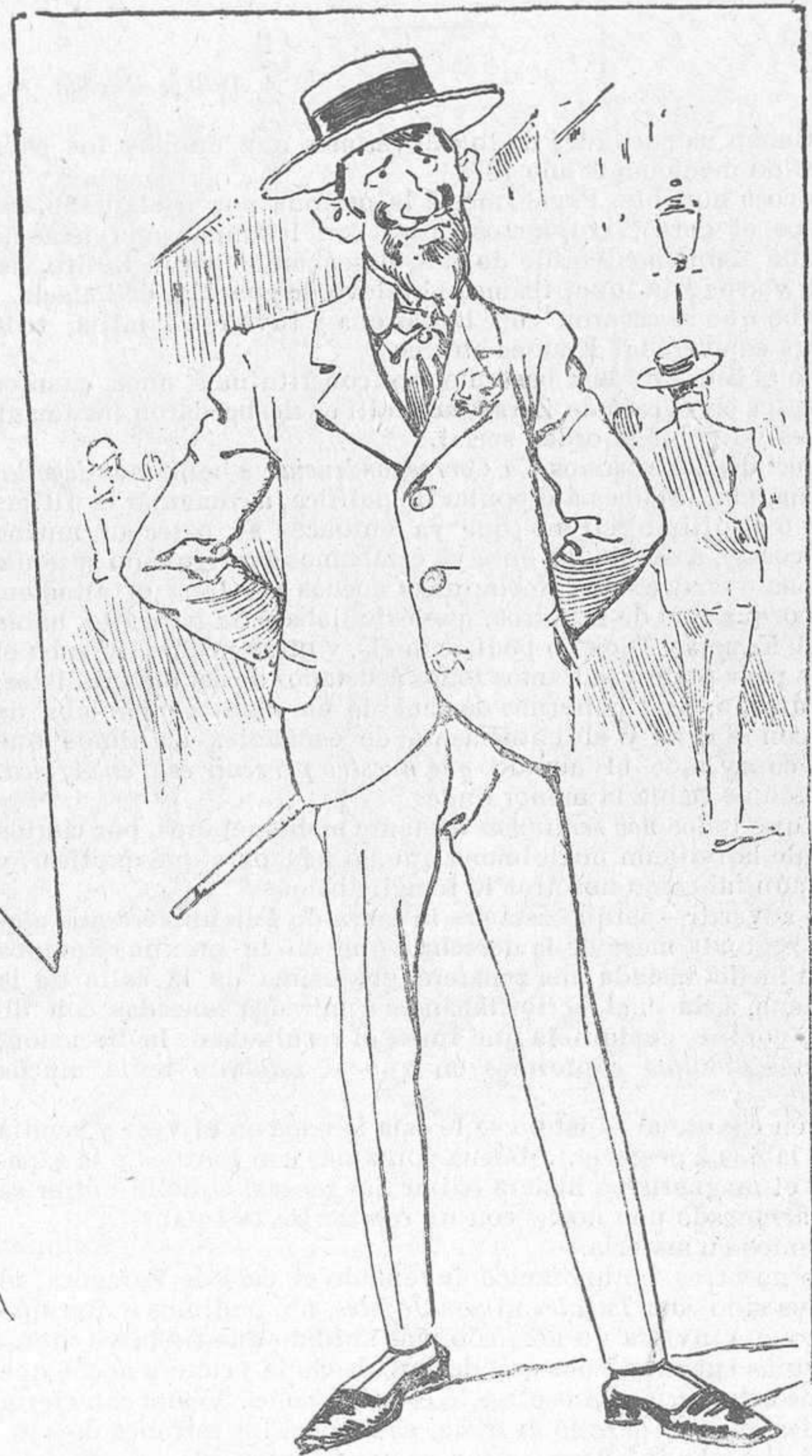
—El porvenir incierto, porque las mujeres ricas han dado en la flor de no hacer caso de los buenos mozos.