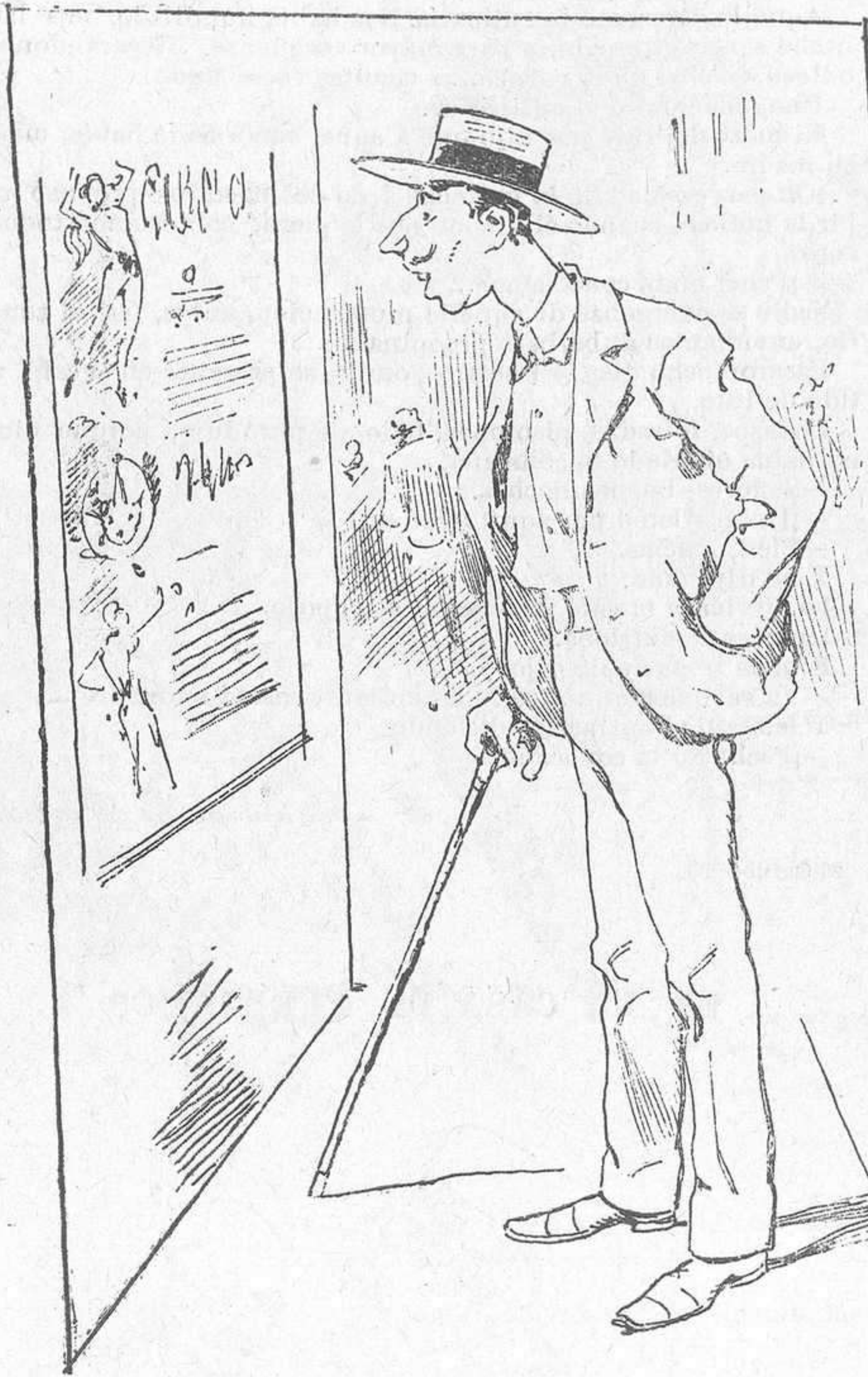
—El cartel anunciando los ejercicios de las nadadoras. ¡Ay! así debían ser todos los carteles: amenos é instructivos.