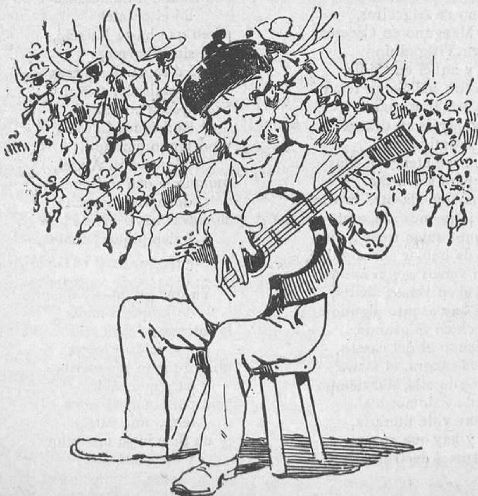
¿Que detrás de unos vienen otros y amenazan abrasarnos á picaduras?... ¡Bueno!