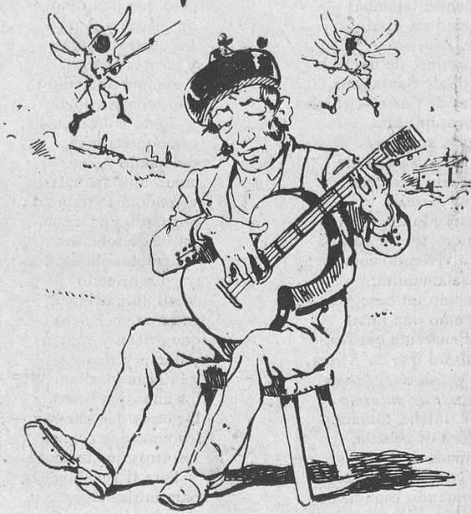
¿Que empiezan á zumbar por encima unos insectos?... ¡Como si no!