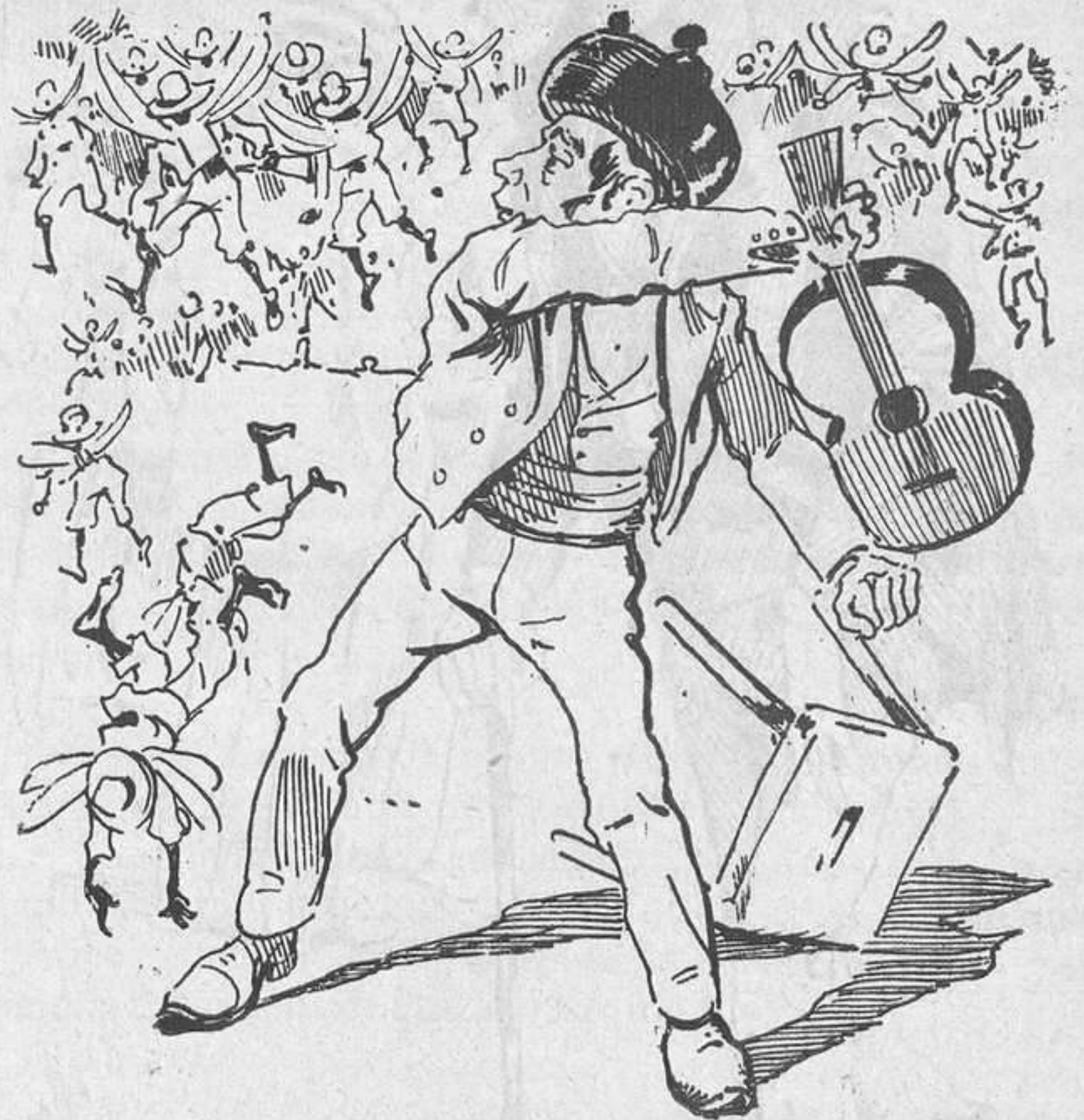
Todo se reduce á cambiar de mano la guitarra y dar unos boleos..