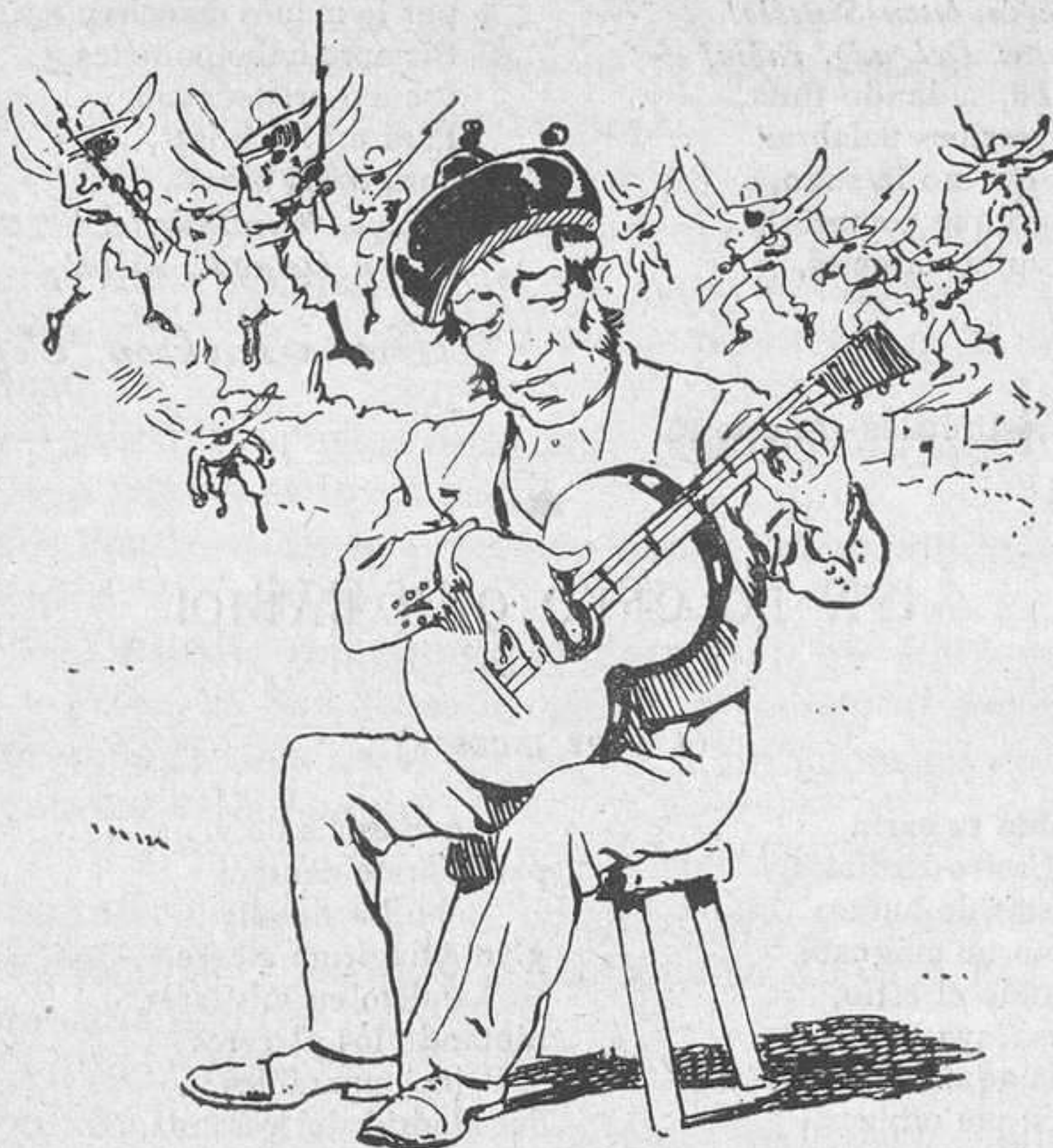
¿Que en vista de la impunidad va aumentando el número?... ¡Bien!