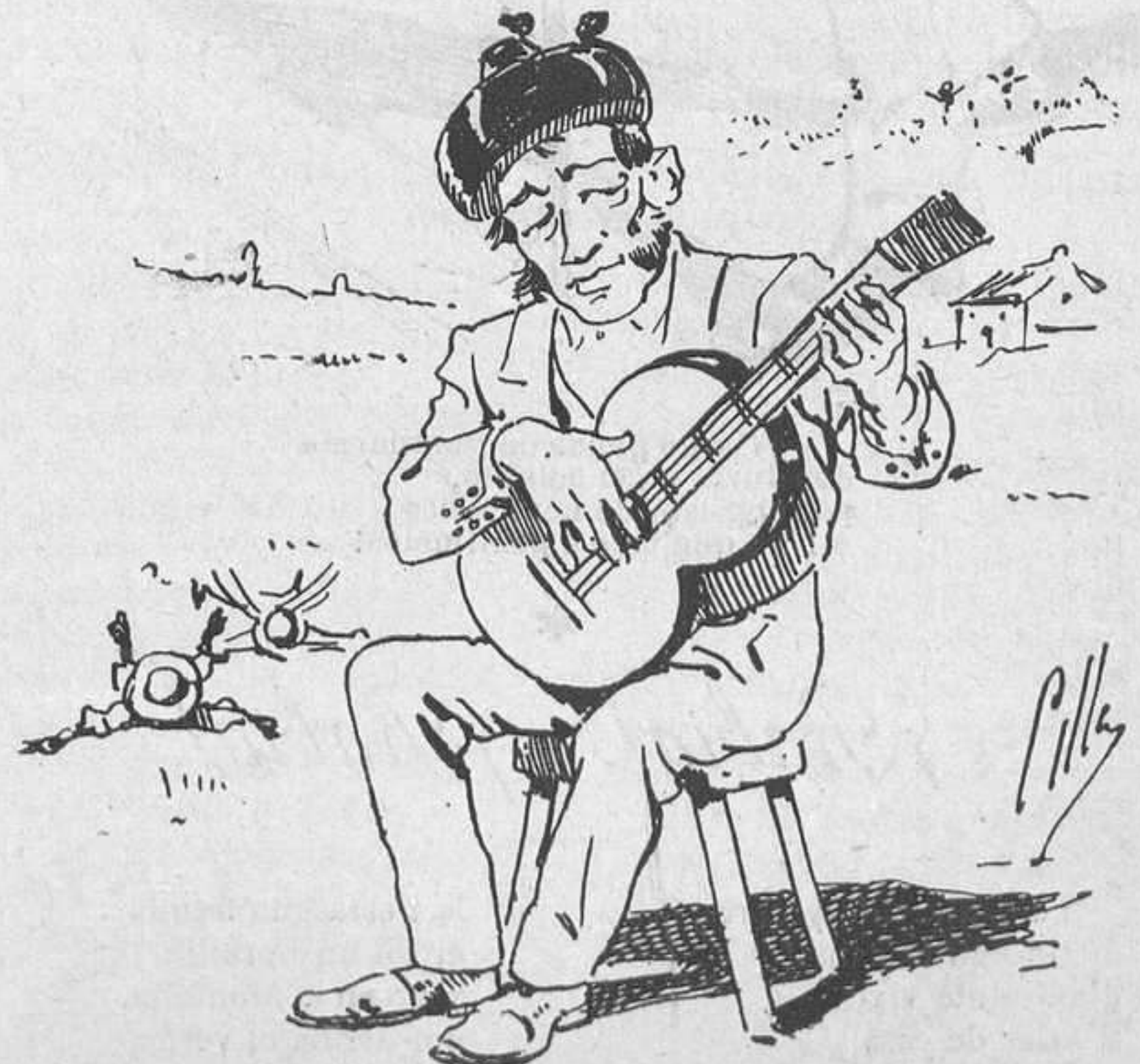
Y hasta otra.