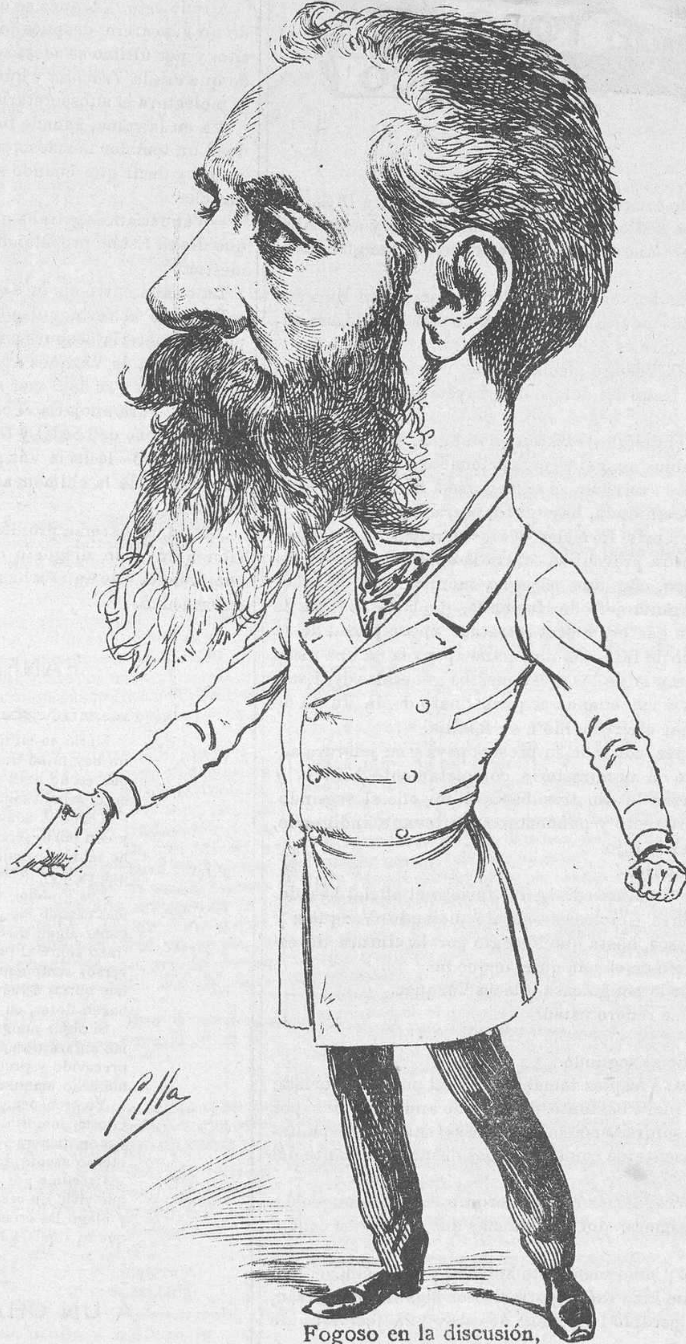
Fogoso en la discusión, siempre ha tenido Pidal oratoria de cañón y pulmones de metal.