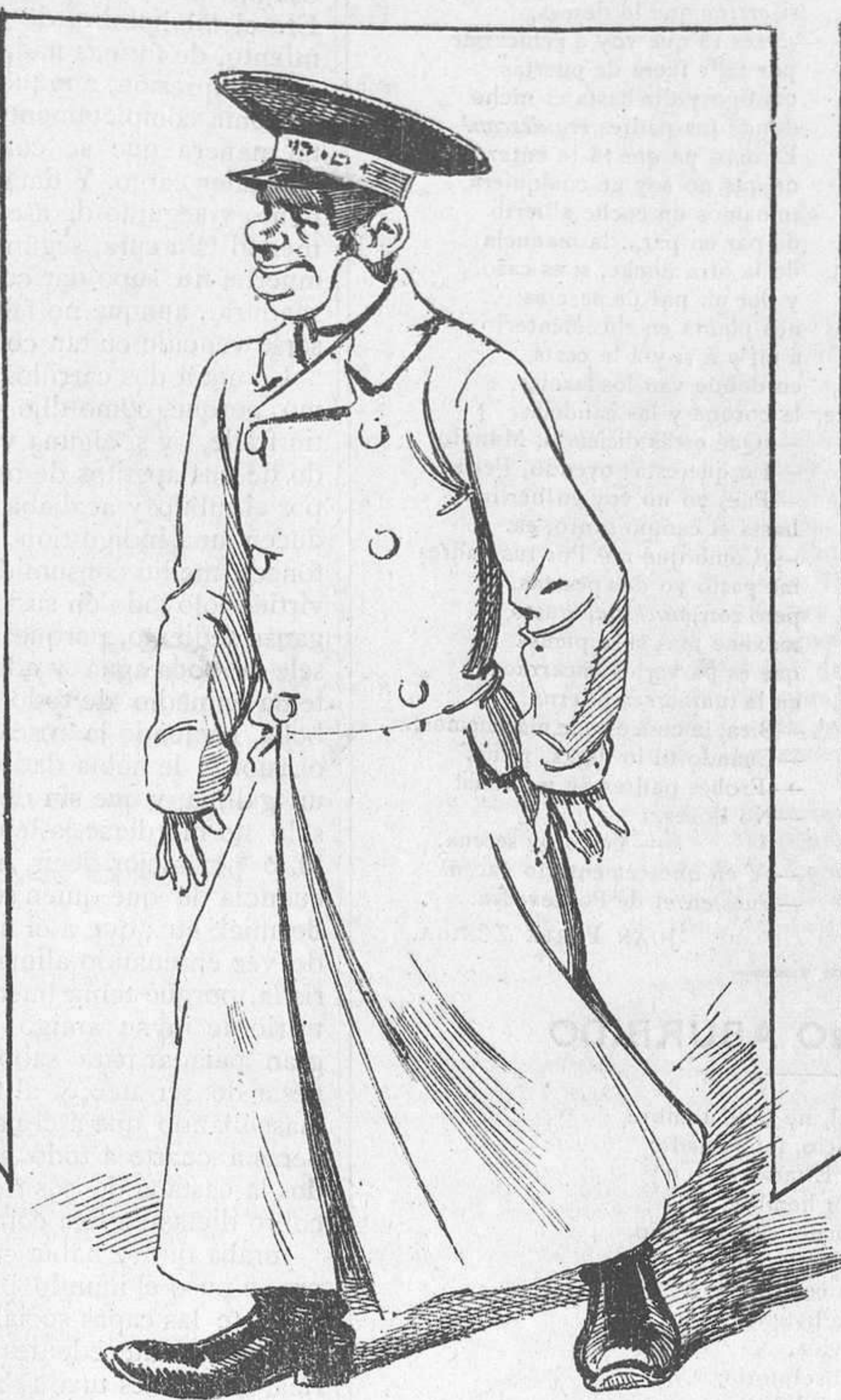
A tener cuidado de los blandones y á entristecerse mucho de orden de la marquesa.