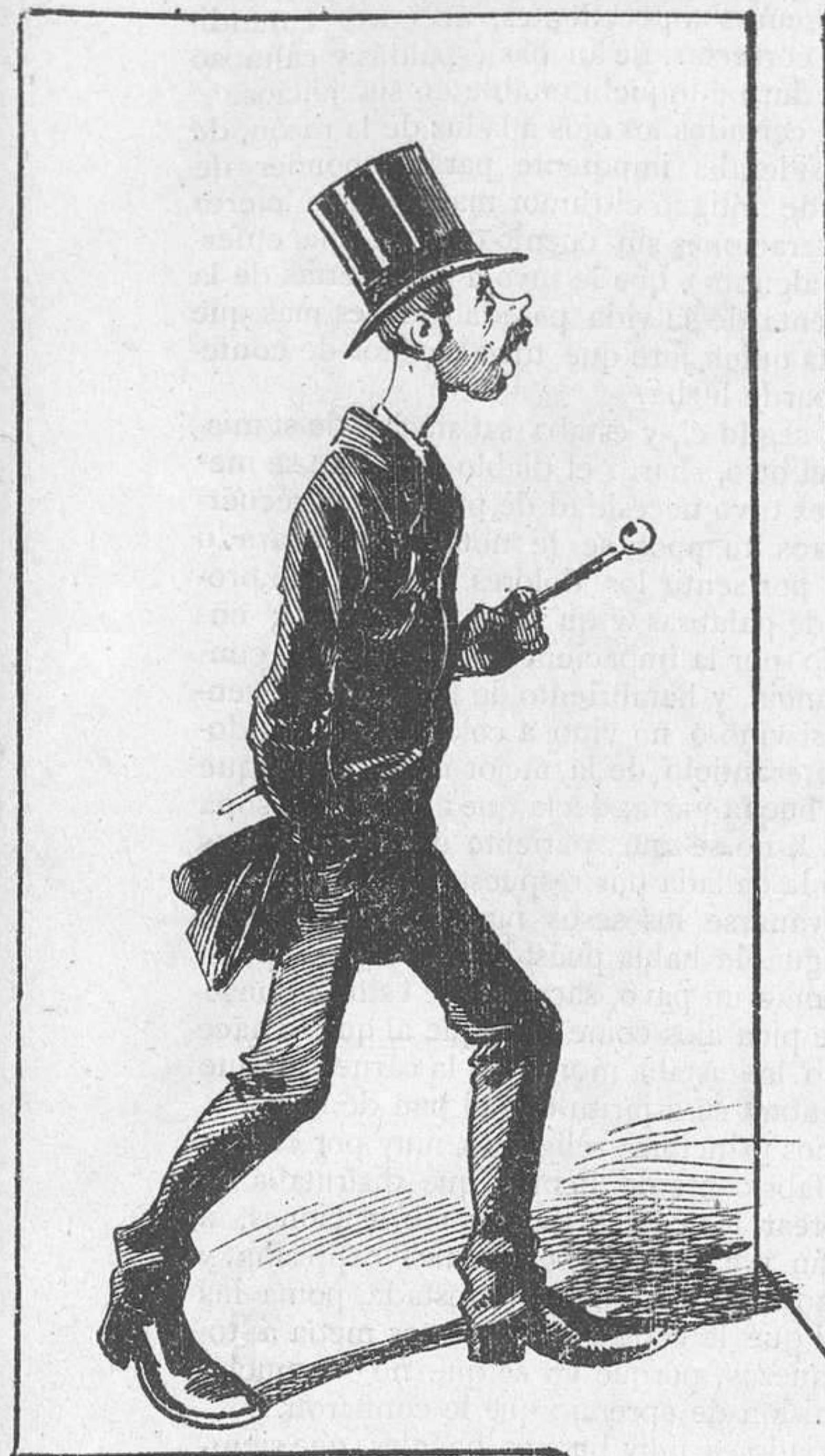
A maldecir los placeres y llorar como un camueso, porque ha averiguado que eso derrite á algunas mujeres.