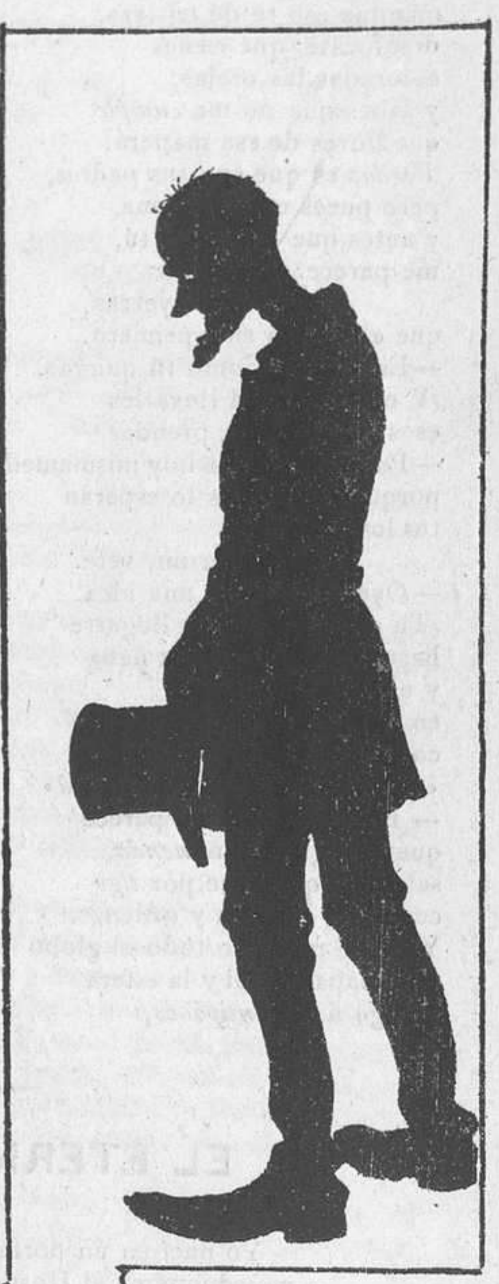
A convencerse de que la dulce esposa no ha resucitado todavía.