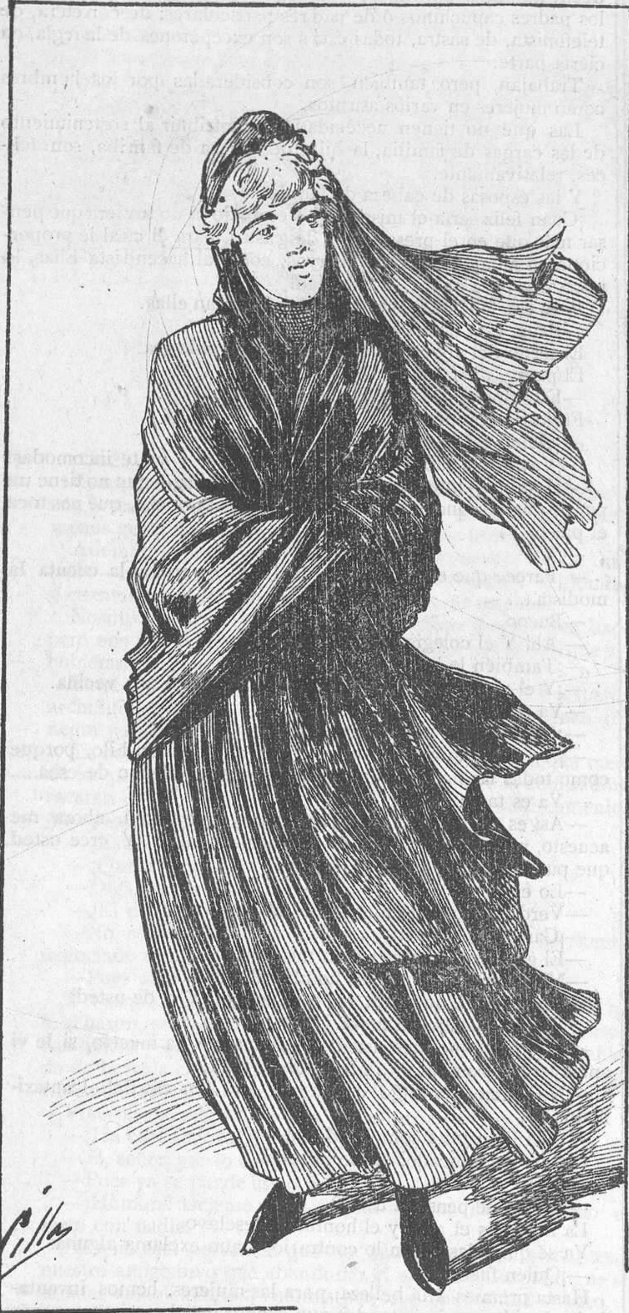
A rezar por el finado y á buscarle un sustituto, que no resulte tan bruto como el del año pasado.