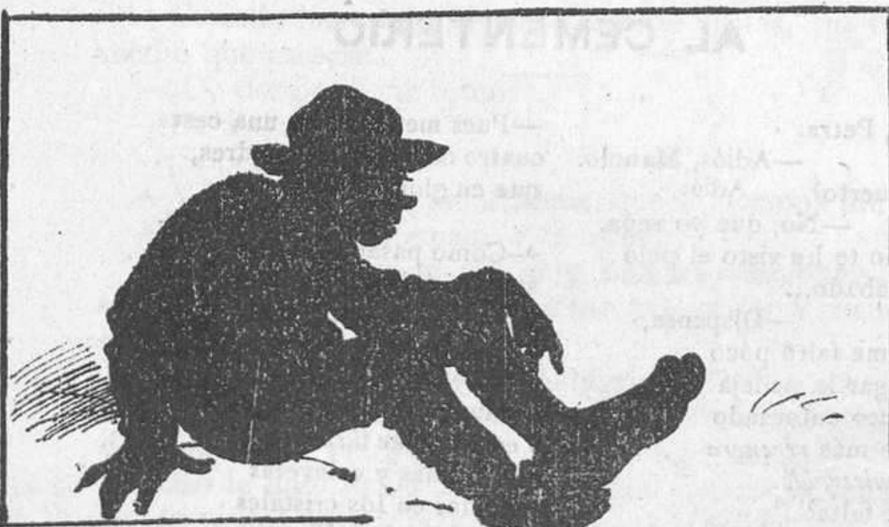
A enseñar asquerosidades para excitar la compasión del público.