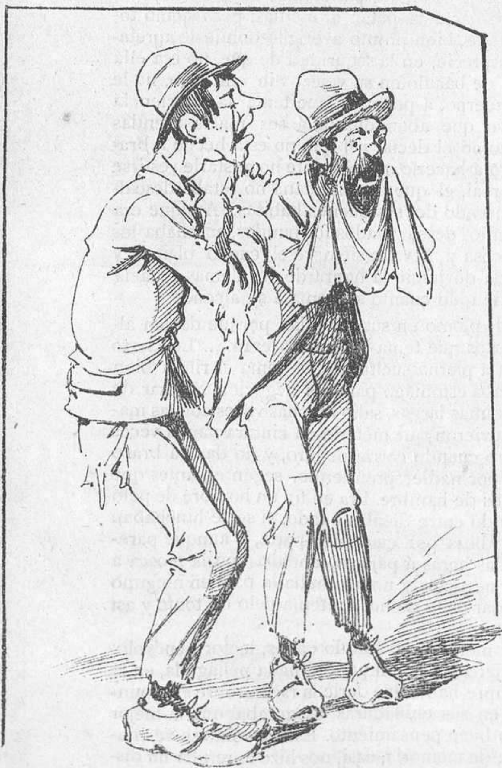
A llorar por el único que aguantaba sablazos.