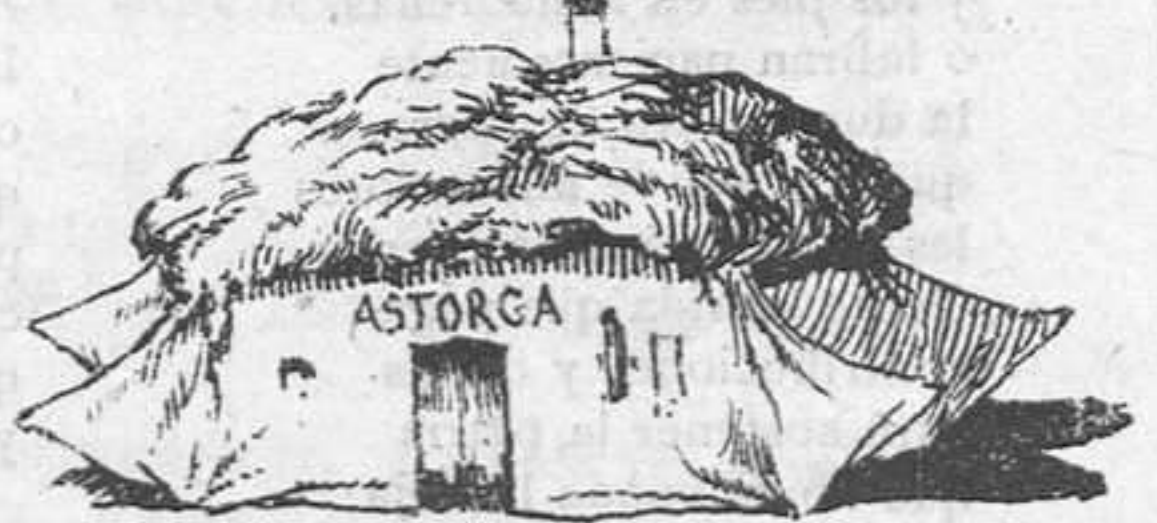
Estación de... mantecada; diez minutos de parada.