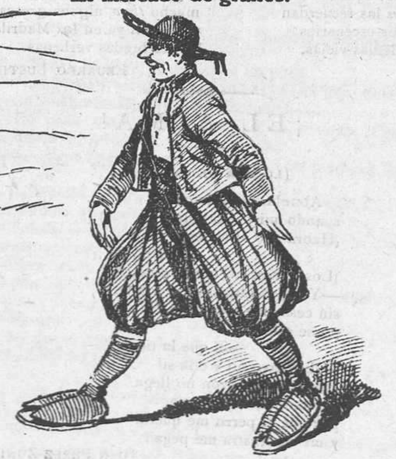
Lo más típico de la tierra.

Lit. de Bravo. Donogaño, 14 y Sandoval, 2, esquina a la de Fuencarral.