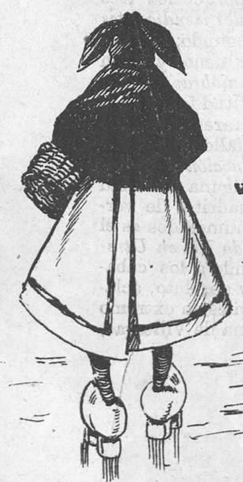
Aldeana del país.