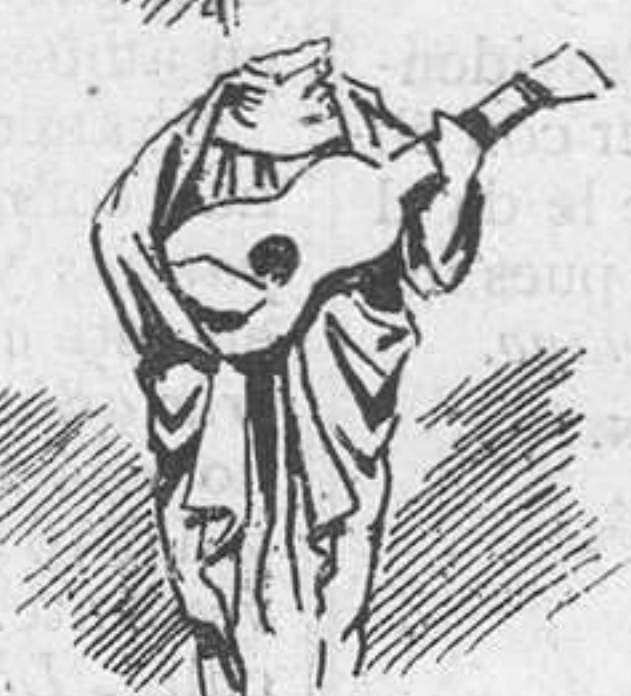
Detalle arquitectónico, que prueba la antigüedad de la guitarra.