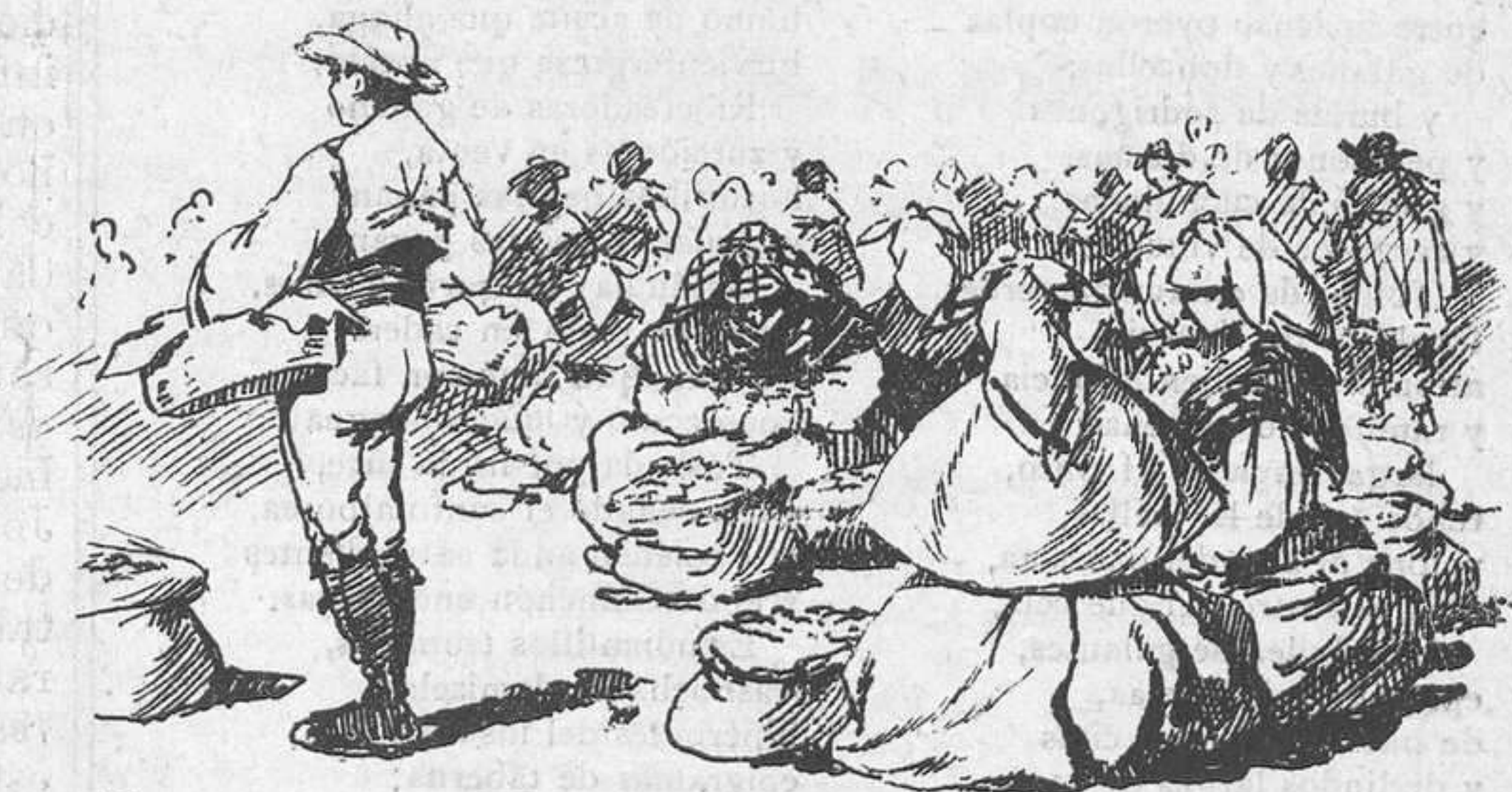
El mercado de granos.