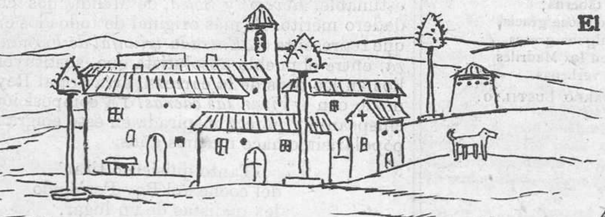
De Sahagún a León. Un trozo de paisaje.