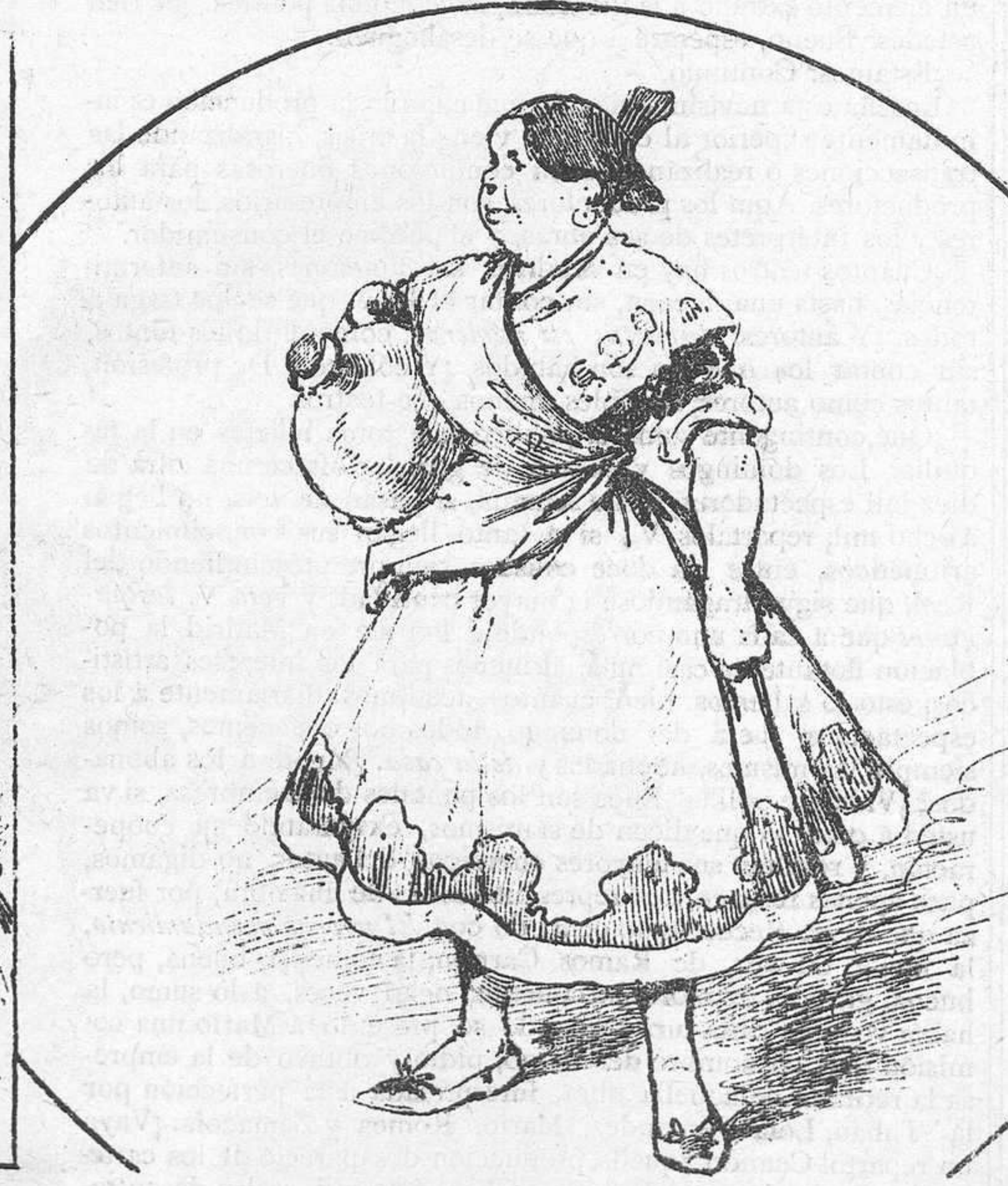
Alcarreña que cuidaba la casa de nuestros padres cuando no había doncellas... ni camareros, ni pajes.