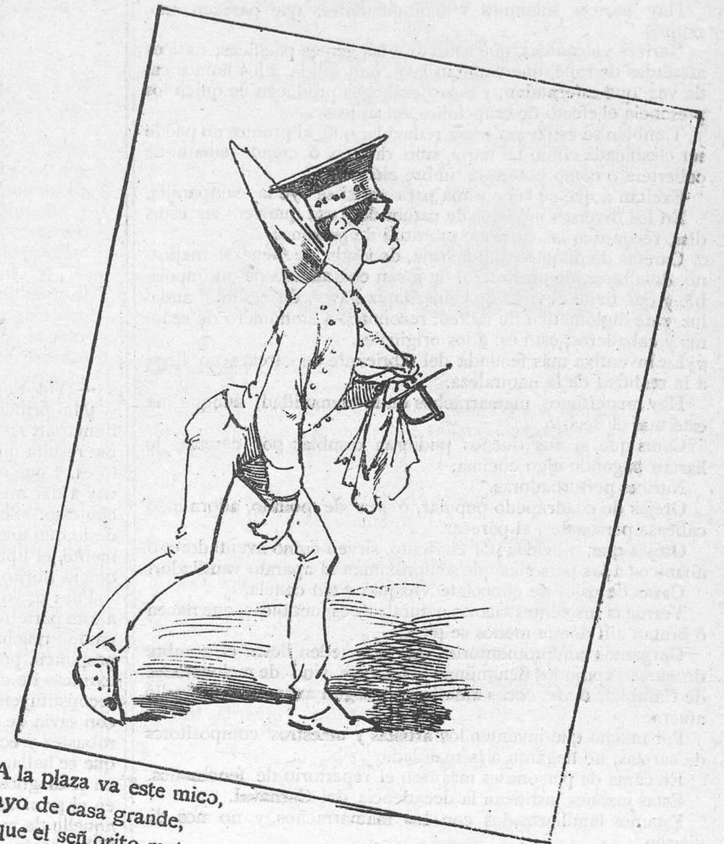
A la plaza va este mico, lacayo de casa grande, porque el señ orito mata dos becerros esta tarde.