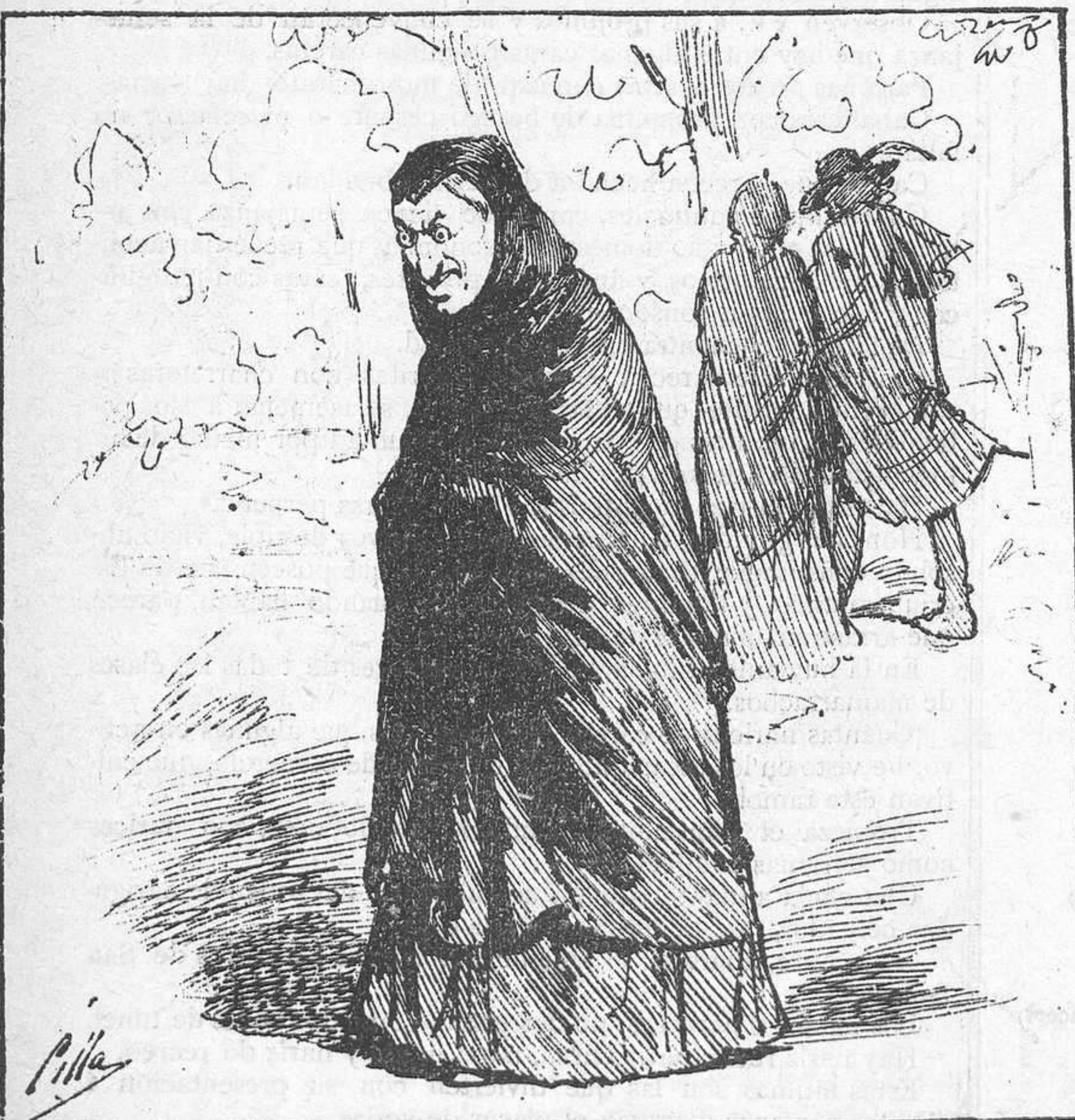
En mil seiscientos y tantos florecía doña Otáñez, guarda-dama contra pobres y tercera de magnates.