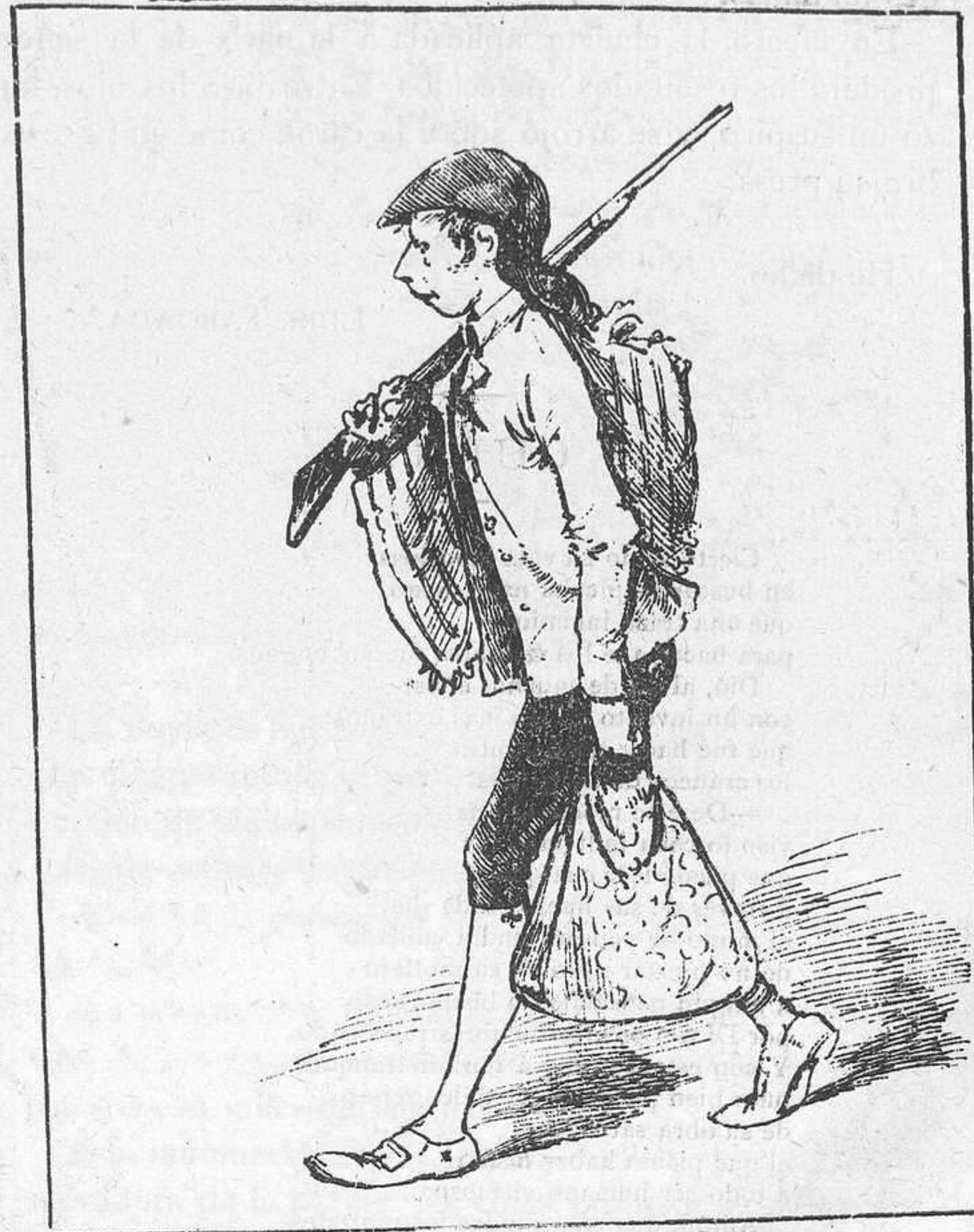
Criado á ratos, y á veces estudiantillo tunante, trota al estribo del amo que cursa en humanidades.