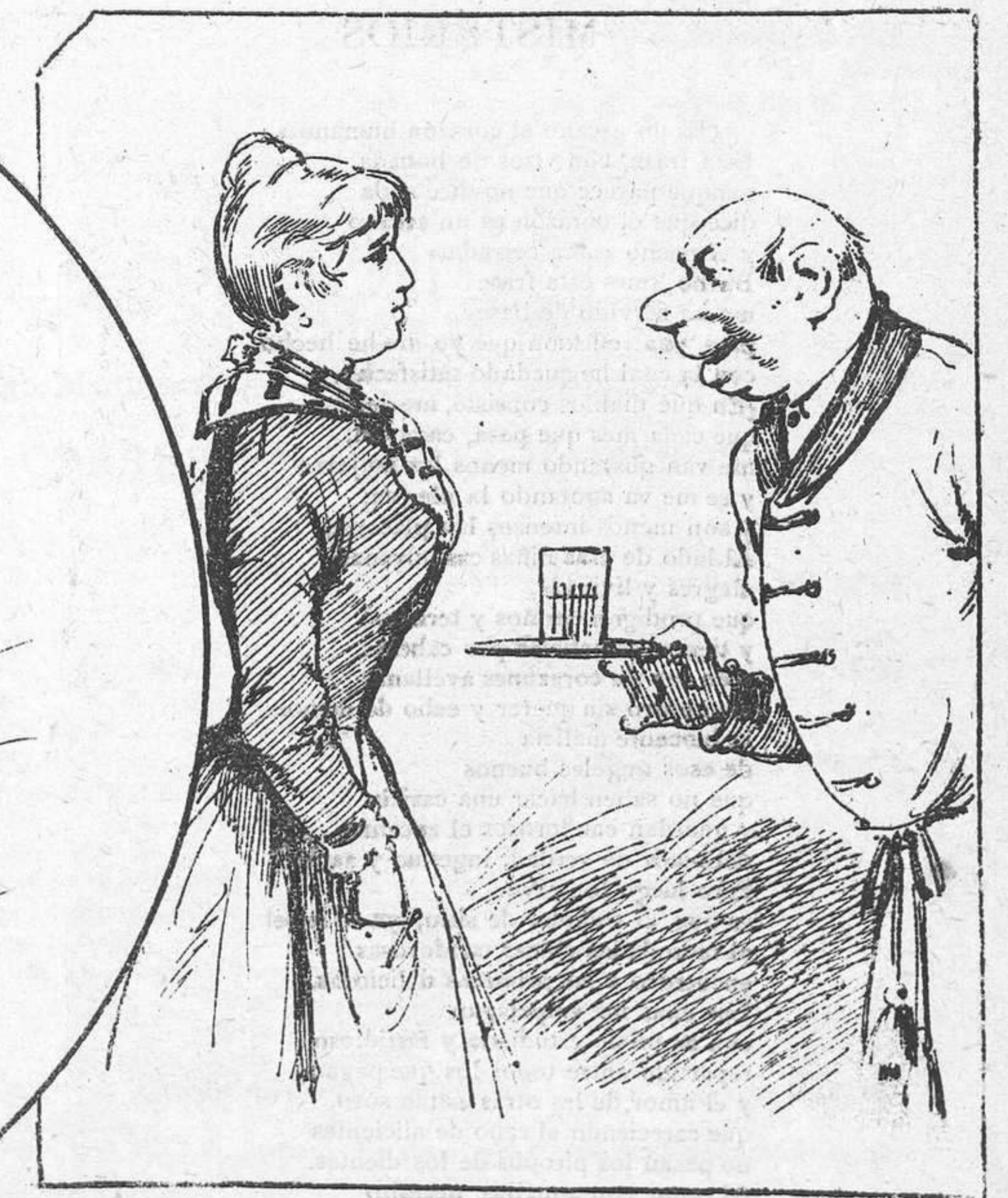
Hoy es el amo el que sirve cuando la muchacha es frágil, ¡sabe Dios cómo lo luce y lo caro que la sale!