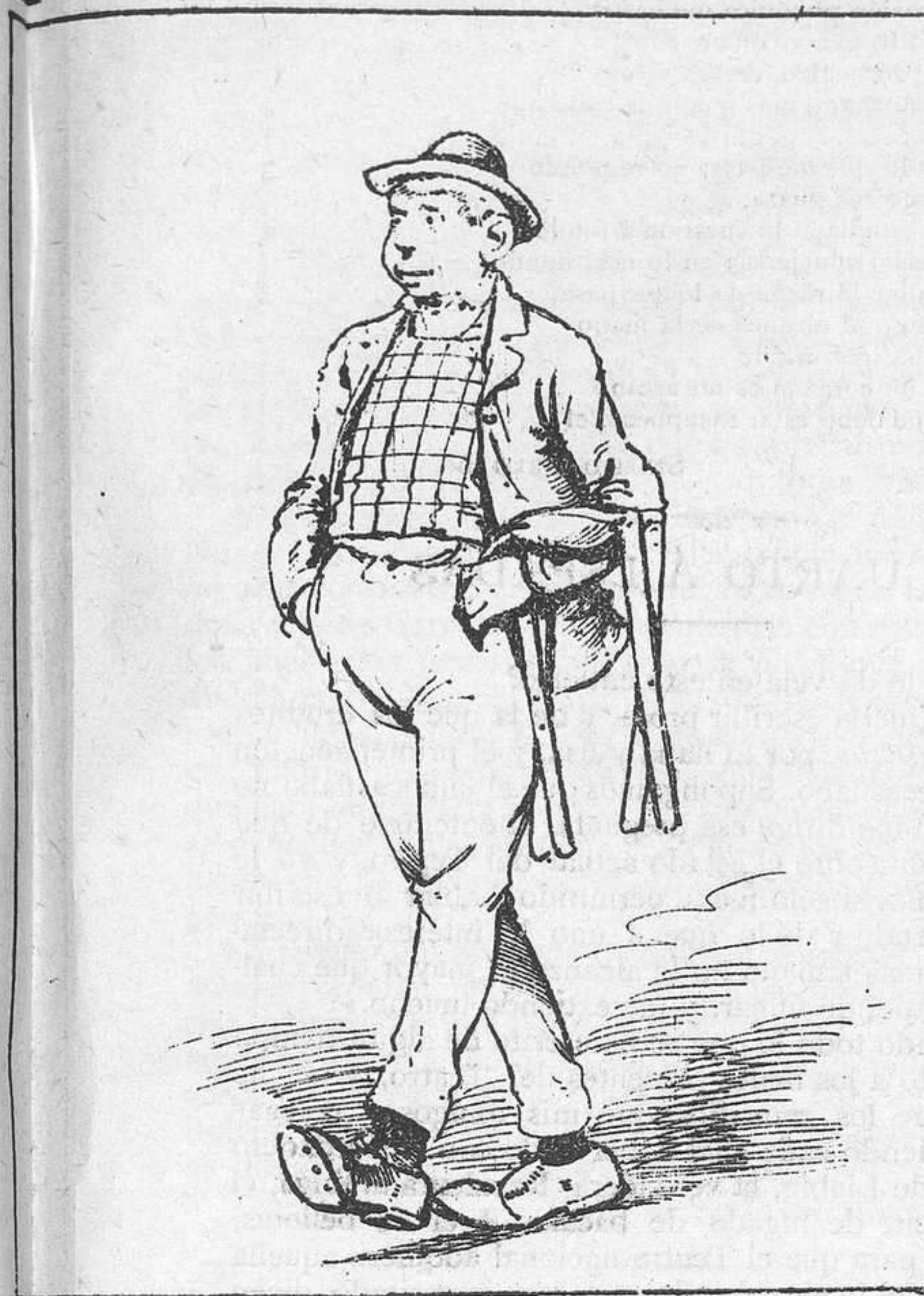
Zagalón de buena pasta que tras la señora sale con la silla de tijera á tomar puesto en la saive.