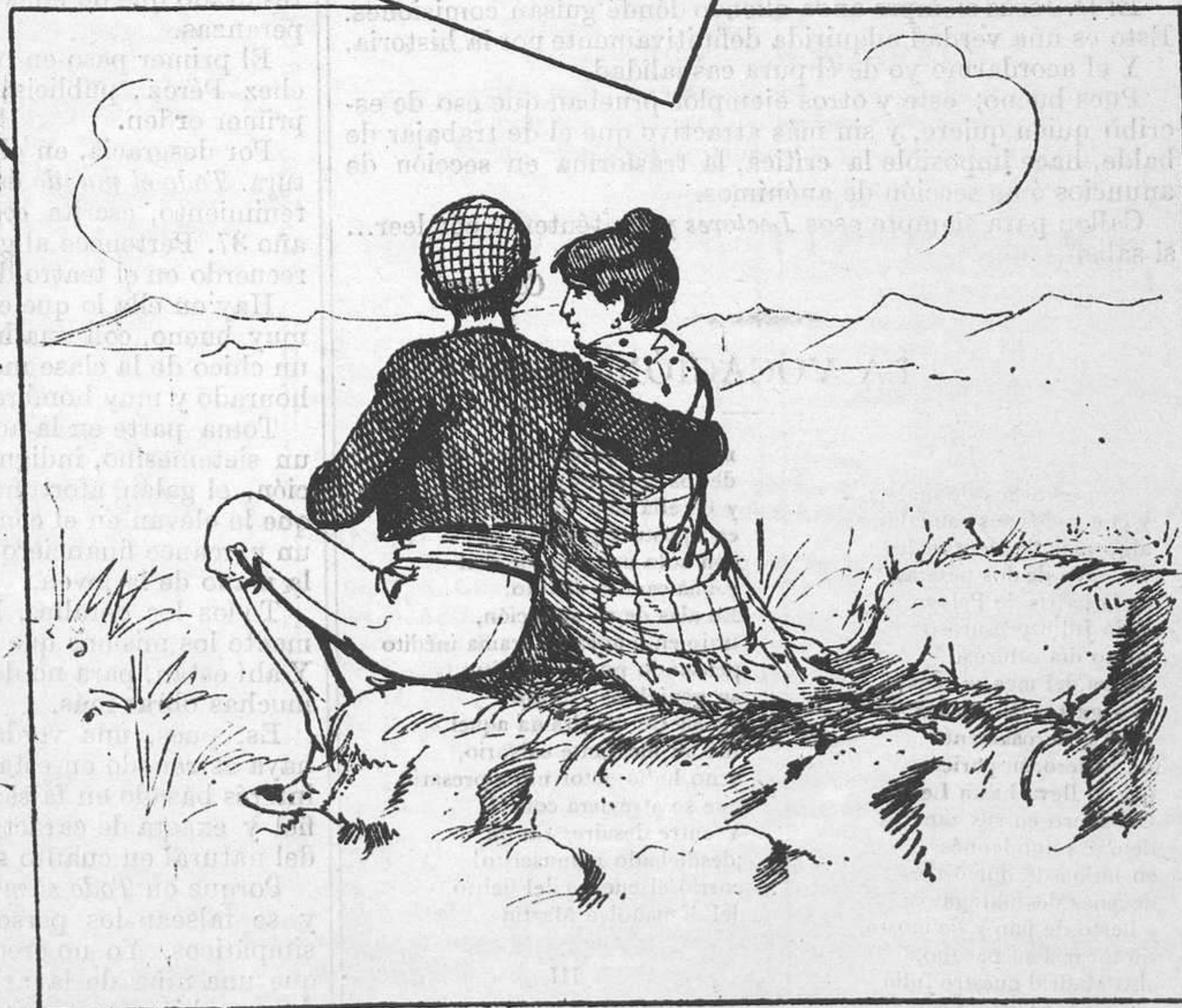
Al de todo lo contrario.