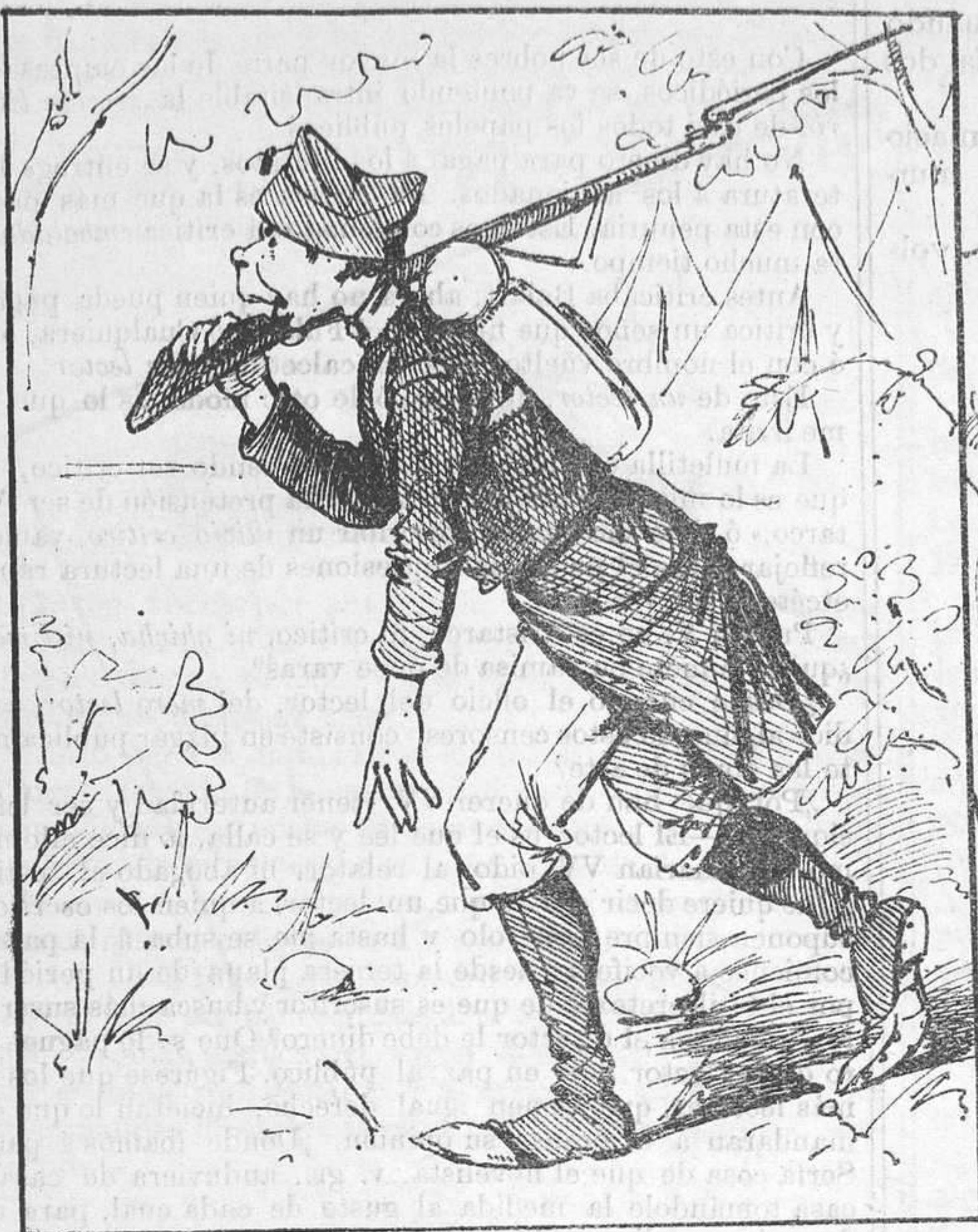
A defender la patria.