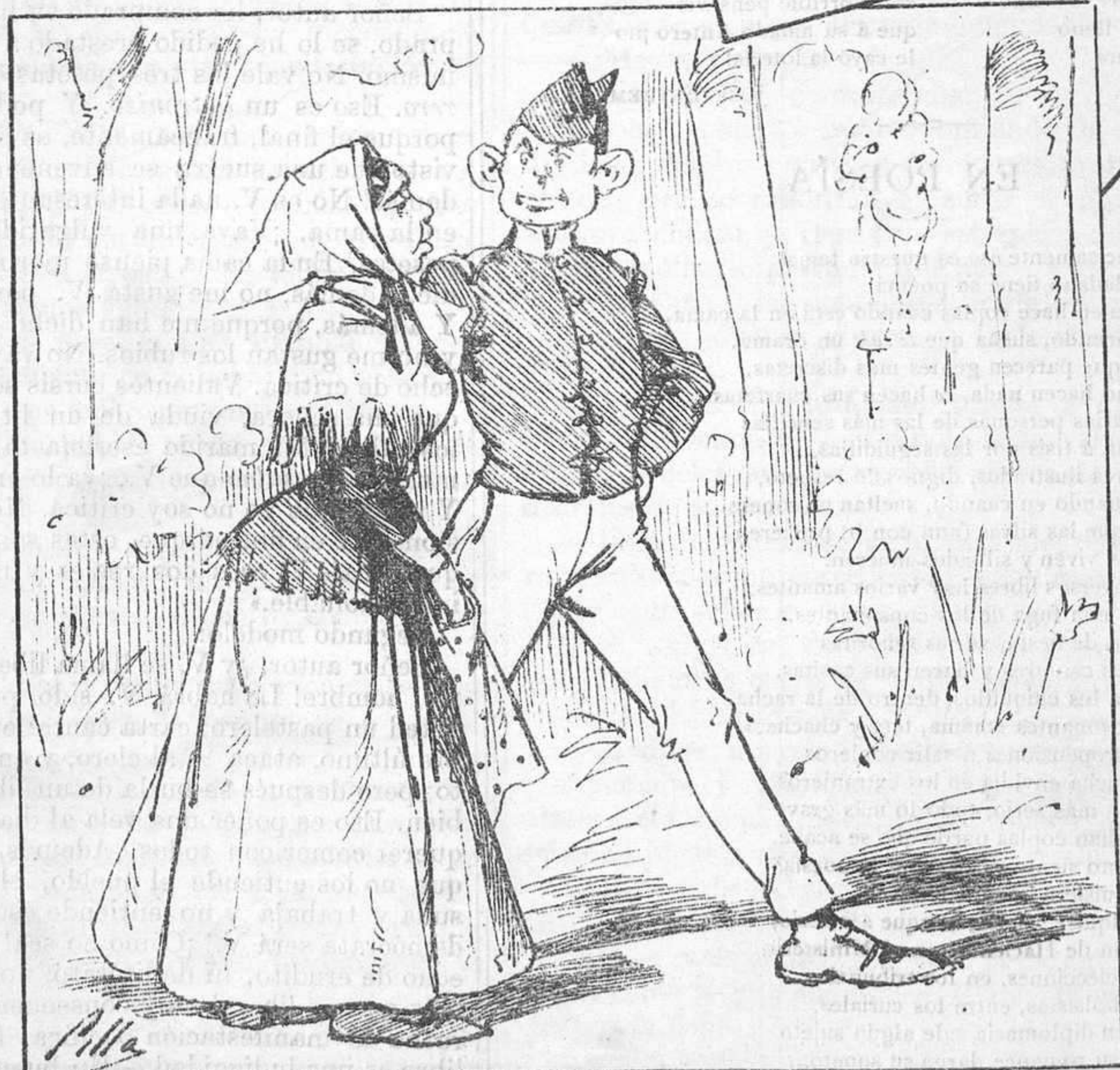
Al campo del Moro.