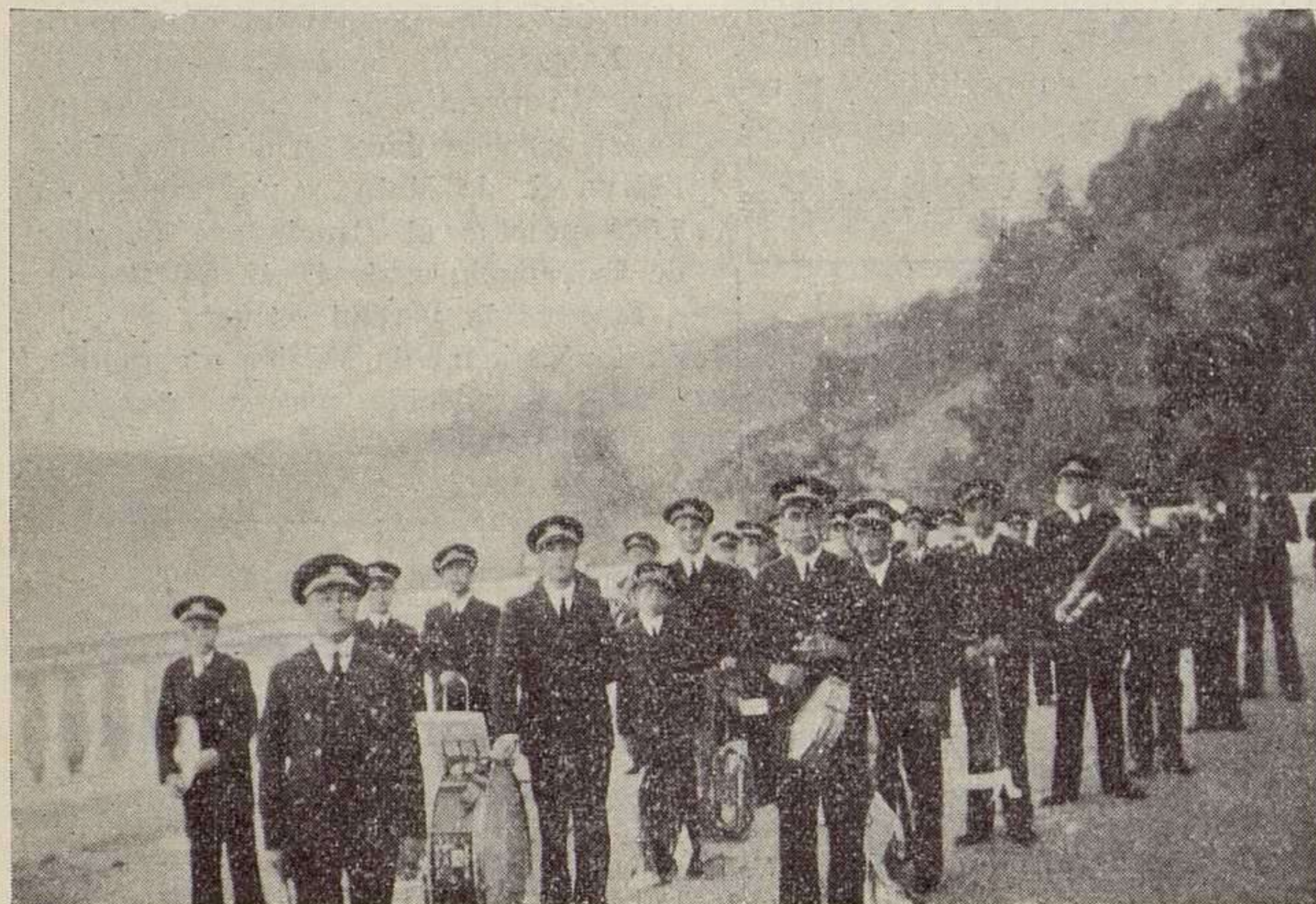
La Banda de Música del Orfanato Nacional.

Cuando se llegue a la comprensión, a la confraternidad de clase, de ser todos para uno y uno para todos , la profesión, la personalidad artística se-