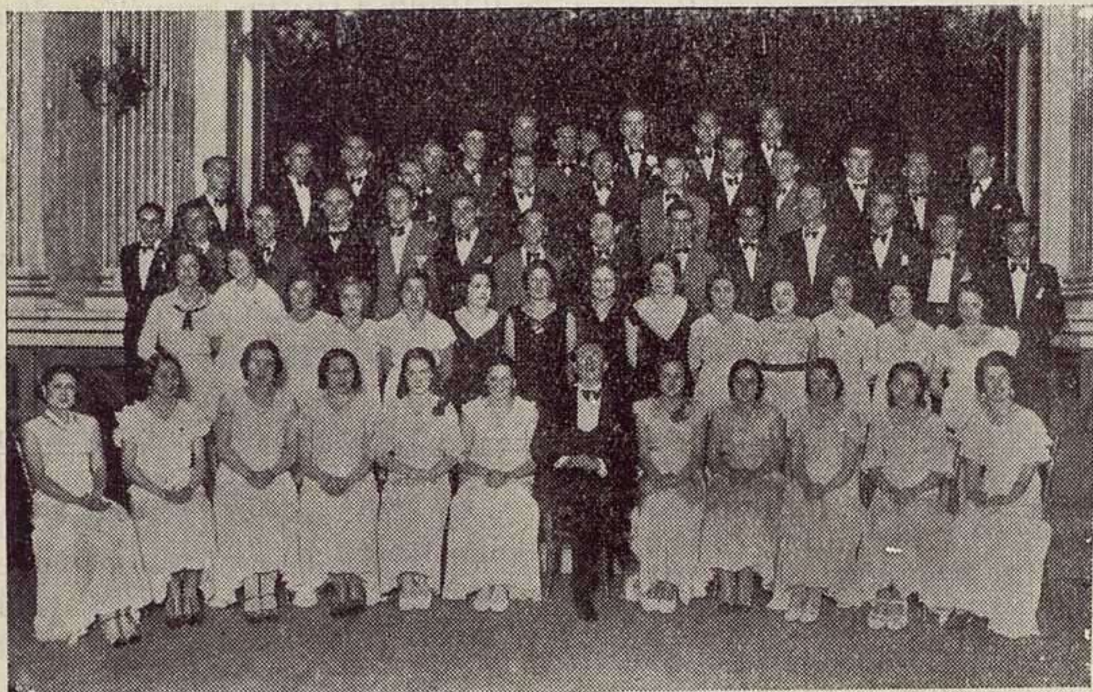
# La Masa Coral «Málaga», cuya actuación en la Plaza de Toros de Almería ha constituido un triunfo sin precedentes.

Interpretaron once obras a coro y tres con acompañamiento de Banda. De las primeras las más aplaudidas y celebradas fueron: "Abreme la puerta", de Benedito; "Molondrón", de Sáez de Adana; "Sí, sí, sí", de Lázaro, y la "Sardana de las monjas", de Morera, que fueron, en verdad, magistralmente