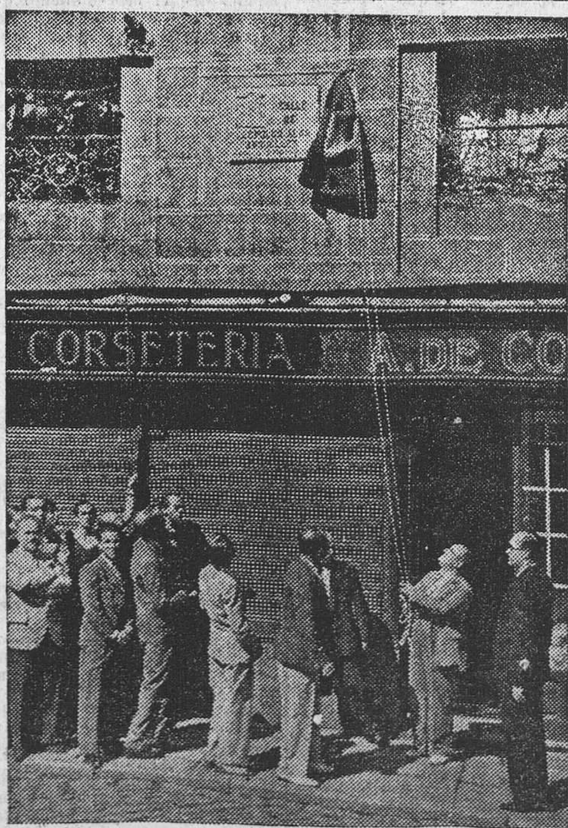
La calle del Conde de Romanones—nombre representativo de la tradicional picaresca política—se llama desde ahora de Leopoldo Alas Argüelles, nombre insignie de un mártir de la República, cuyo prestigio—y su vida—borrará el recuerdo de una época pasada que nunca más volverá.

sectores del frente, habiendo ocupado importantes posiciones rebeldes para futuros avances. Siguiendo su victoriosa marcha,