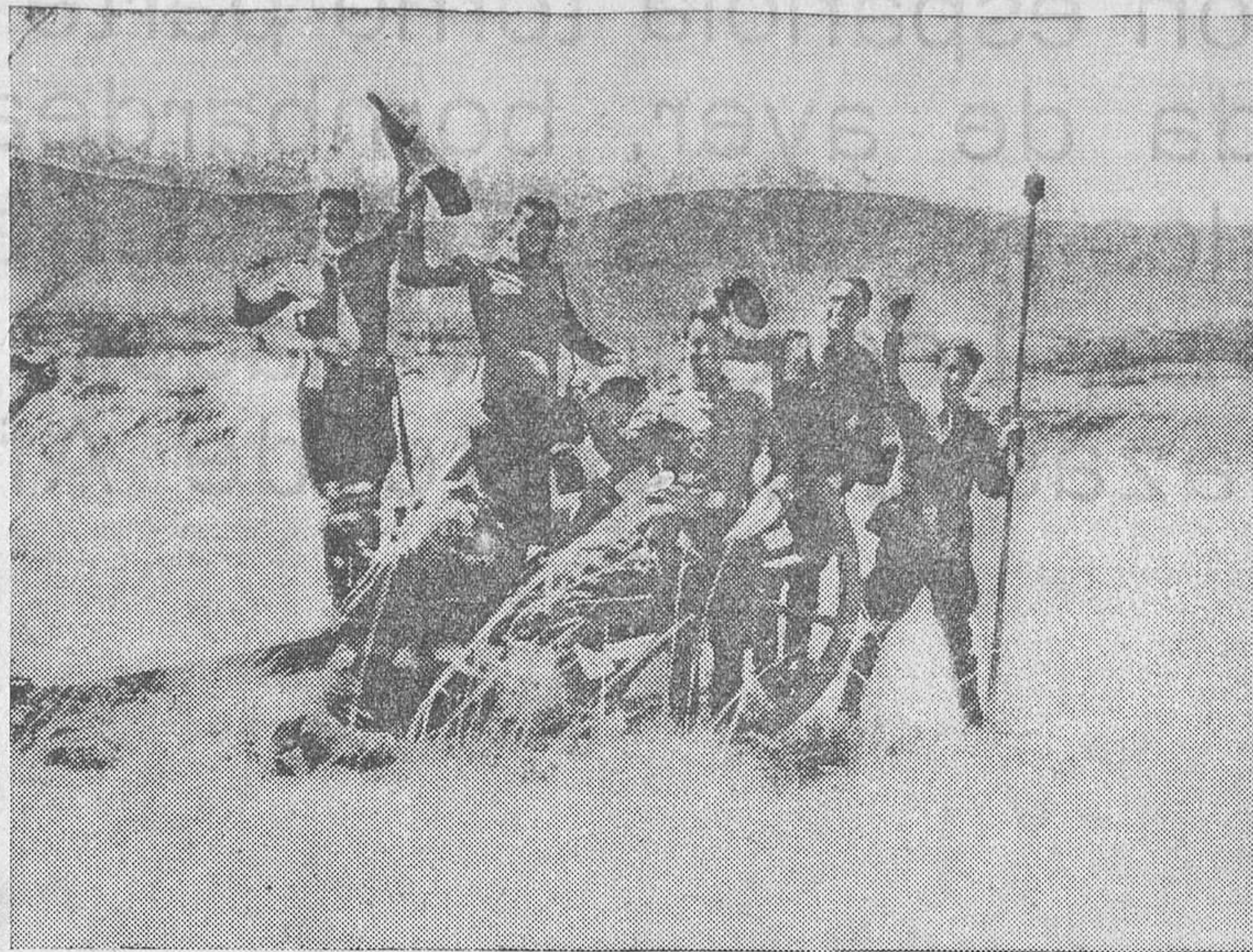
Soldados republicanos vitoreando al Frente Popular después de haber cogido una pieza de artillería a los facciosos en la acción de Somosierra

Otros focos bombardeados Zaragoza, Logroño, Córdoba y Cádiz también fueron bombardeados eficazmente.