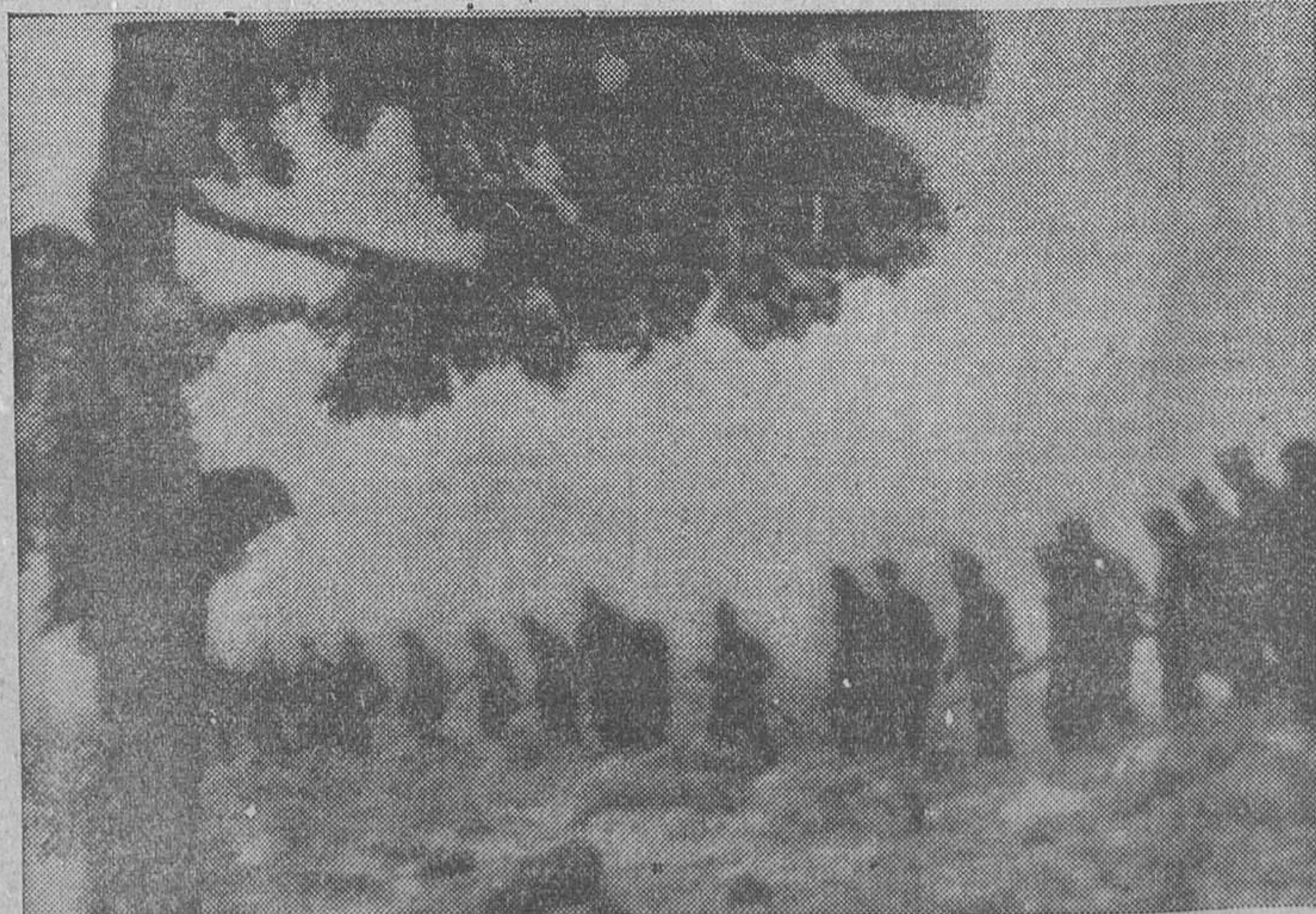
LA GUERRA EN LA SIERRA.—Ayer cayó de nuevo una gran nevada en los frentes de la Sierra. Nuestros bravos soldados se han habituado ya a la inclemencia de aquel clima y marchan a la lucha con el mismo entusiasmo que cuando era más grata la estancia en aquellos picachos, al principio de la sublevación.

Quedan exentos de esta disposición los laboratorios y almacenes de drogas y especialidades farmacéuticas, que, controlados para servicios de urgencia, trabajarán con servicio de guardia las veinticuatro horas.