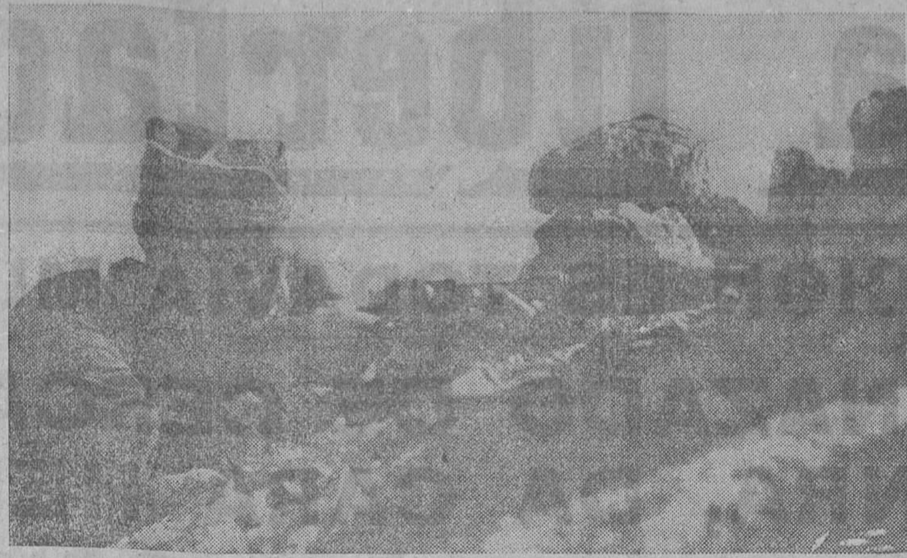
Nuestras primeras líneas en constante fuego con el enemigo, que hace esfuerzos por llegar a la capital de la República

La Aviación republicana actuó como protección, y después atacó con energía y eficacia, y a media tarde la lucha se desenvolvía favorablemente para nuestras fuerzas.