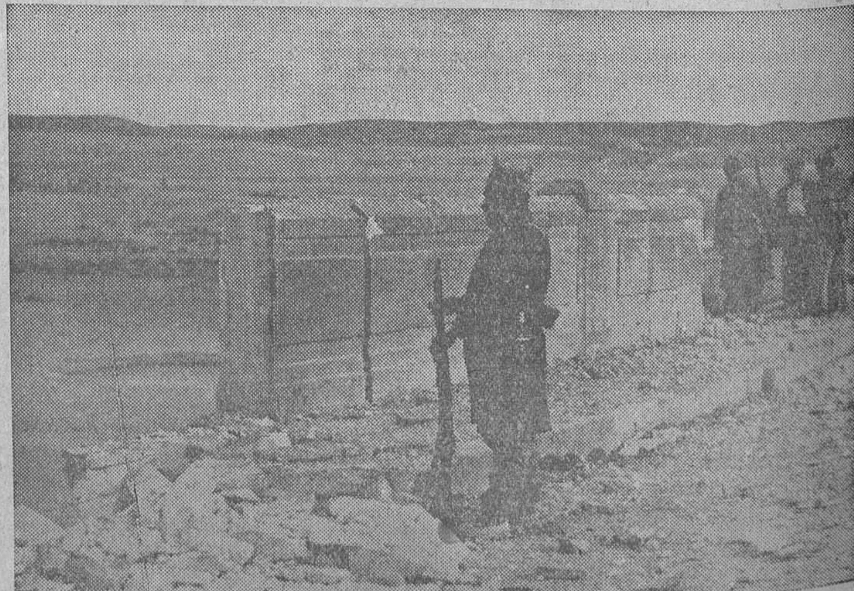
El histórico puente romano de las proximidades de Aranjuez, sobre el que se ejerce fuerte vigilancia por nuestros soldados.