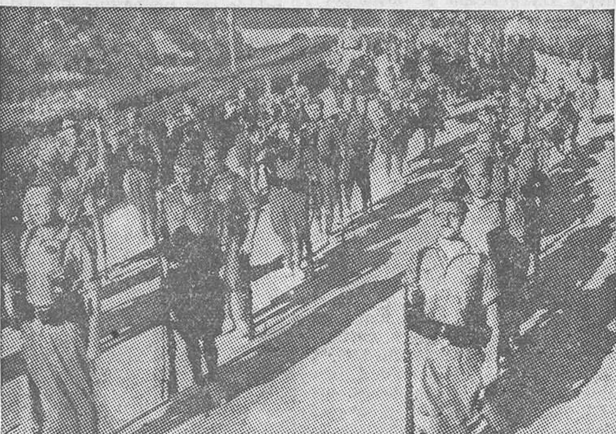
Una escena de «La bandera», film de Duvivier que el lunes se estrenará en el Callao