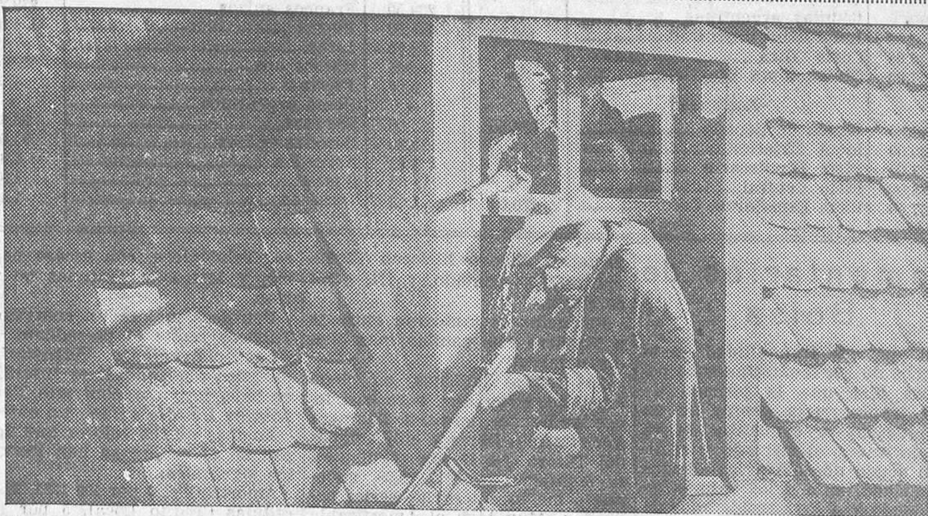
Una escena de «Por los derechos del hombre», impresionante film que se estrenará el lunes en la Prensa

... Para el público cineasta será una novedad presenciar esta película netamente nacional y auténticamente limpia, alegre, sugestiva y amena.