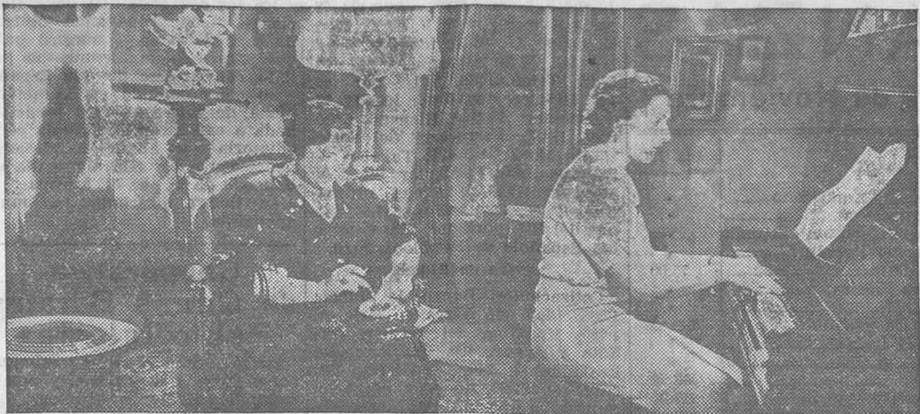
Una escena de «El malvado Carabel», producción Ufilms que se estrenará próximamente

riamos el riesgo de que el públicamente preparado. «Viva la compañía» no es un film cómico más; es sencillamente la mejor película realizada hasta la fecha, de ambiente cómico militar, tanto porque posee un argumento en extremo simpático y gracioso como porque ha sido conseguida de un modo impecable que hará que su recuerdo sea imborrable de los aficionados a la pantalla.