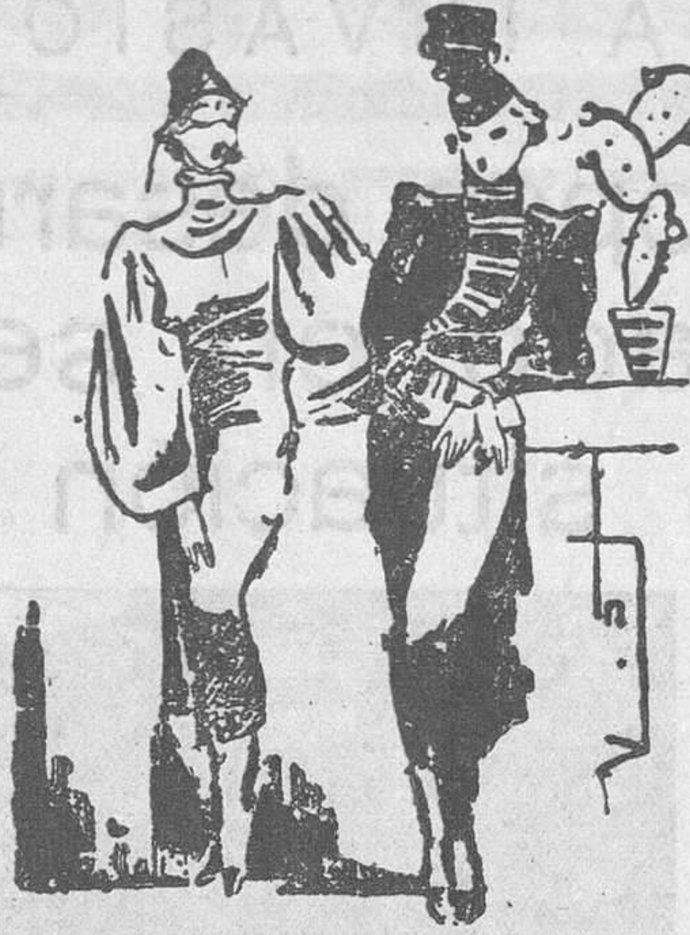
-Mi novio va diciendo a todo el mundo que se casa con la mujer más bonita que existe. -¿Qué bonito! ¡Después de estar cuatro años en relaciones contigo! (De 'Marco Aurelio', Roma.)