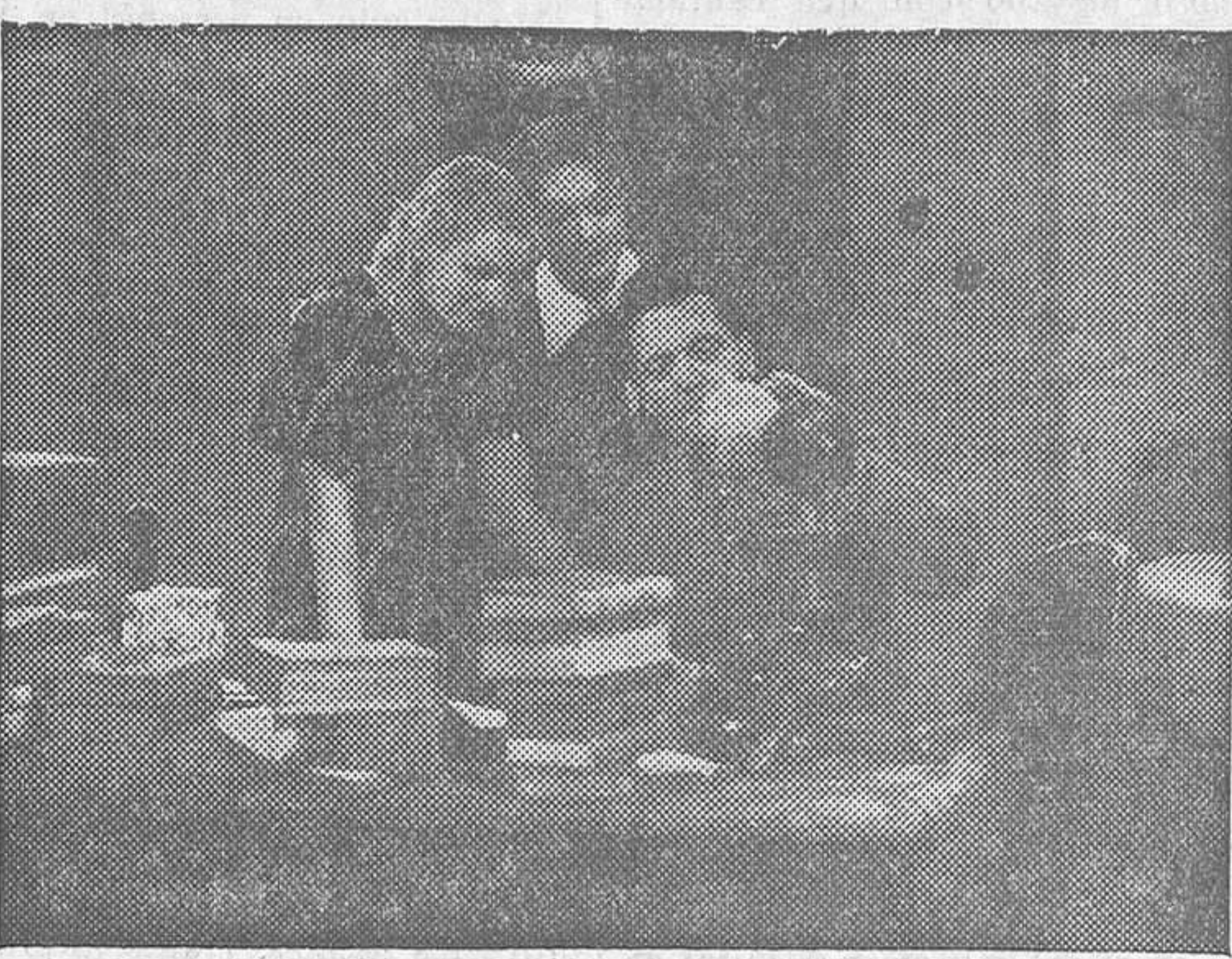
Una escena de «Viva la compañía», film de Febrer y Blay que el lunes se estrenará en Royalty