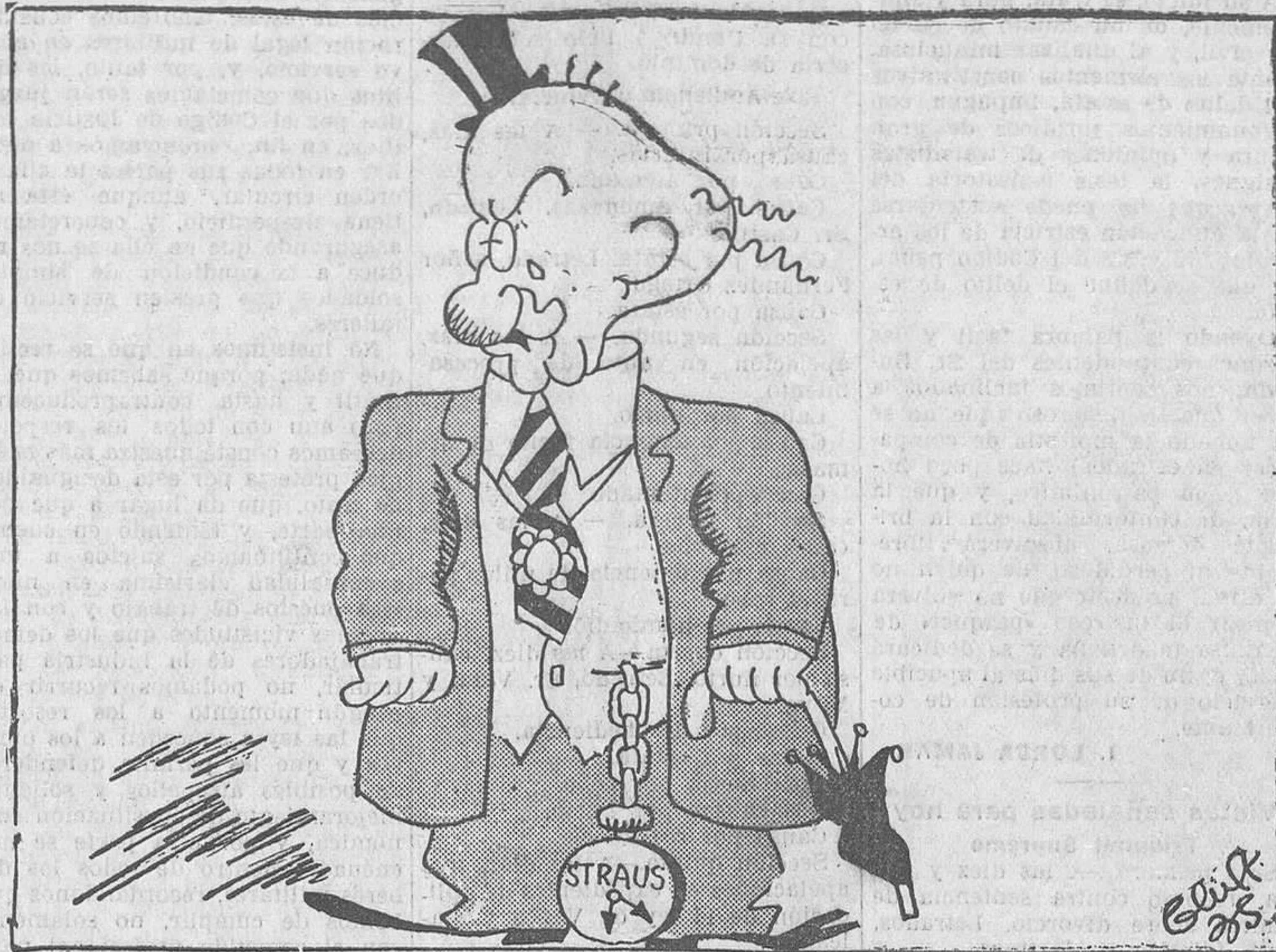
LA TRAGEDIA, por Bluff - ¡Y tener que decir chistes todos los días a los periodistas!