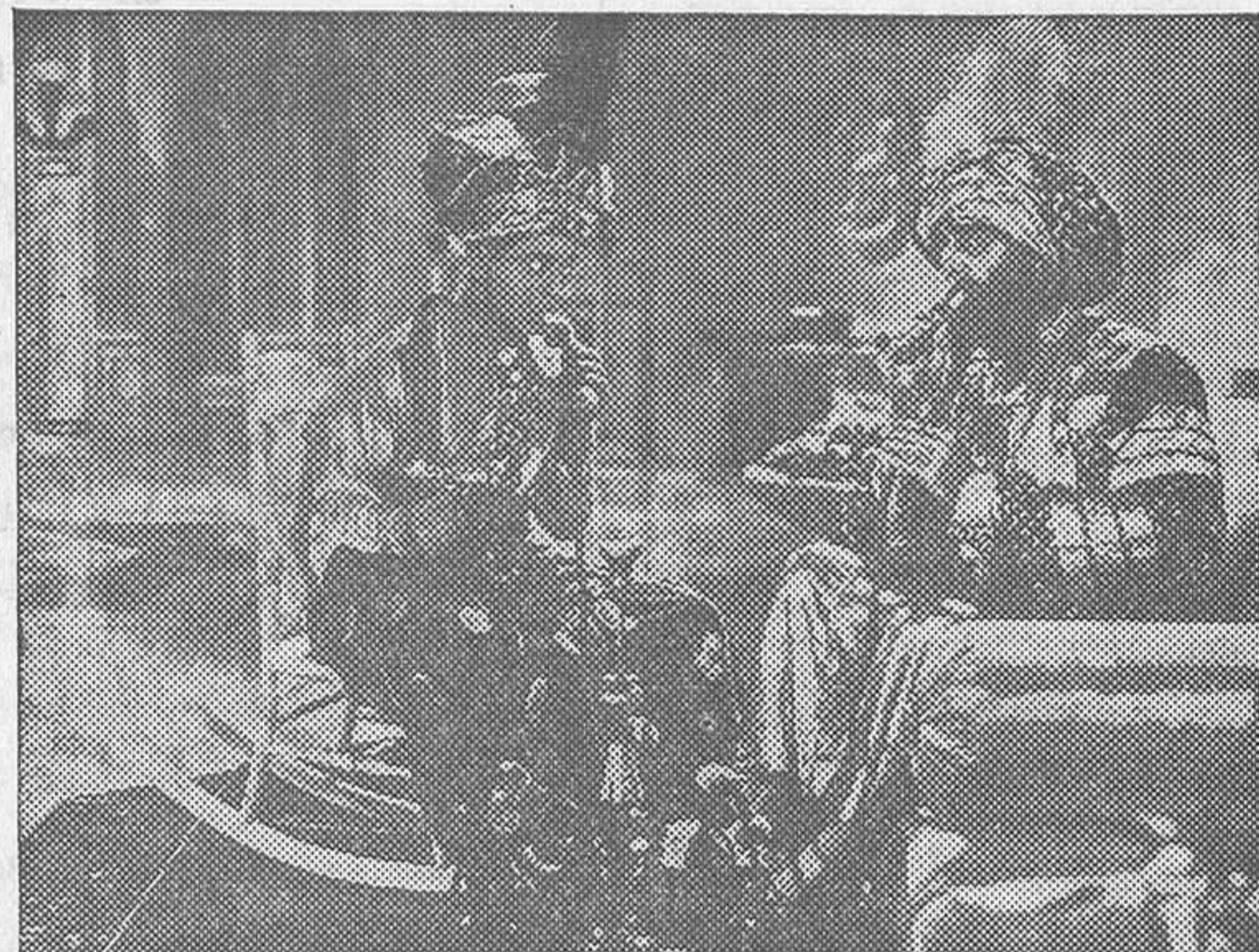
Eddie Cantor en «El chico millonario», que se proyecta con gran éxito en Capitol