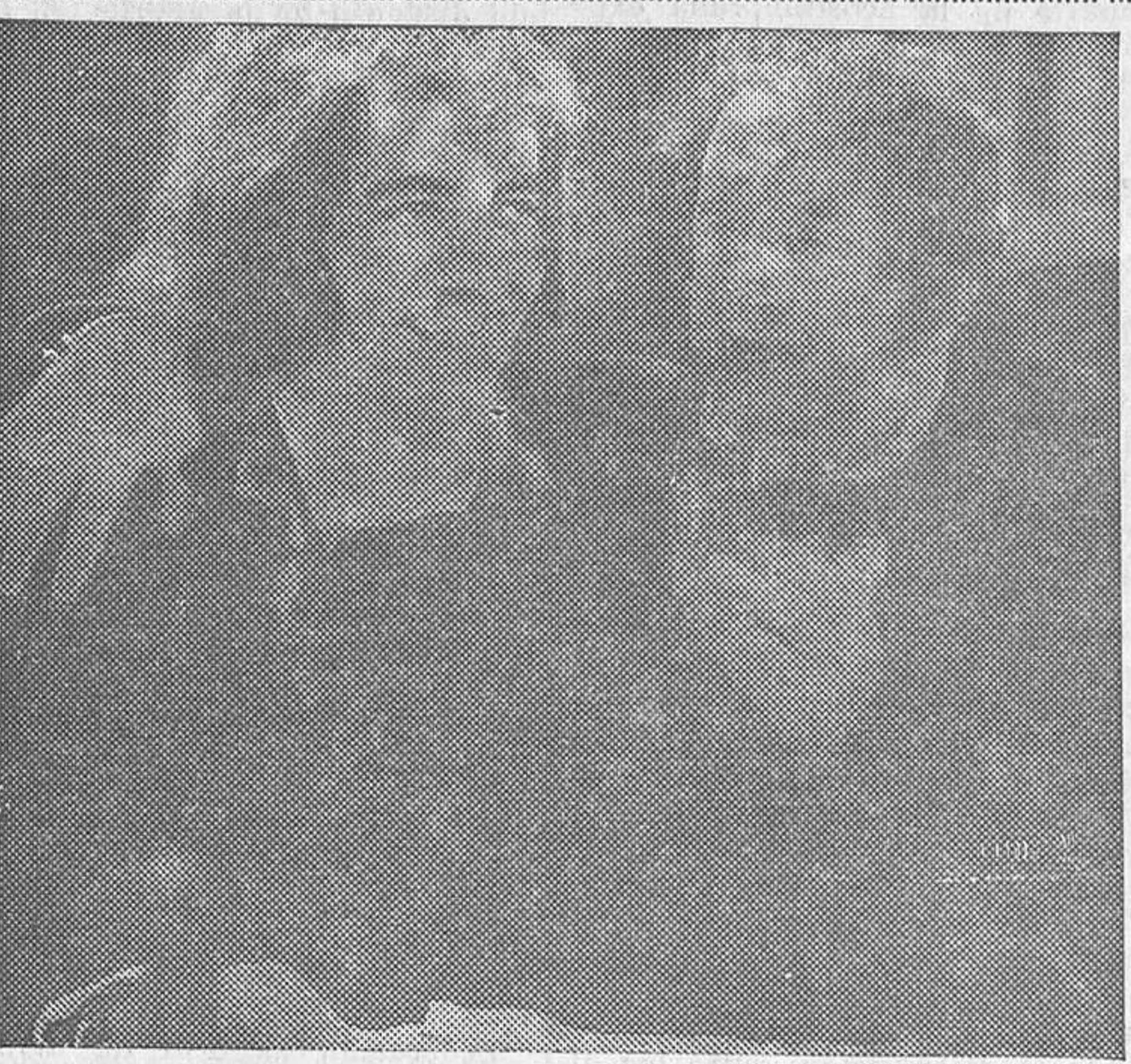
Una escena de «Los misterios de París», emocionante film que el lunes se estrenará en Madrid-Paris