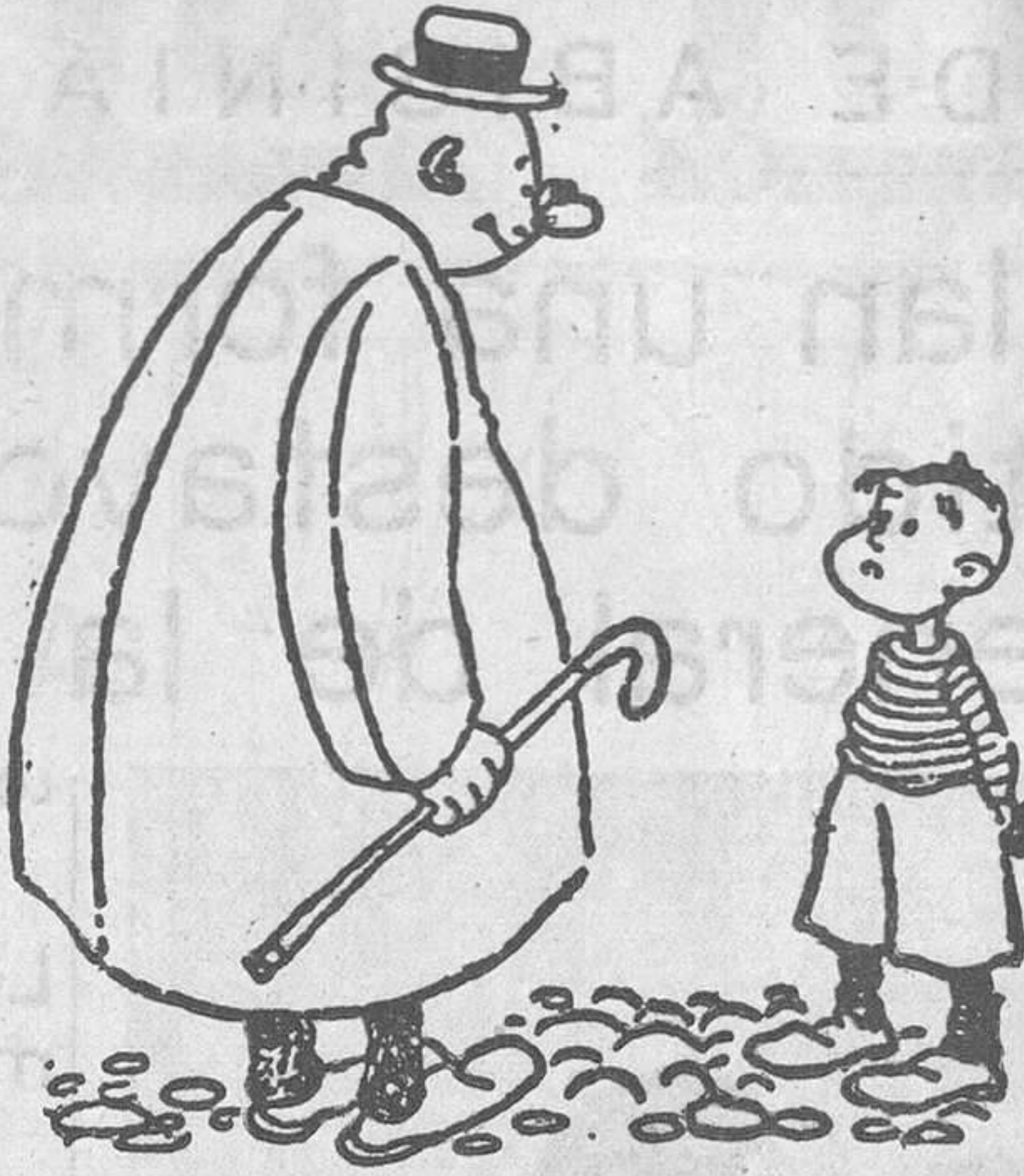
-¿Y en qué ha conocido tu profesor que yo te ayudo en los trabajos? -En que dice que es imposible que yo solo ponga tantas faltas de ortografía. (De 'Gazzettino Illustrato', Venecia.)