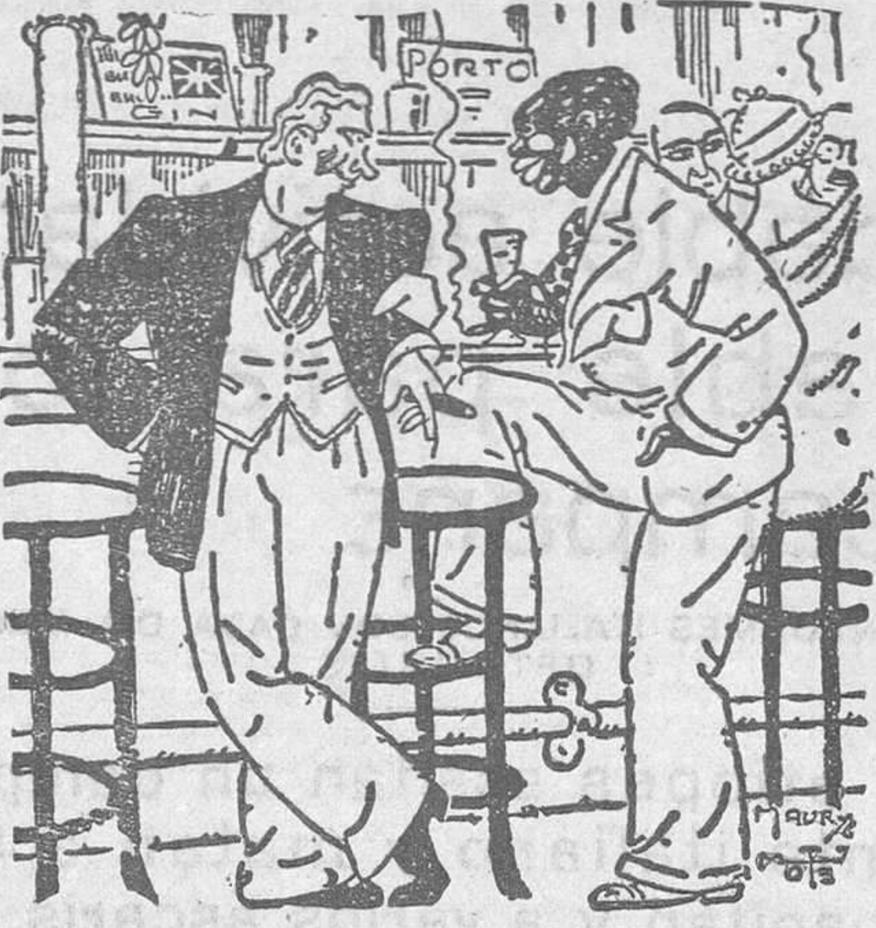
-Usted que es negro... -En qué lo ha conocido usted? -En el acento.