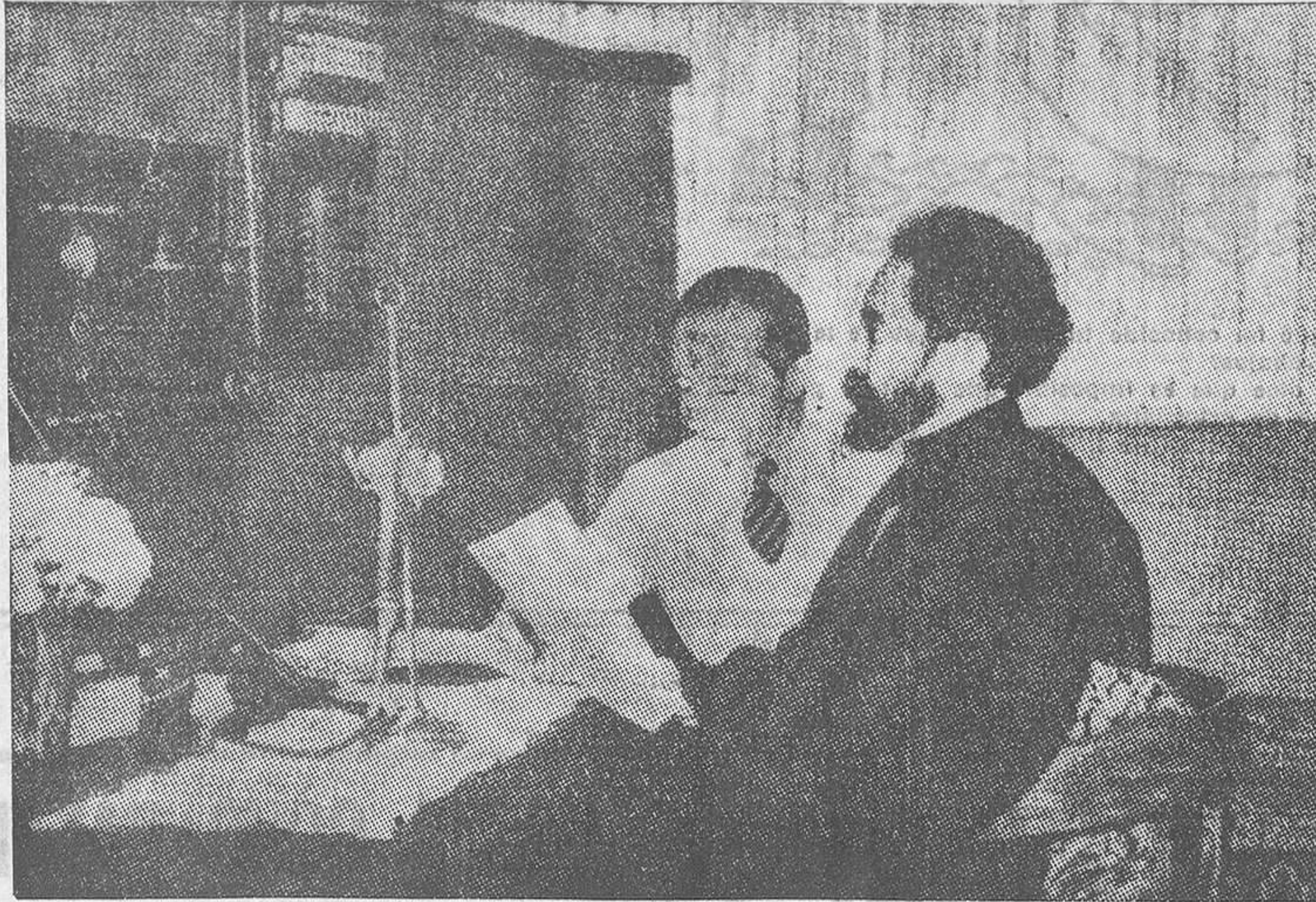
Hace pocos días el Negus, en su despacho del palacio de Addis Abeba, utilizó las modernas ondas eléctricas de la radio para enviar al pueblo francés un mensaje de simpatía y un llamamiento a sus ideales de justicia. En la fotografía aparece el emperador de Abisinia leyendo su mensaje ante el teléfono. A su lado se encuentra el corresponsal de «Paris-Soir» en Addis Abeba.

San Pedro de California, 22.—El vapor «Oregon» ha zarpado hoy para Oriente con una tripulación de marineros no asociados. Lleva a bordo 36.000 barriles de gasolina oficialmente consignados a Manila y Singapur; pero, según se dice, su destino verdadero es Magadiscio. La tripulación del «Oregon» se negó a aceptar la llamada bonificación de guerra y embarcar, por lo que fué substituida por marineros no sindicados.