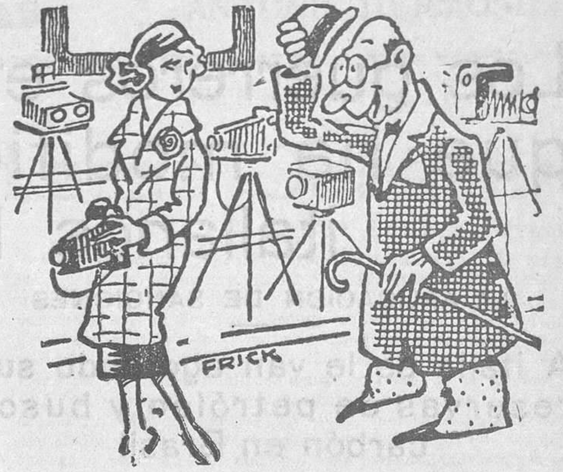
-Señorita, soy su esclavo. ¿En qué puedo serle útil? -Si quisiera usted hacer de tripode para probar esta máquina...