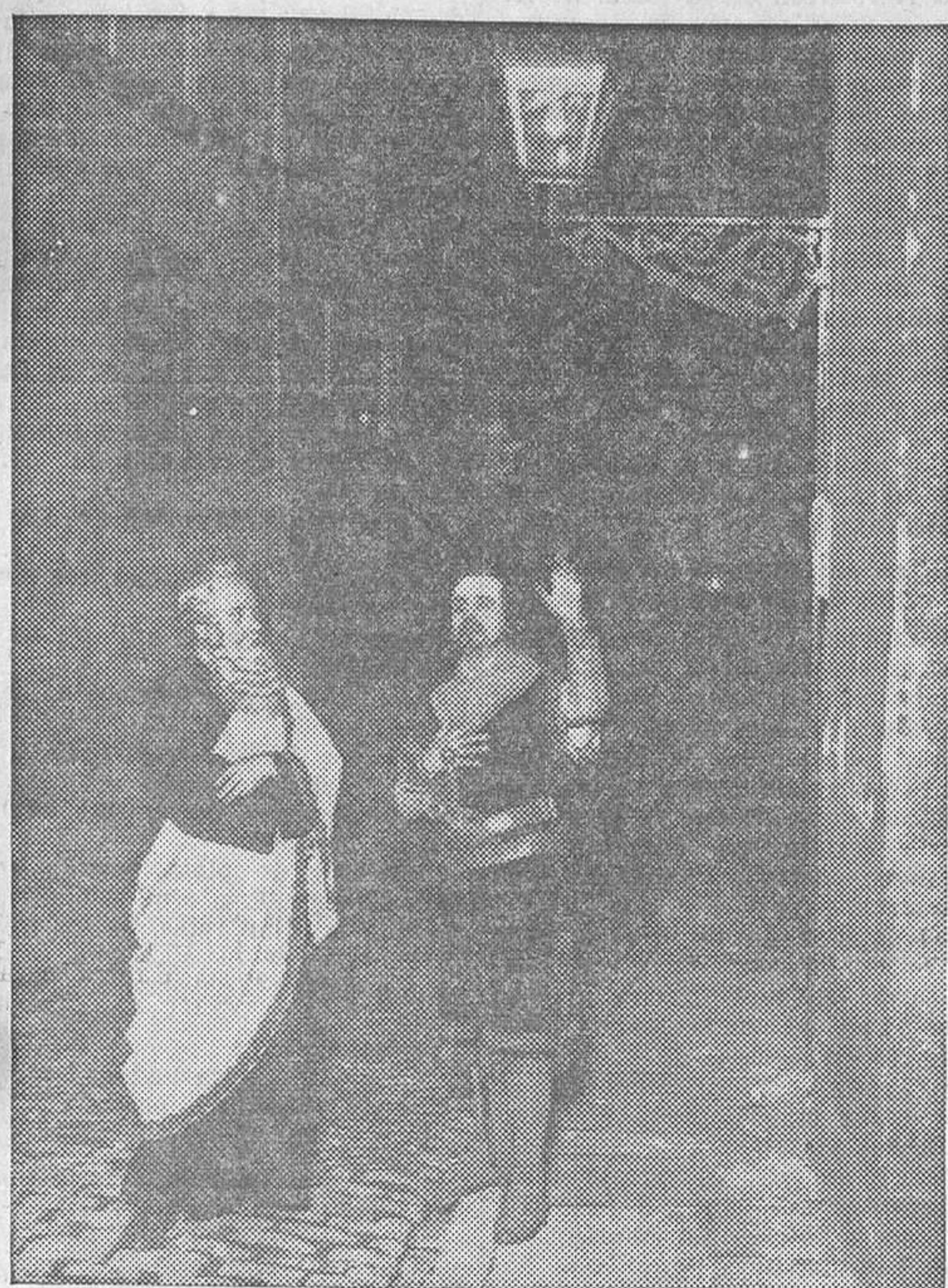
El auto sacramental representado en la plaza de la Paja. El Mundo y el Caballero de la Cruz en una escena en la típica calle de la Redondilla