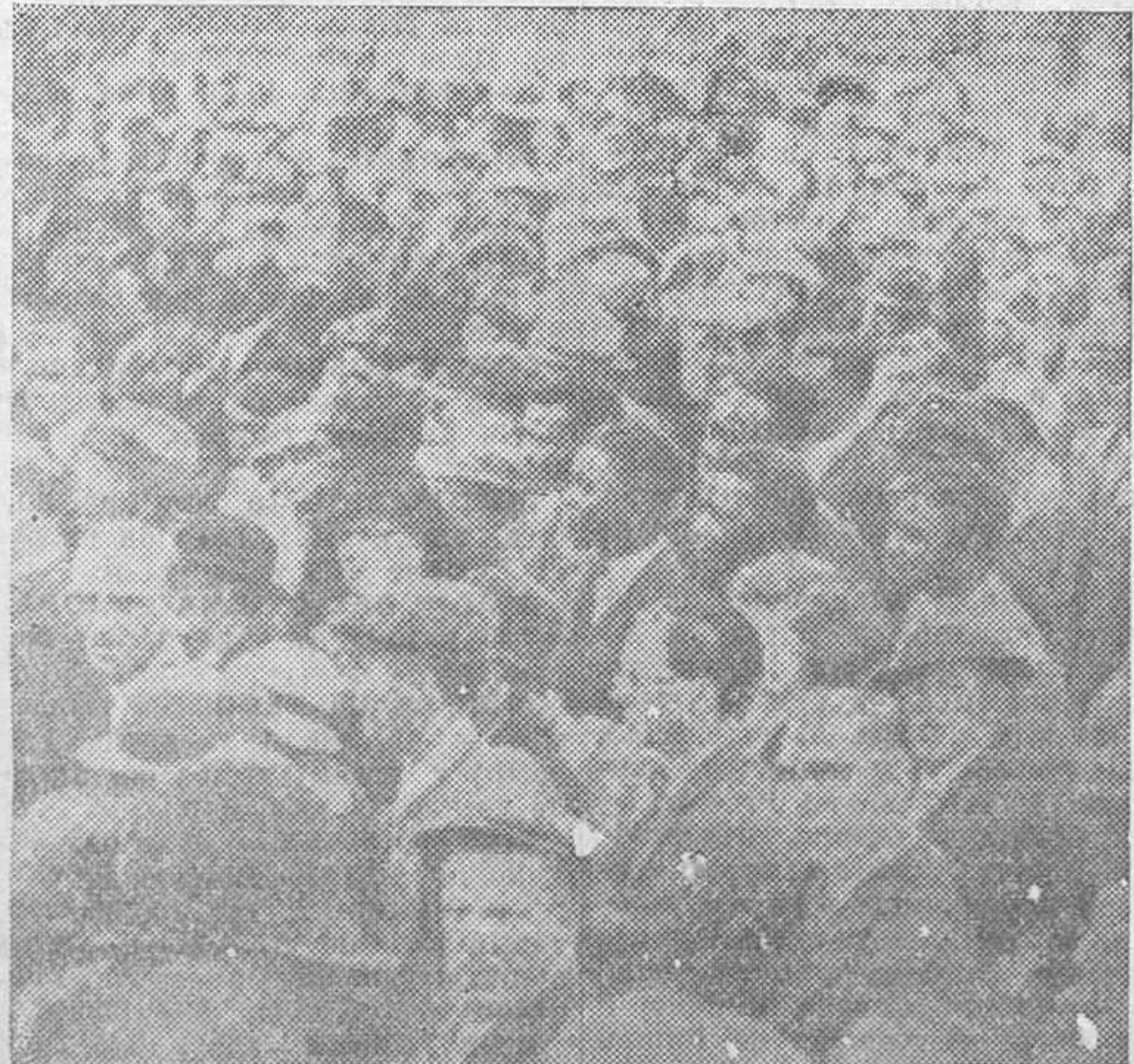
Los negros de Londres han celebrado una manifestación en Trafalgar Square contra Italia y a favor de Abisinia. Se trata de ingleses de color que viven en la metrópoli.

París, 27.—La Prensa de esta mañana concede gran interés a las declaraciones hechas por Mussolini