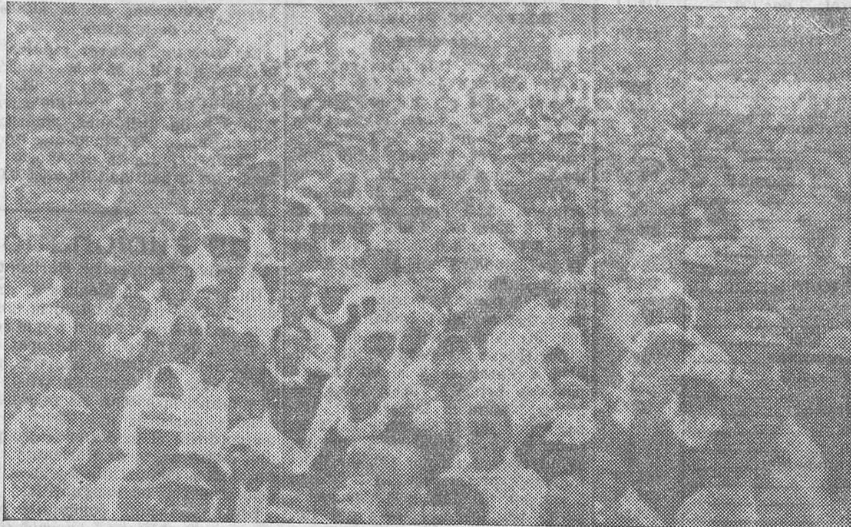
ABISINIA EN PELIGRO.—Para defender su independencia acuden a presentarse en la Oficina de reclutamiento de Addis Abeba millares de abisinios, llegados de todas las regiones de Etiopía

más dispuesta a no recurrir a sanciones más graves. Sin embargo, la atmósfera está cargada y la reunión de Ginebra se inaugurará en medio de un profundo mal-estar.