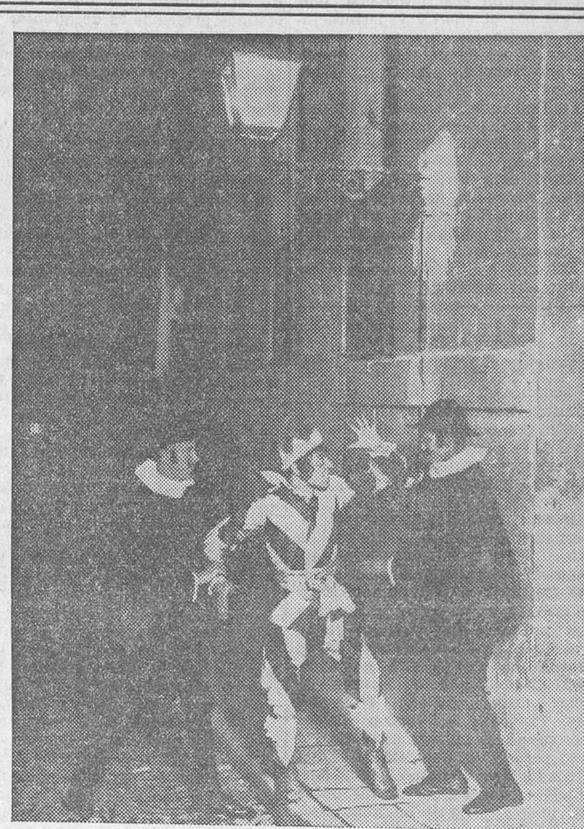
EL HOMENAJE A LOPE DE VEGA.—Una escena del auto sacramental «La puente del Mundo», en la calle de la Redondilla