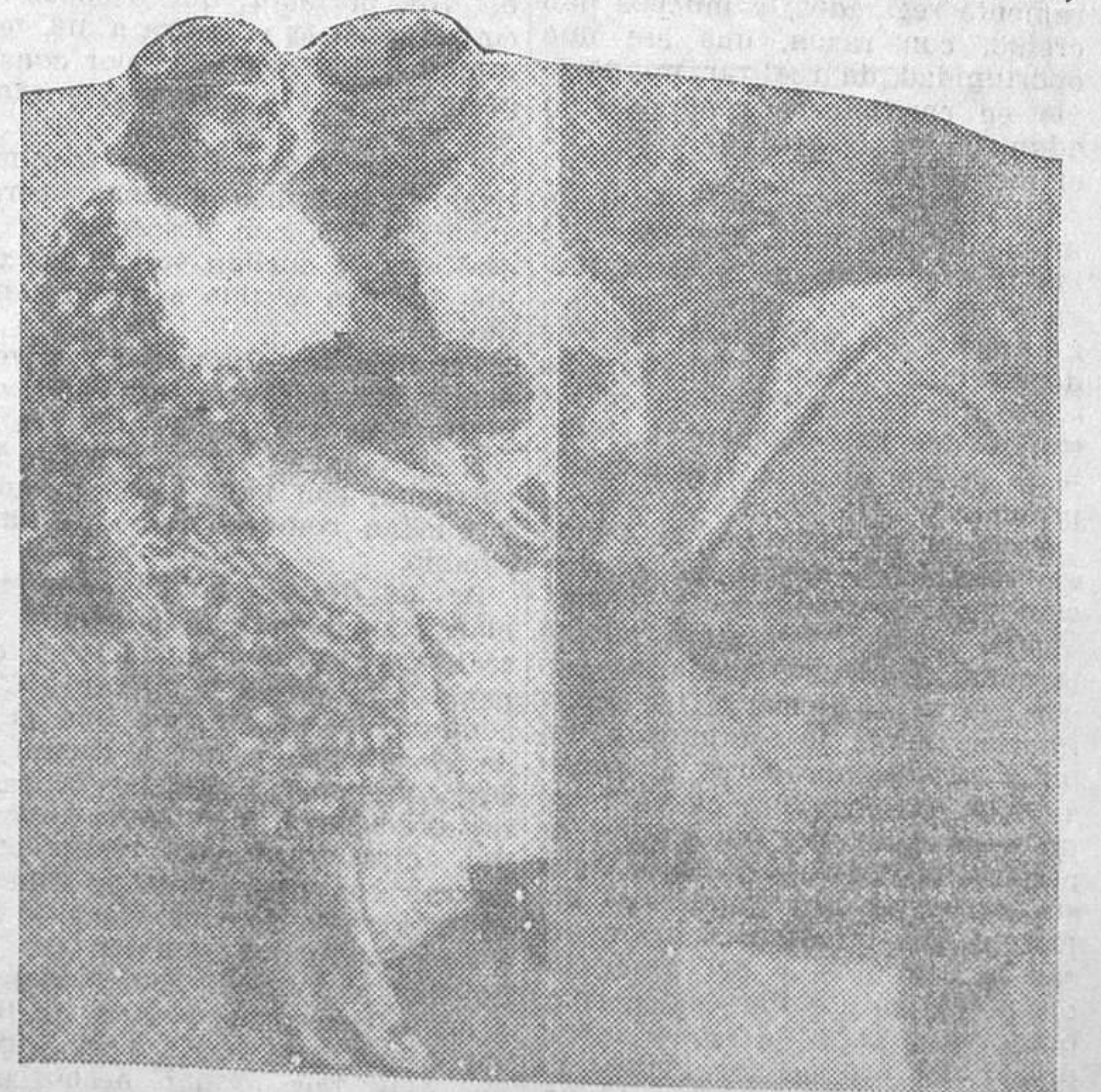
Los oradores de la manifestación de Trafalgar Square a favor de Abisinia