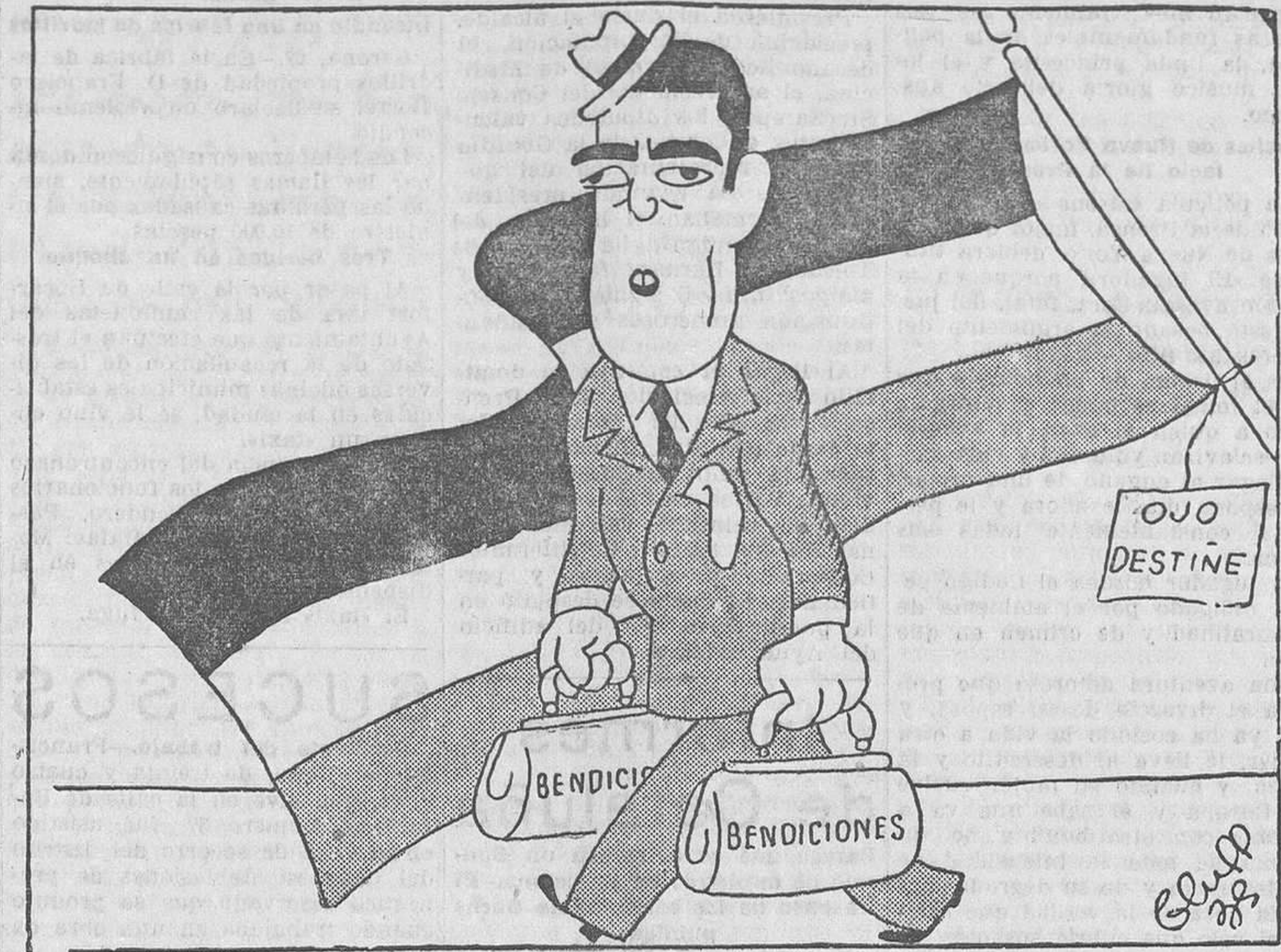
LOS PASEOS DE PITA, por Bluff