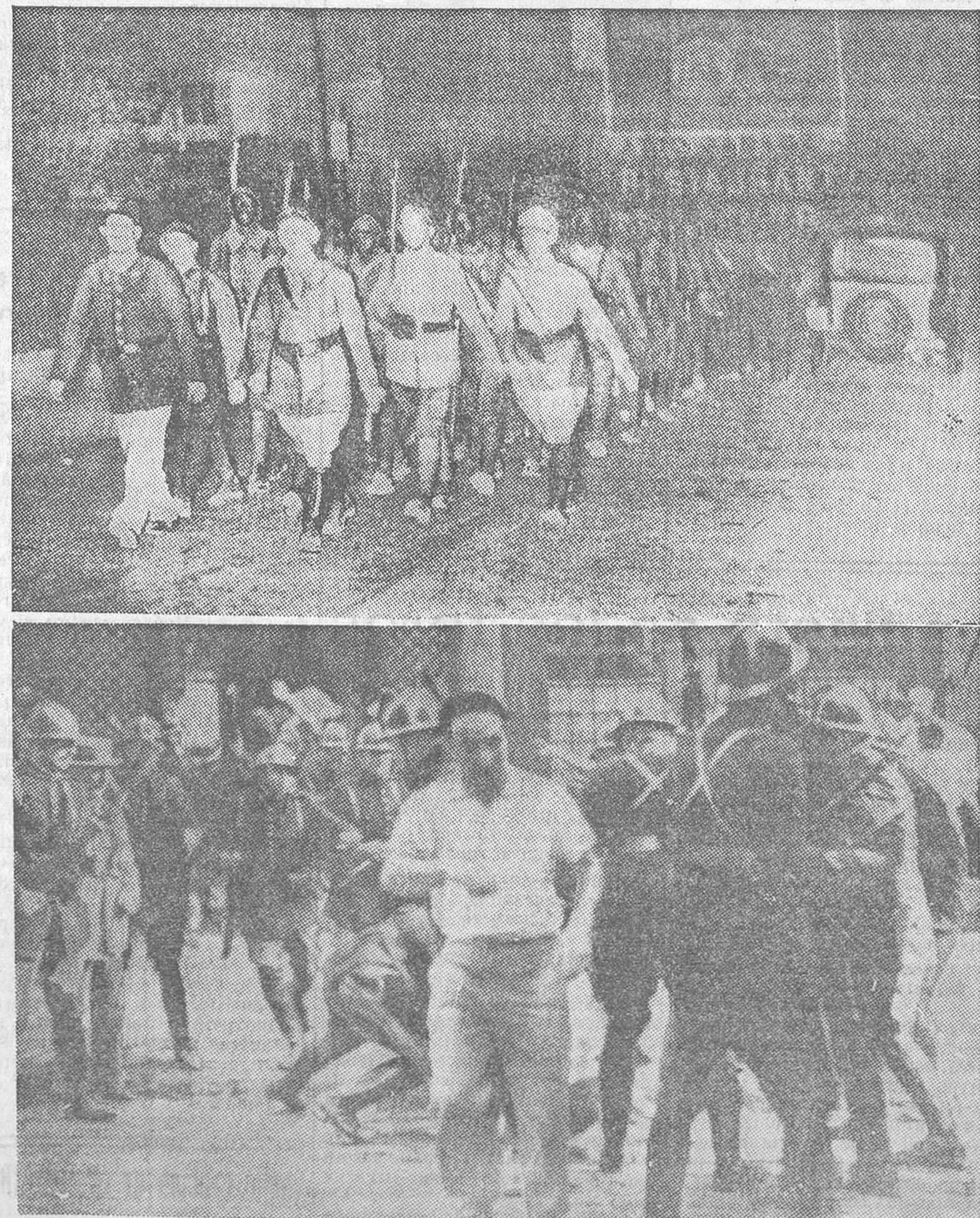
Cerca de la plaza del Gran Teatro de Tolón hubo un encuentro entre los manifestantes y la tropa. En ambas partes resultaron numerosos heridos.

«En una alcoba, y oculto en un colchón, fué encontrado el señor Largo Caballero... (Es mentira. Pero no importa. También es mentira y también se dirá que no se sabe quién mandó catorce millones de pesetas para hacer la revolución y que se los han guardado los revolucionarios. Como se ve, no hay nada nuevo bajo el sol. Ahora se ha dicho