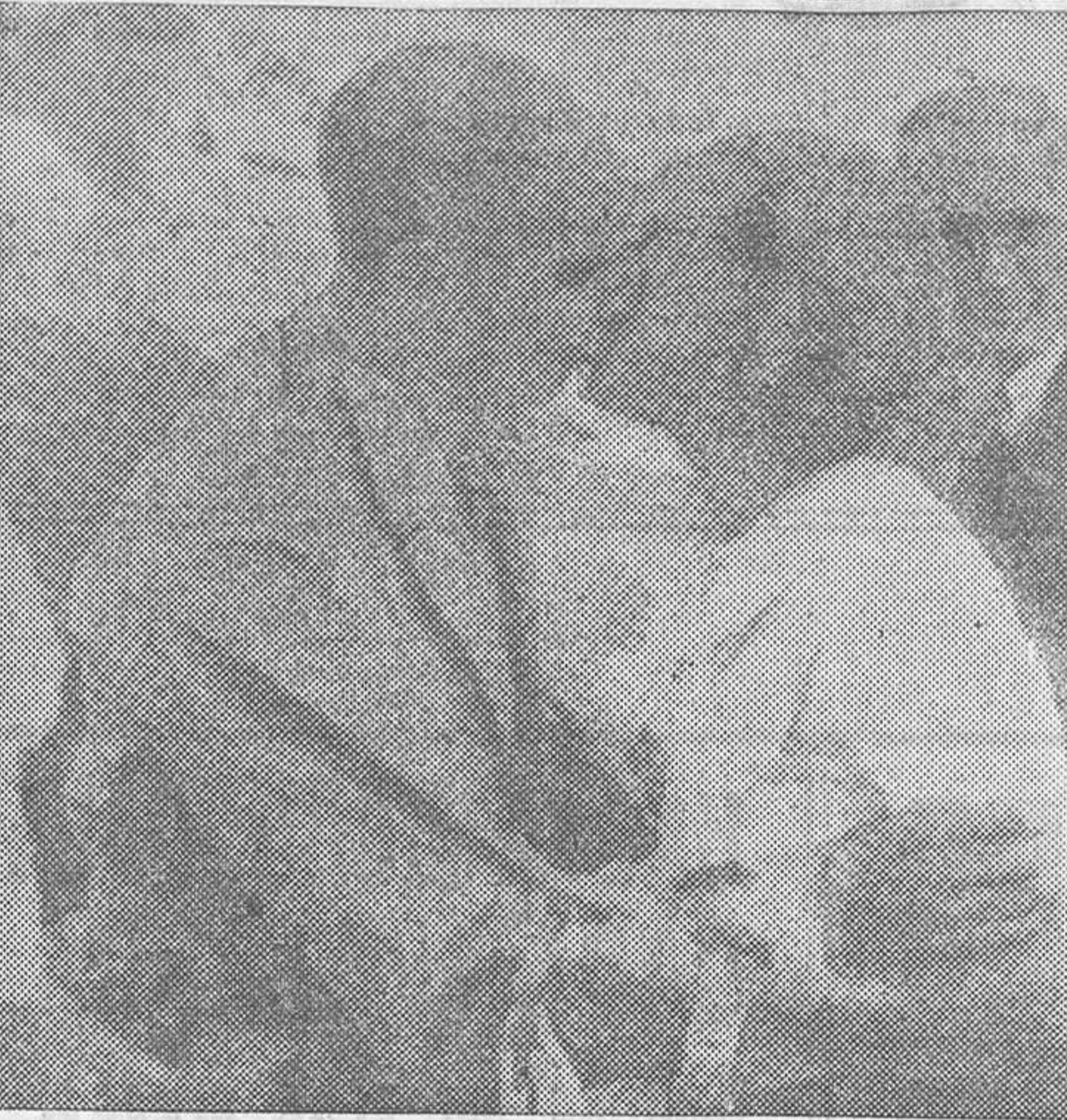
Campbell Black, el vencedor de Londres-Melbourne, que ha intentado el vuelo ultrarrápido Londres-El Cabo, y que al verse obligado a aterrizar en El Cairo, regresó a Londres para preparar un segundo ensayo. El célebre se despidió de su joven esposa antes de partir