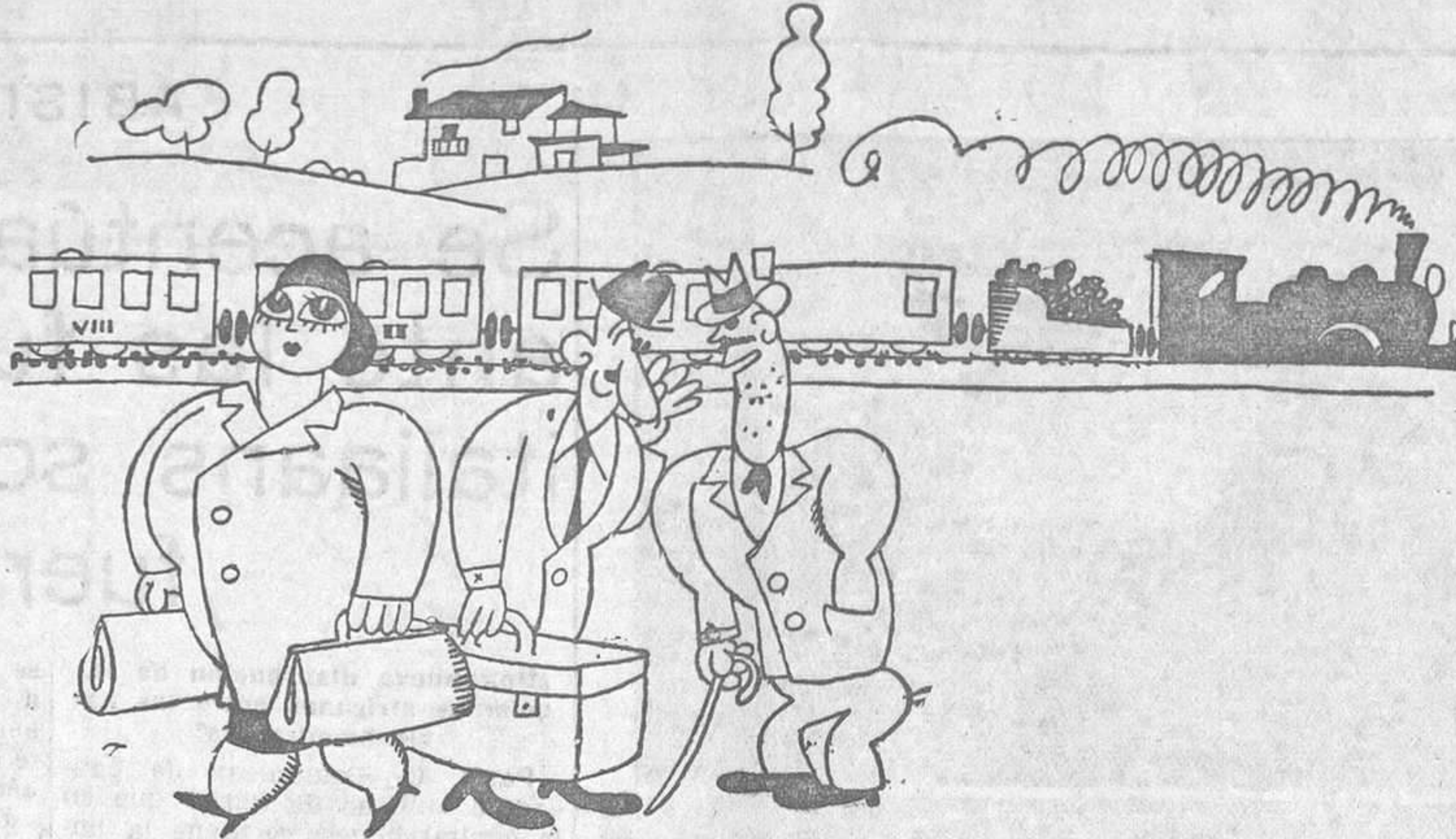
-Hombre, he tenido una gran curiosidad durante todo el viaje! ¿Por qué cada vez que se asomaba usted a la ventanilla obligaba a hacer lo propio a su esposa? -Para que no me entrase carbonilla en los ojos. Como los tiene ella tan grandes, se la llevaba toda.