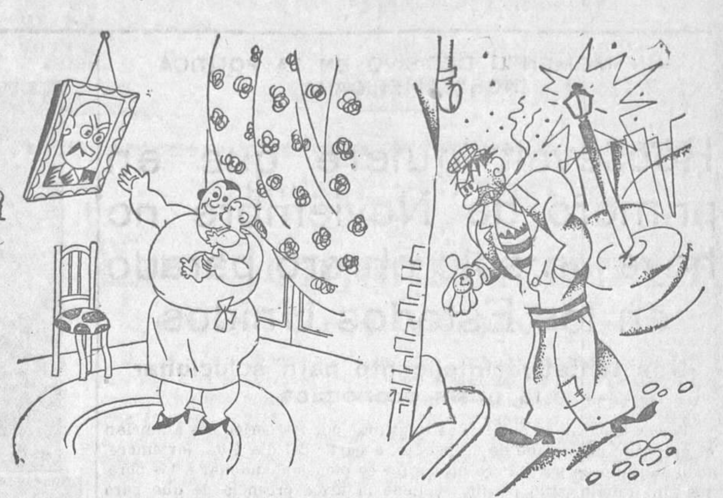
COSAS DE LA VIDA La esposa del hipnotizador duerme a su nene enseñándole el retrato de papá.