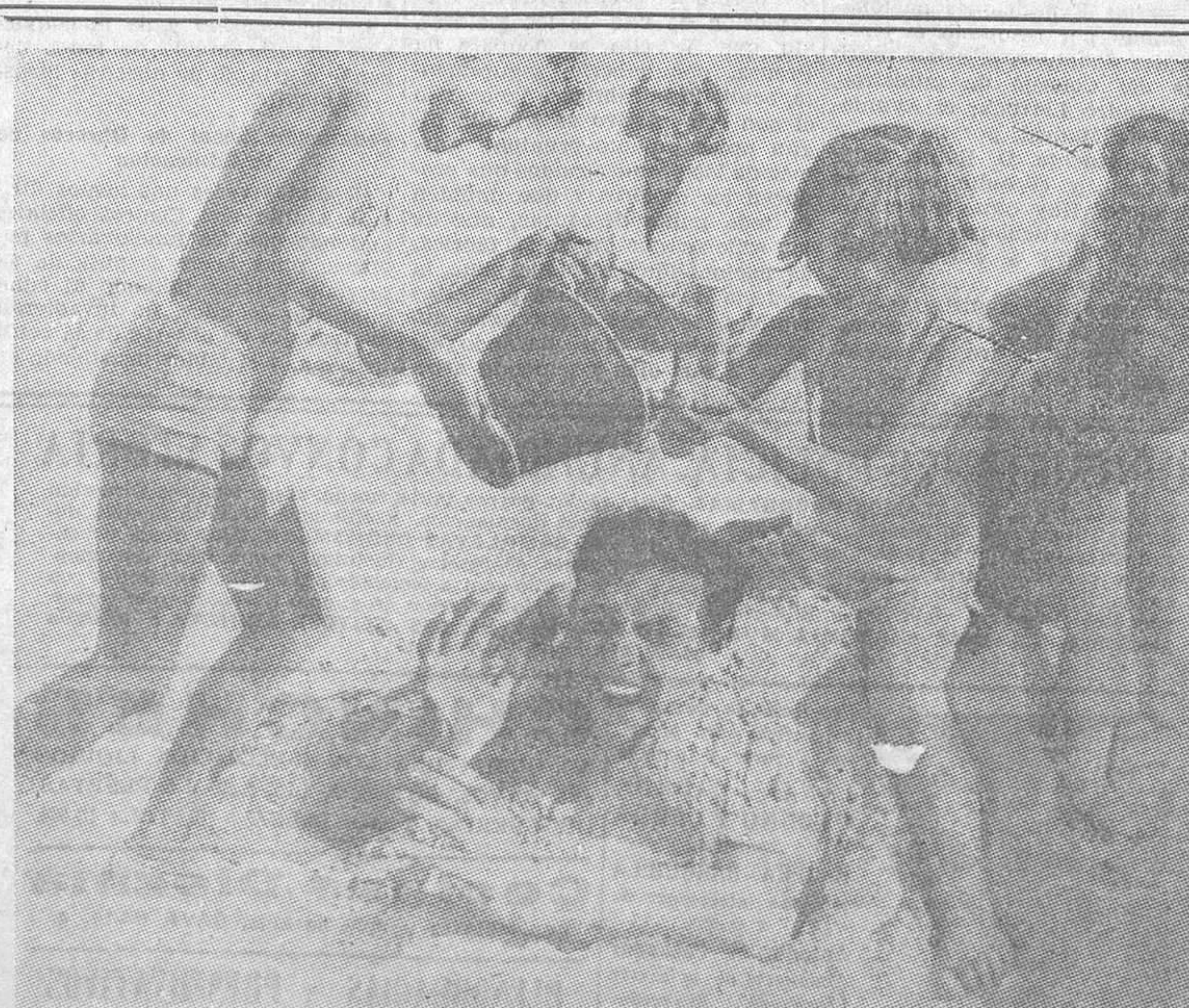
Escenas de la playa... de Brighton (Inglaterra)