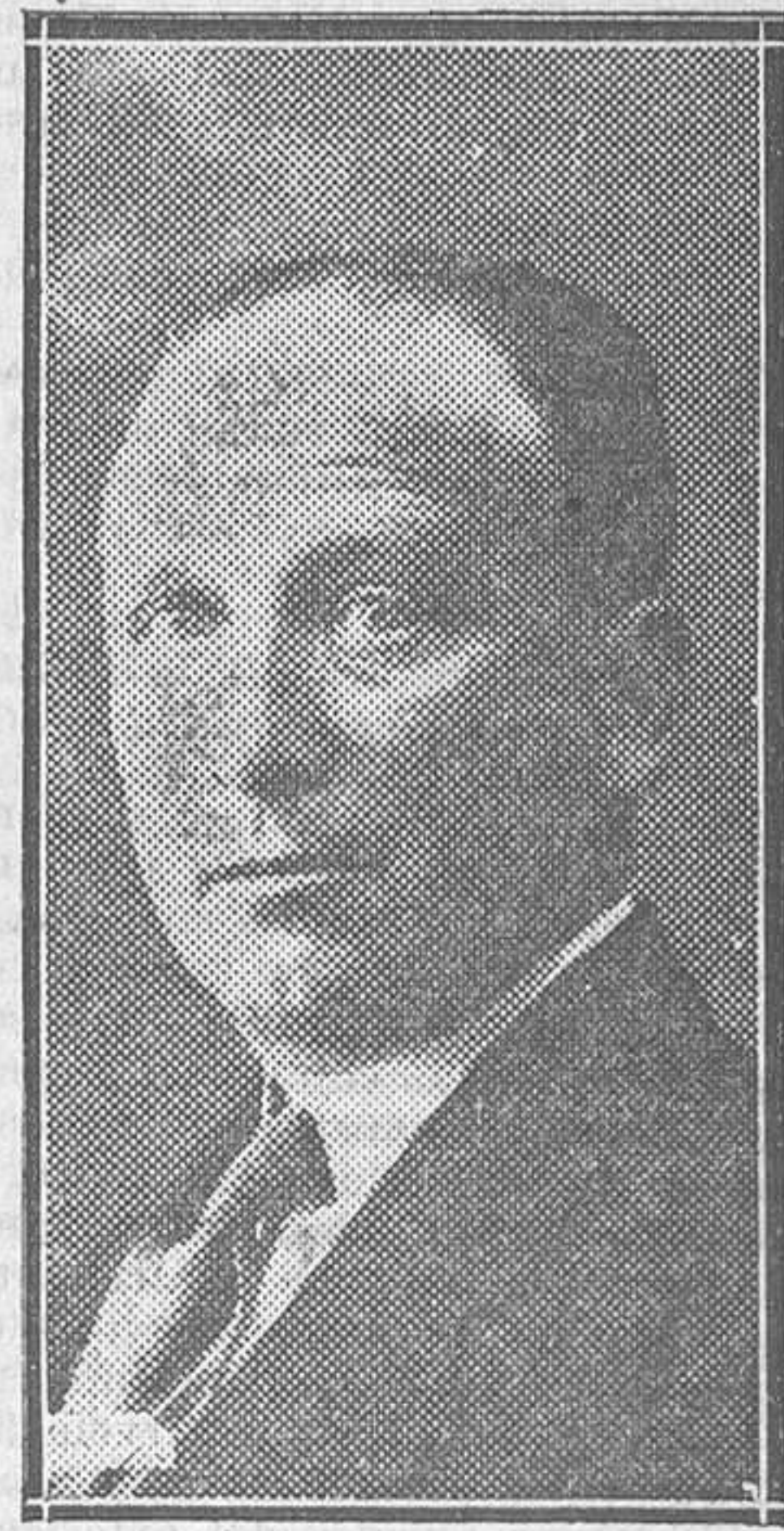
Don Francisco Largo Caballero

Agosto del 17. En los campos de Europa hace tres años que ruge la barbarie. En España hace tres años que se enriquecen negociantes, arrivistas y logreros. En España se negocia con todo. Con los barcos, con el carbón, con las lentejas, con el trigo, con las mulas... En todo hay negocios fabulosos. Y los fabricantes, los espías, los políticos mismos, todos, se aprovechan. Todos menos el pueblo. El pueblo que ve cómo se encarecen incomprensiblemente los artículos de consu-